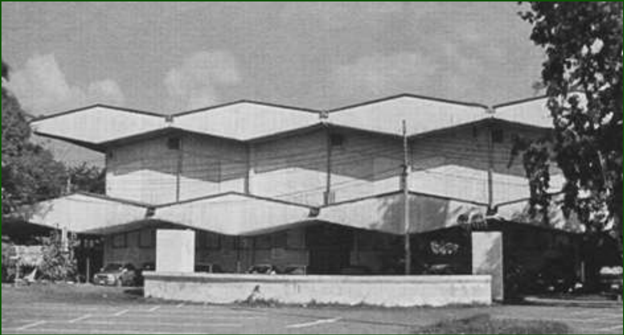
อาคารเทพศาสตร์สถิตย์ในอดีต