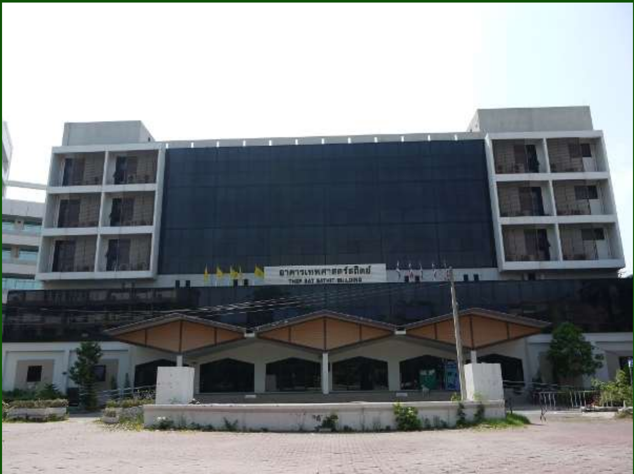
อาคารเทพศาสตร์สถิตย์ปัจจุบัน