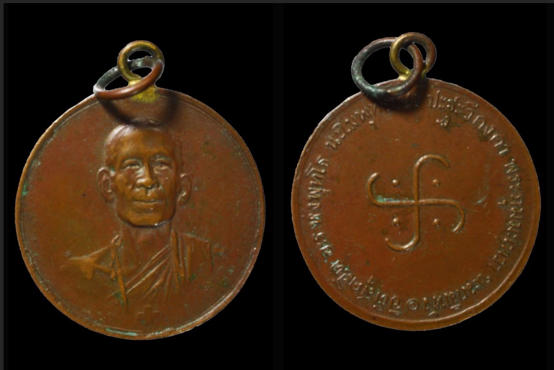
เหรียญรูปเหมือนหลวงพ่อโอภาสี รุ่นแรก