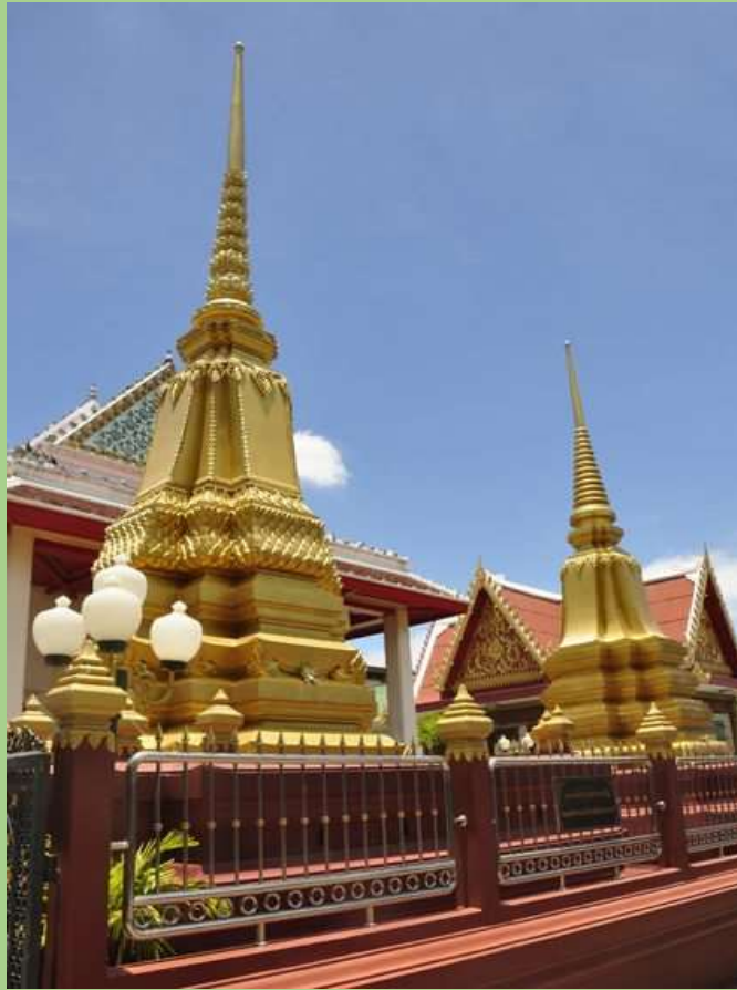
พระเจดีย์คู่กุฎชาติ

พระเจดีย์บรรจุ พระบรมอัฐิสมเด็จพระเจ้าตากสินมหาราช และพระบรมอัฐิพระอัครมเหสี