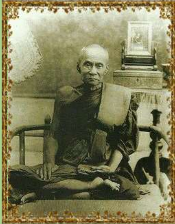
สมเด็จพระวันรัต (แดง สีลวฑฺฒโน)

http://www.amuletheritage.com/pdf/a28-new.pdf