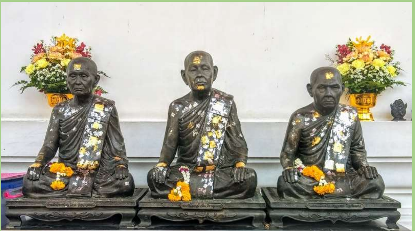
พระรูปหล่อ อดีตเจ้าอาวาสวัดอินทารามวรวิหาร