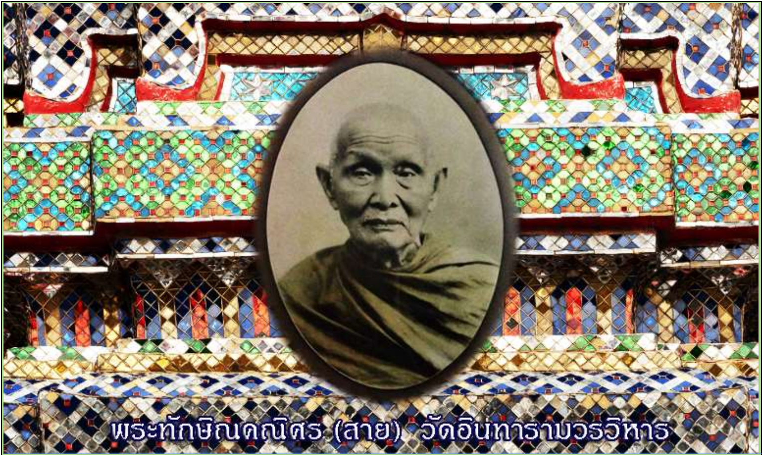
พระทักษิณคณิศร (สาย) วัดอินทารามวรวิหาร