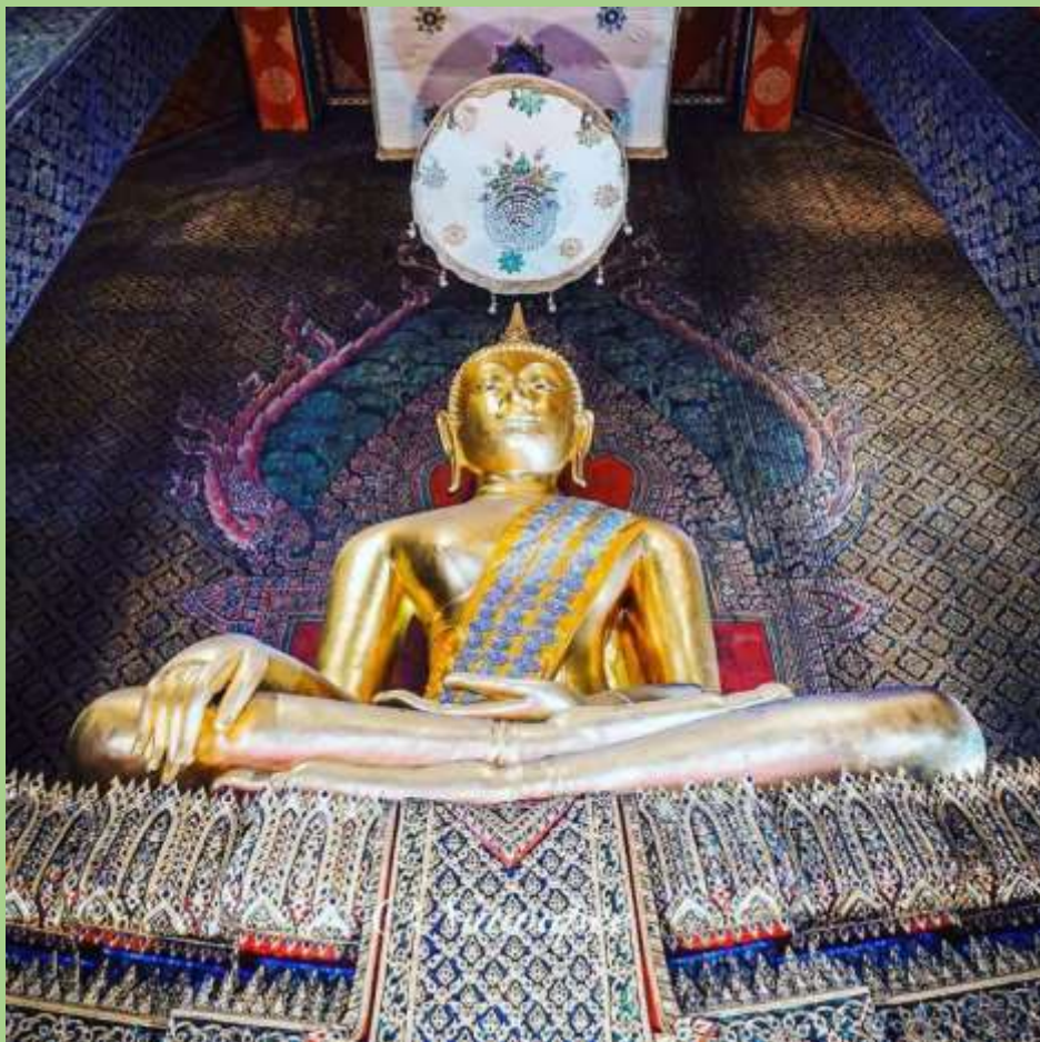
พระพุทธรชินวรเป็นพระประธานในสมัยรัชกาลที่ 3 ในพระอุโบสถ วัดอินทารามวรวิหาร