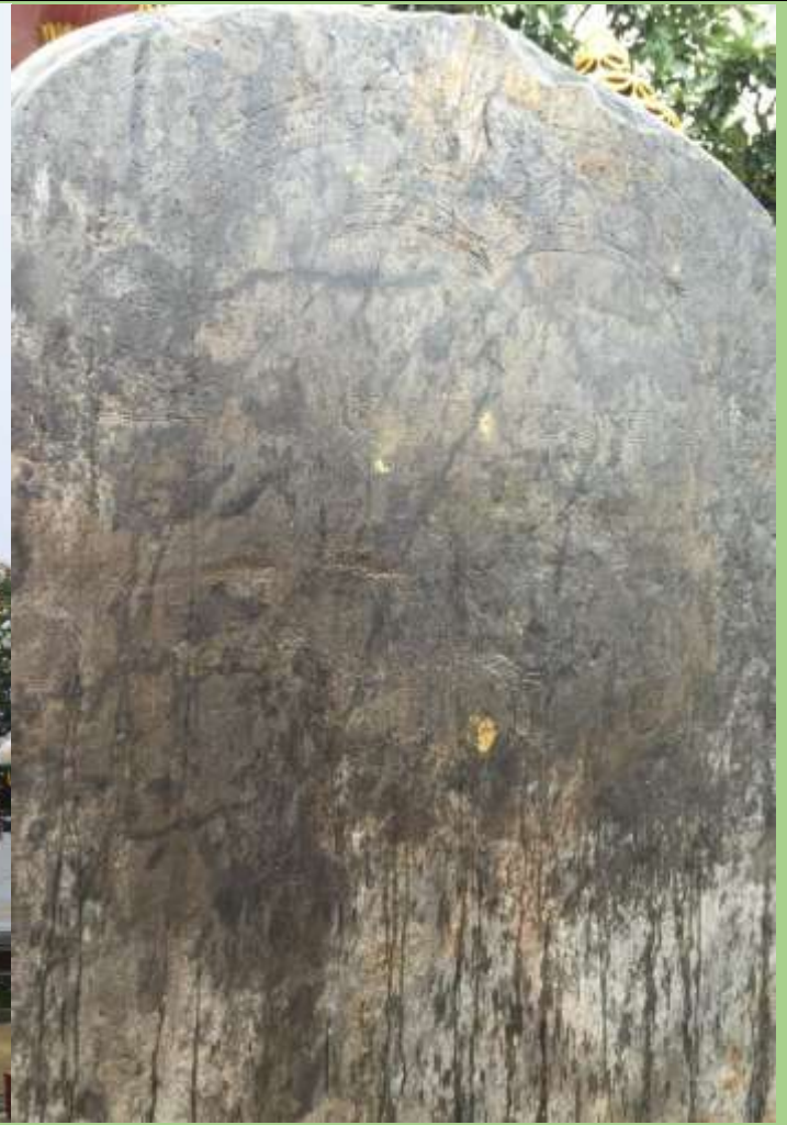
แผ่นศิลาจารึกตำรายา ข้างหน้าพระบรมรูปสมเด็จพระเจ้าตากสินมหาราช