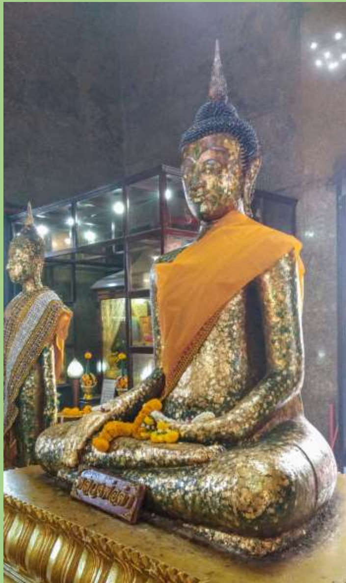
หลวงพ่อดำ เล่ากันว่า สมเด็จพระเจ้ากรุงธนบุรีอัญเชิญมาจากมหาชัย