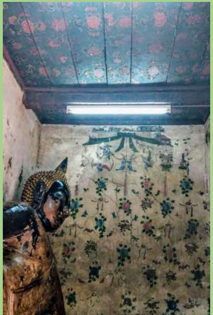
พระปางไสยาสน์