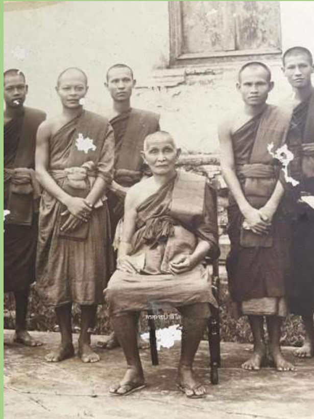
พระทักษิณคณิศร (สาย ปุณฺณคฺงโค)