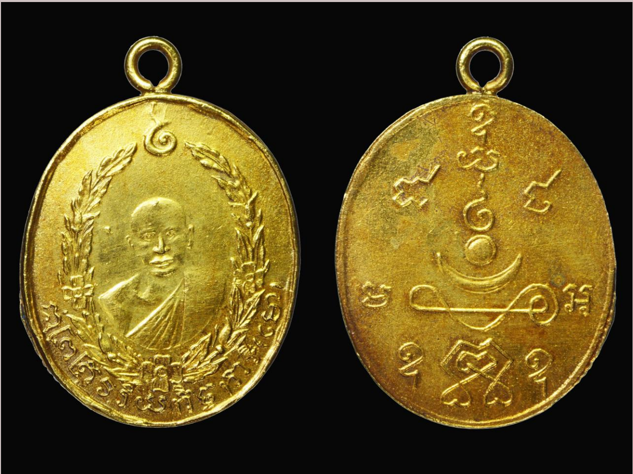
เหรียญรูปเหมือนหลวงพ่อโม สร้างปีพ.ศ. 2460