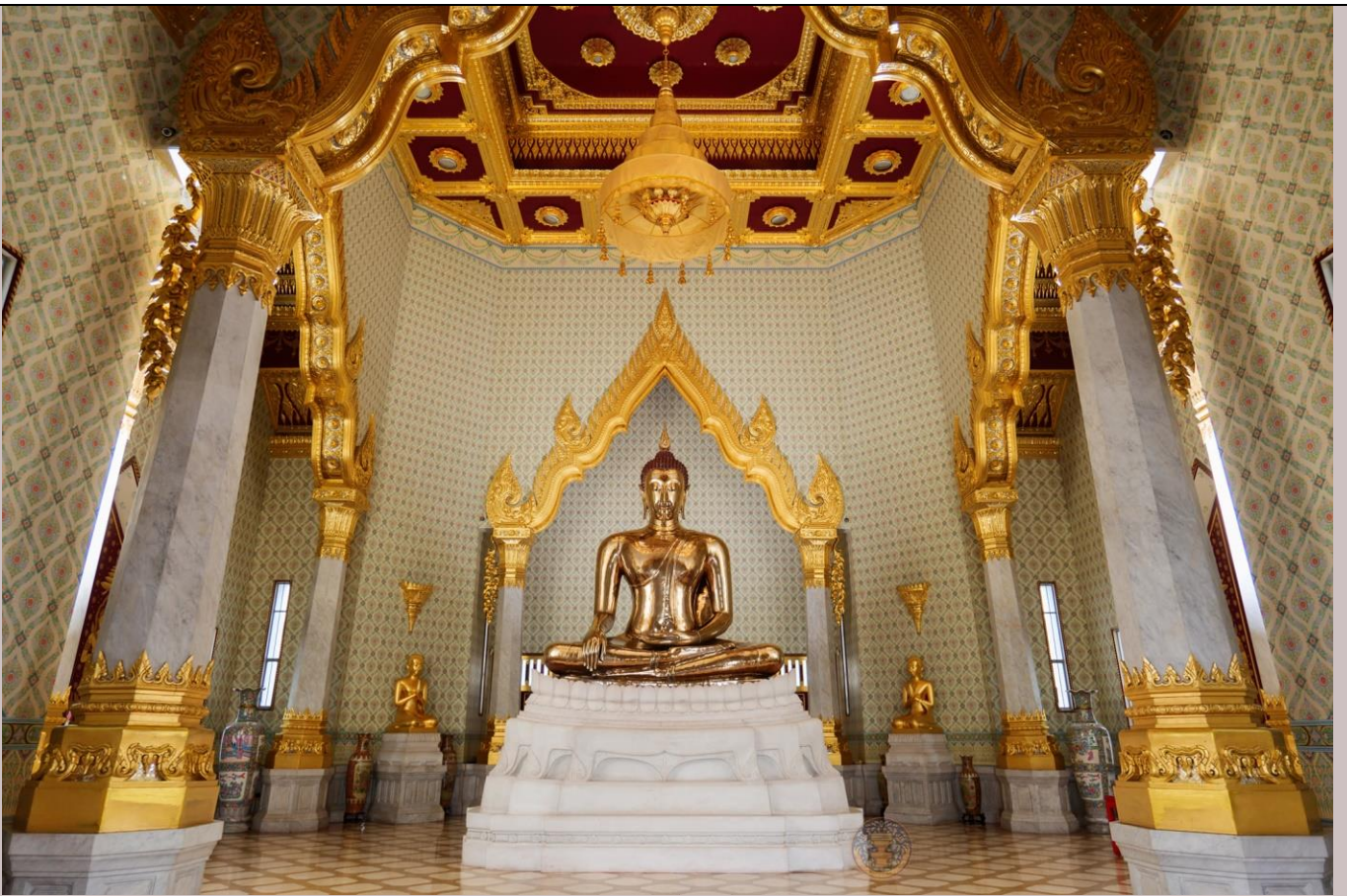
พระพุทธสุโขทัยไตรมิตร