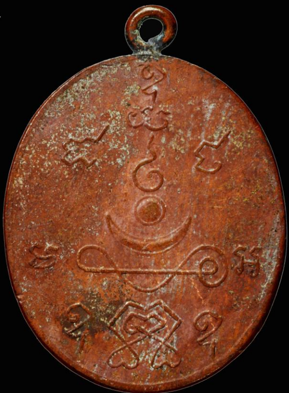
เหรียญรูปเหมือนหลวงพ่อโม สร้างปีพ.ศ. 2460