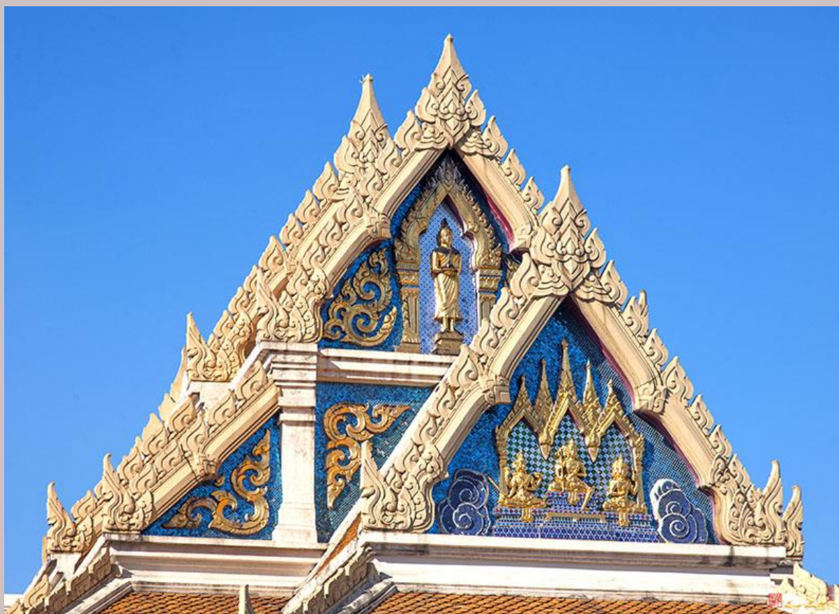
ภาพความงดงามภายในวัดวัดไตรมิตรวิทยาราม