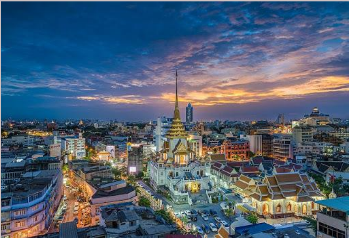
ภาพความงดงามภายในวัดวัดไตรมิตรวิทยาราม