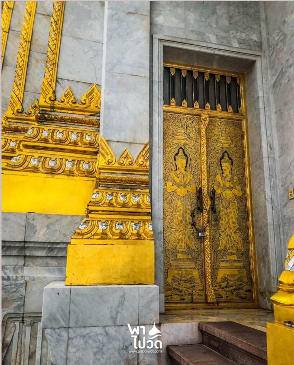
ภาพความงดงามภายในวัดวัดไตรมิตรวิทยาราม