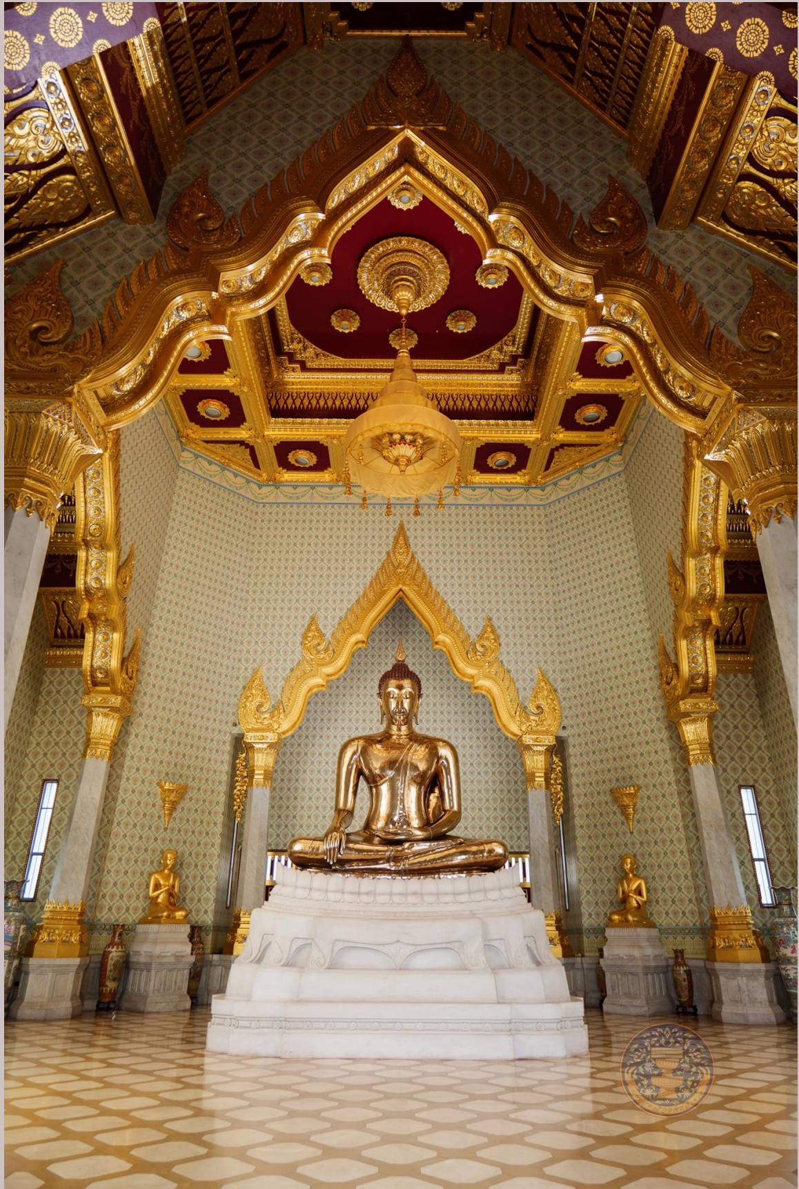
ความงดงามของพระพุทธรูปทองคำสุโขทัยไตรมิตร