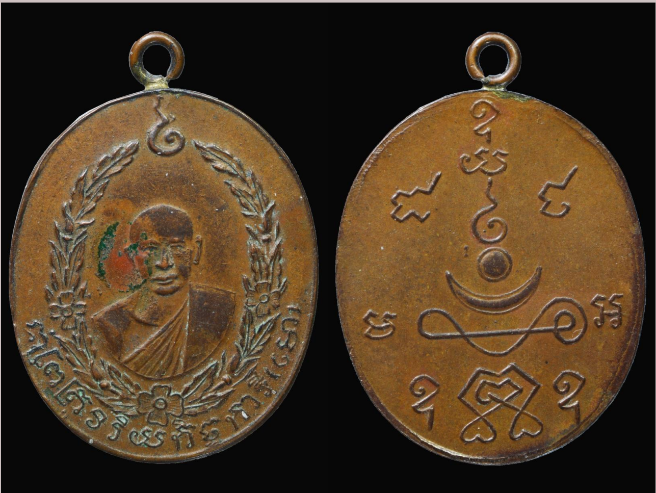
เหรียญรูปเหมือนหลวงพ่อโม สร้างปีพ.ศ. 2460