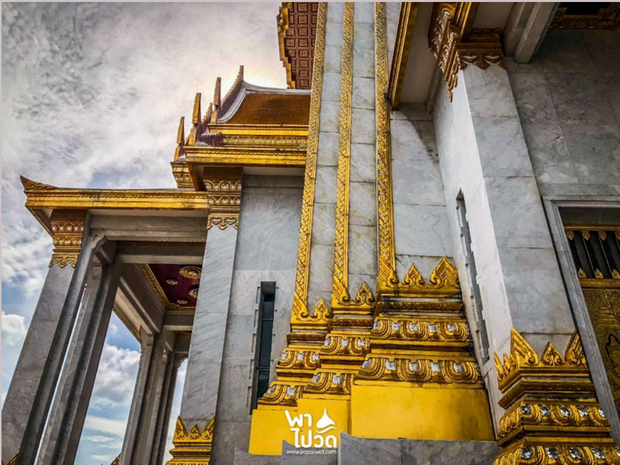
ภาพความงดงามภายในวัดวัดไตรมิตรวิทยาราม