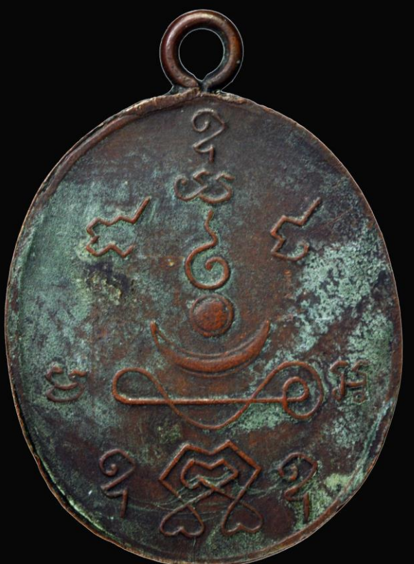
เหรียญรูปเหมือนหลวงพ่อโม สร้างปีพ.ศ. 2460