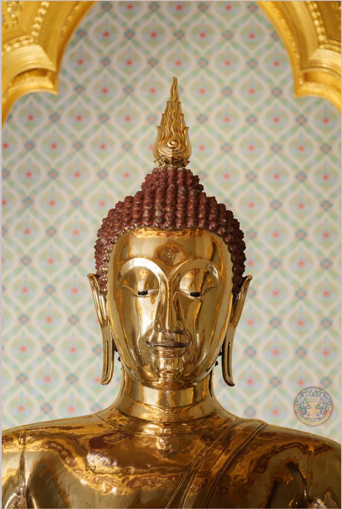
ความงดงามของพระพุทธรูปทองคำสุโขทัยไตรมิตร