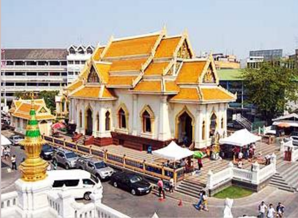
พระอุโบสถหลังปัจจุบัน

ต่อมาเมื่อเกิดมหาสงครามโลกครั้งที่ ๒ ลูกระเบิดได้ลงในที่ไมไกลจากพระอุโบสถเท่าไรนัก แรงสั่นสะเทือนของอำนาจระเบิด ทำให้พระอุโบสถทั้งหลังยากต่อการบูรณปฏิสังขรณ์ ตกอยู่ในสภาพที่เป็นอันตรายได้ จึงได้ทำการรื้อลงเมื่อ พ.ศ. ๒๔๙๓ หลังจากที่ได้สร้างพระอุโบสถหลังใหม่แล้ว