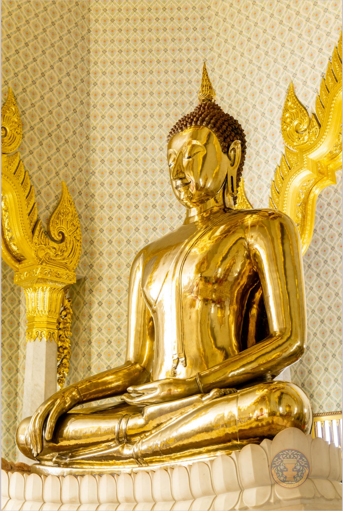
ความงดงามของพระพุทธรูปทองคำสุโขทัยไตรมิตร