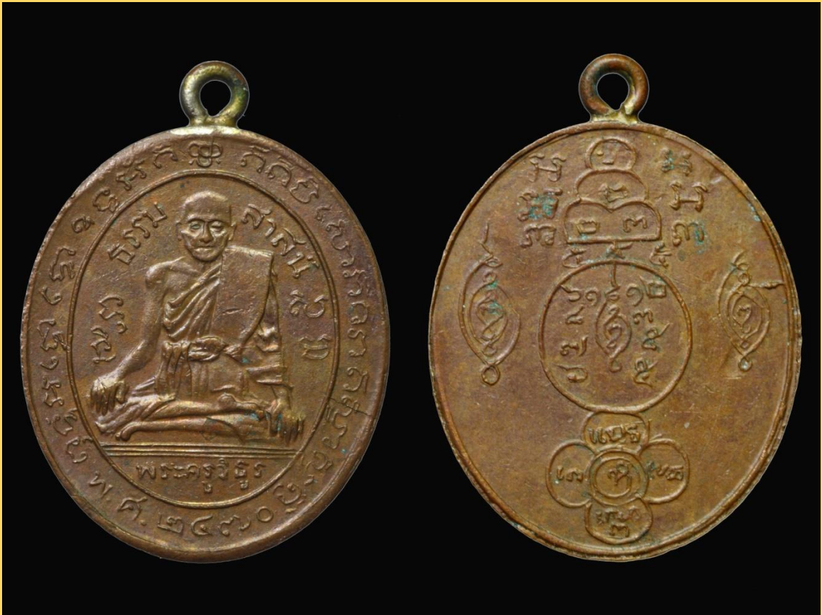
เหรียญปั๊มหลวงพ่อก่่อม วัดโพธารวาส ปี 2470