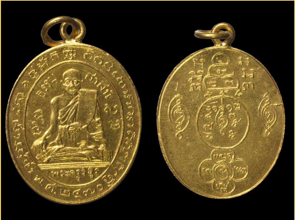
เหรียญปั๊มหลวงพ่อกล่อม วัดโพธารวาส ปี 2470