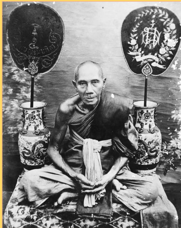
หลวงพ่อกั่น วัดพระญาติการาม