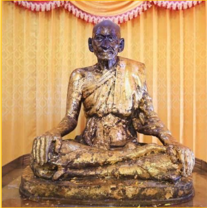
รูปหล่อหลวงพ่อก่อม ณ วัดโพธาราม

นอกจากนี้ ยังตั้งใจศึกษาพระปริยัติธรรมและท่องบทสวดมนต์เจ็ดตำนานสิบสองตำนานจนขึ้นใจ มุ่งมั่นปฏิบัติวิปัสสนาธุระ จนเป็นที่เคารพศรัทธาของพระภิกษุ สามเณร และชาวบ้านทั้งหลาย