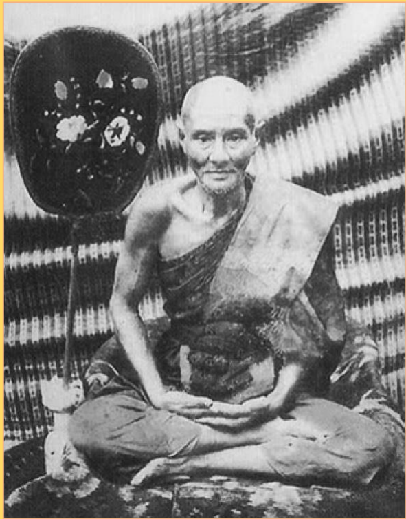
หลวงพ่อเม้ายิ้ม วัดหนองบัว