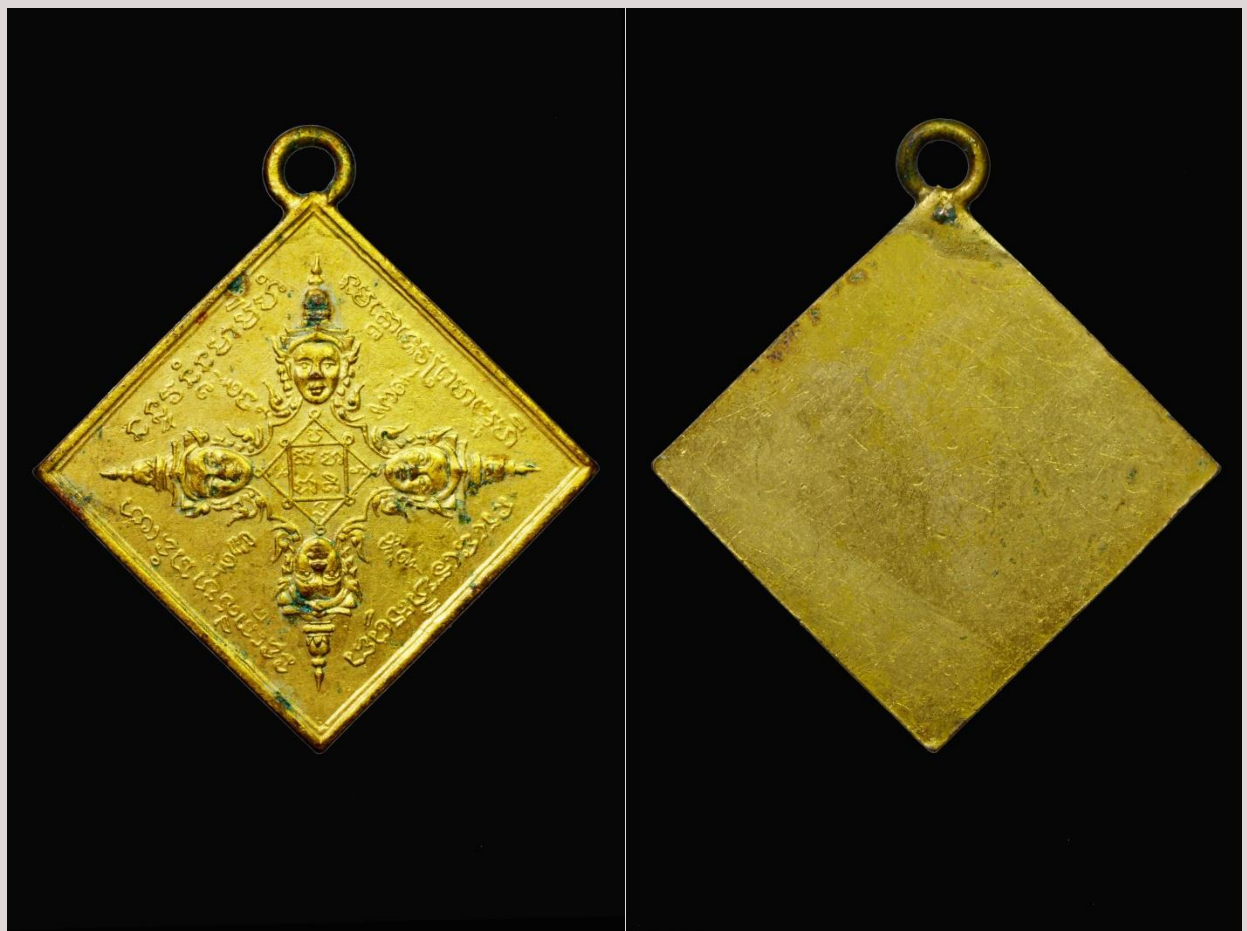
เหรียญพระพรหม ท่านอาจารย์เฮง พิมพ์ข้าวหลามตัด