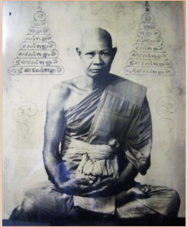
หลวงพ่อกี้ (พระครูกิตตินนทคุณ)