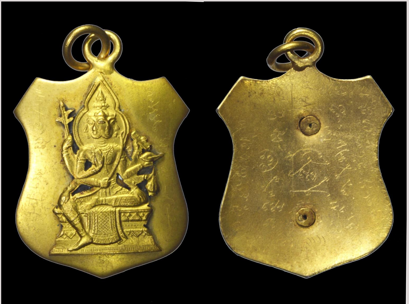
เหรียญพระพรหมสี่หน้า อาจารย์เฮง ไพรวัลย์ พิมพ์โลหะ

เหรียญพระพรหมสี่หน้า อาจารย์เฮง ไพรวัลย์ พิมพ์โลหะ ลักษณะเหรียญนี้ได้จำลองคพระพรหมเป็นแบบลอยองค์ แล้วนำมายึดกับพื้นเหรียญด้วยการตอกตาไก่แบบโบราณ พร้อมทั้งลงจารยันต์ต่างๆ ทั้งด้านหน้าและด้านหลังเหรียญตามแบบฉบับของท่านอาจารย์เฮง ไพรวัลย์ และ หลวงปู่สี พินทสุวณฺณ วัดสะแก อยุธยา