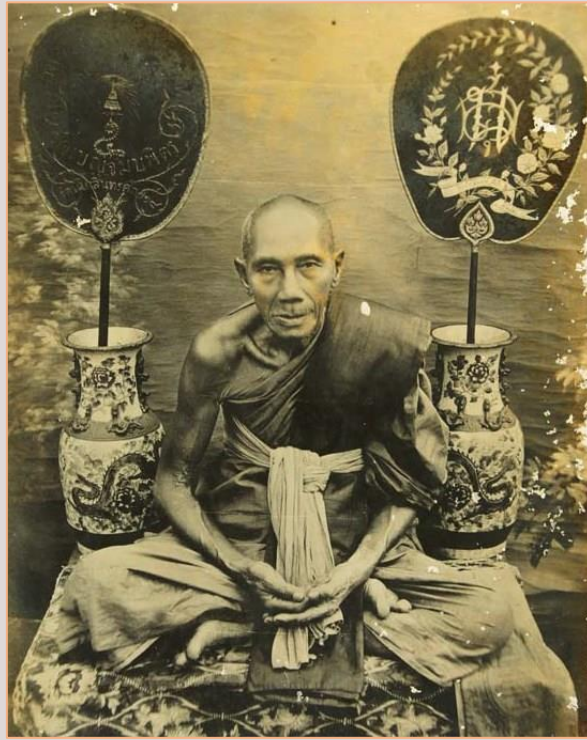
หลวงพ่อกั่น ธรรมโชติ

http://www.amuletheritage.com/pdf/a19.pdf