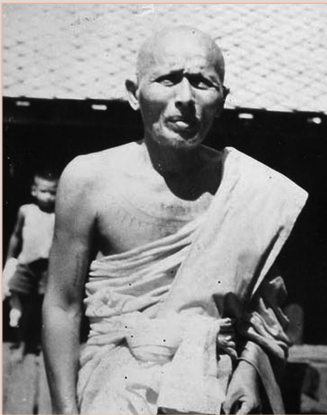
หลวงพ่อแทน ธรรมโชติ