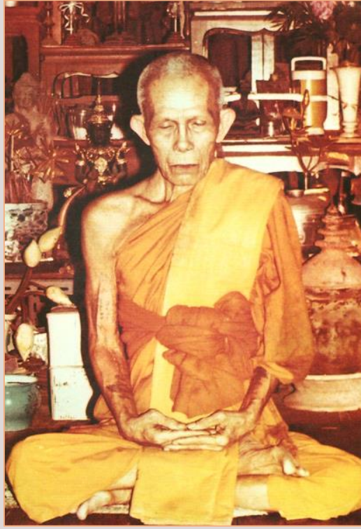
หลวงปู่สีห์ พินทสุวณฺโณ วัดสะแก

http://www.amuletheritage.com/pdf/a20.pdf