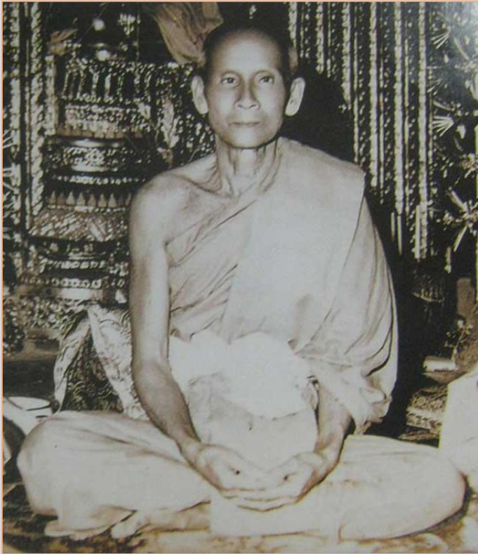
หลวงพ่อเทียม (พระวิสุทธาจารย์เถร)