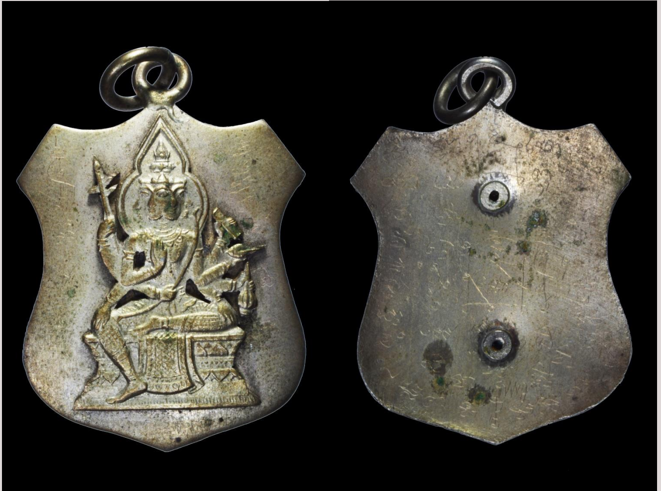
เหรียญพระพรหมสี่หน้า อาจารย์เฮง ไพรยวัล พิมพ์โลหะ