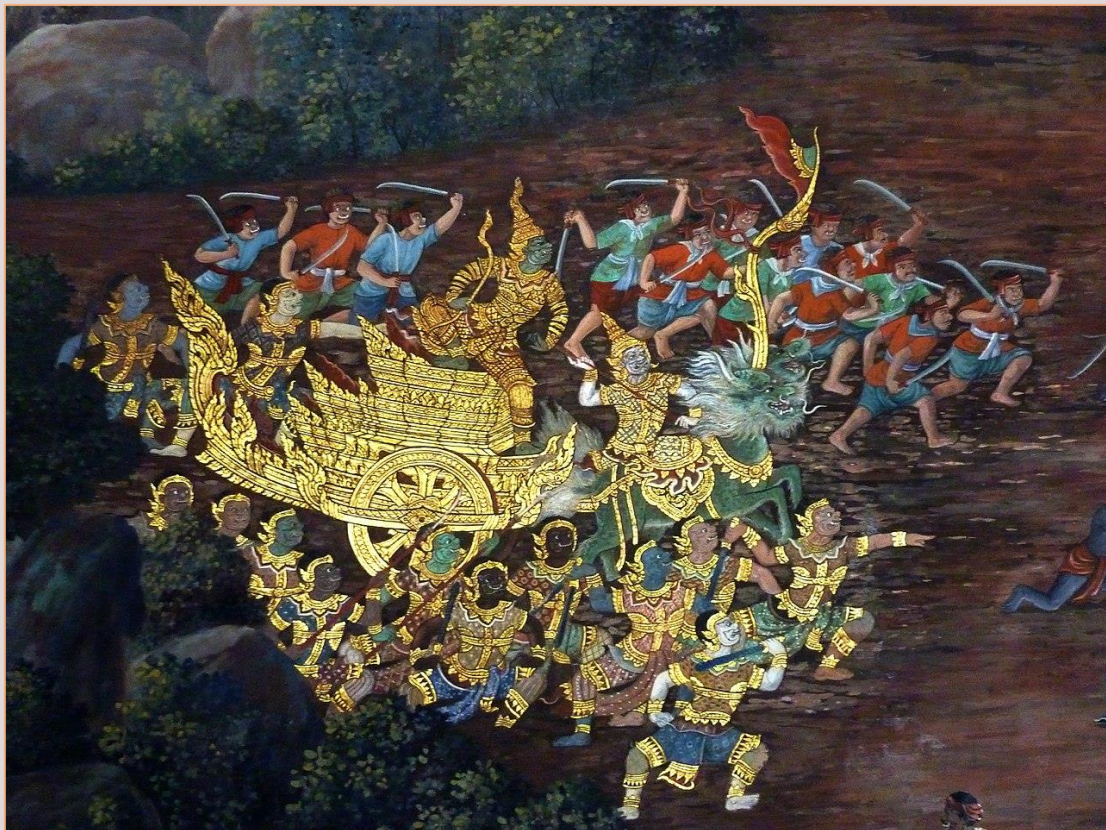
ส่วนหนึ่งของจิตรกรรมฝาผนังเรื่องรามเกียรติ์ ตอน ศึกมังกกรรฐ์ ที่ระเบียงคดวัดพระศรีรัตนศาสดาราม ผลงานของ ครูเหม เวชกร วาดเมื่อ พ.ศ. 2473