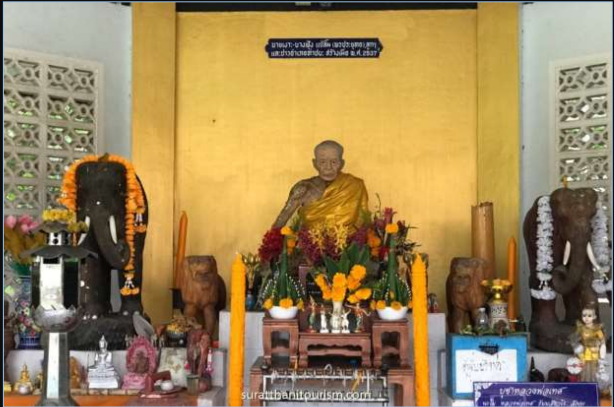
รูปหล่อ พระครูประสงค์สารการ (เทศน์ ธรรมส่วโร)