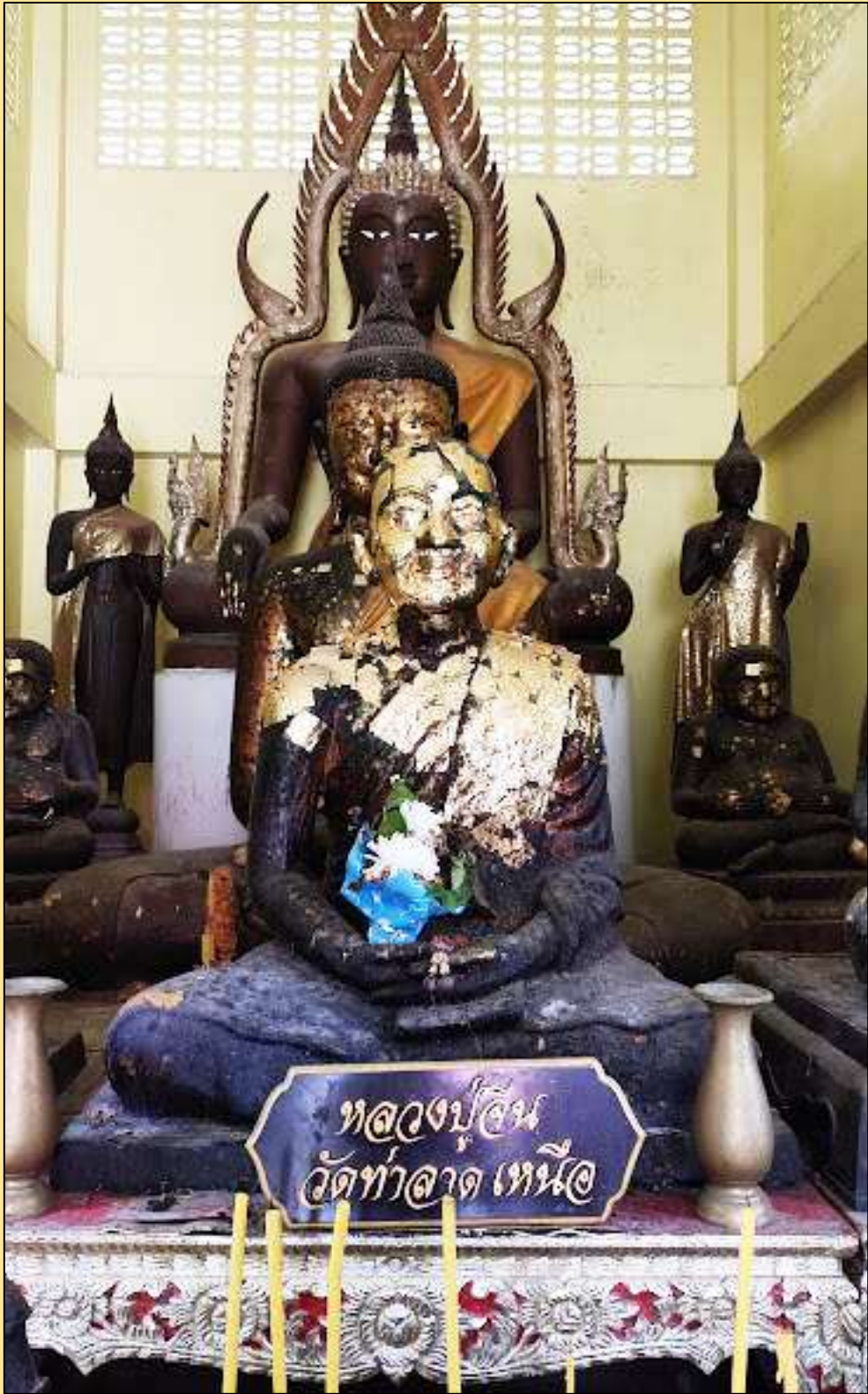
รูปหล่อหลวงปู่จีน ณ วัดท่าลาดเหนือ