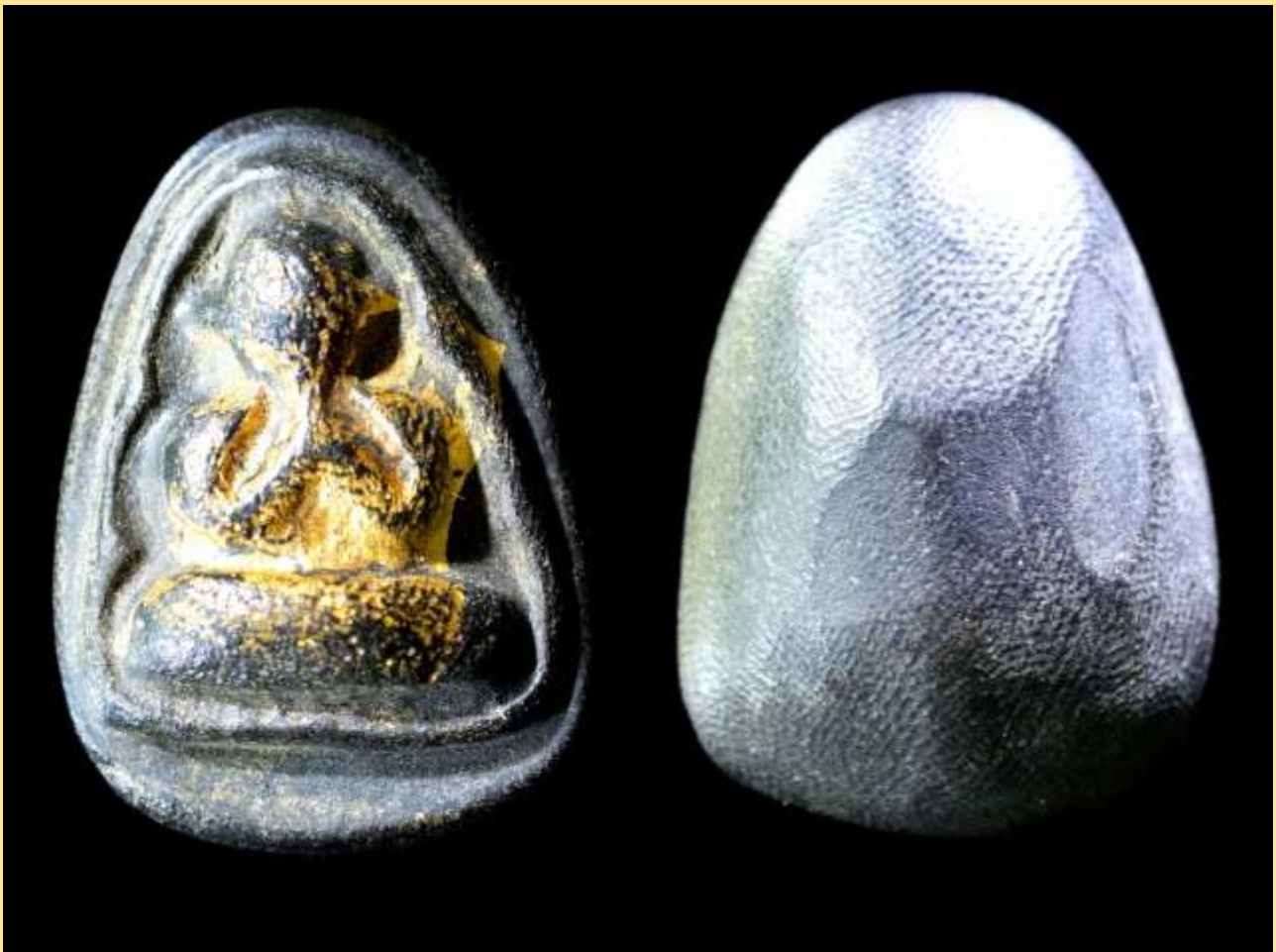
พระปิดตาหลวงปู่จิ้น พิมพ์แข่งหมอนใหญ่

พุทธลักษณะพระปิดตาหลวงปู่จิ้นนั้น องค์พระประธานนั่งขัดสมาธิราบ ศีรษะโล้น พระหัตถ์ปิดพระเนตร และมีเส้นโค้งรอบองค์ ด้านหลังส่วนใหญ่จะอุมเป็นแบบหลังเบี้ยหรือหลังประทุนแทบทุกองค์ และมักมีการลงรักทับไว้อีกชั้นหนึ่ง มีการจัดสร้างเป็นหลายพิมพ์ พิมพ์ที่เป็นพิมพ์นิยม มีอาทิ พิมพ์แข่งหมอน พิมพ์เม็ดกระบอก พิมพ์กليبบัวใหญ่ พิมพ์กليبบัวเล็ก และ พิมพ์ไม้ค้ำเกวียน เป็นต้น โดยพิมพ์แข่งหมอน นับเป็นพิมพ์นิยมอันดับหนึ่ง และพบน้อยมาก