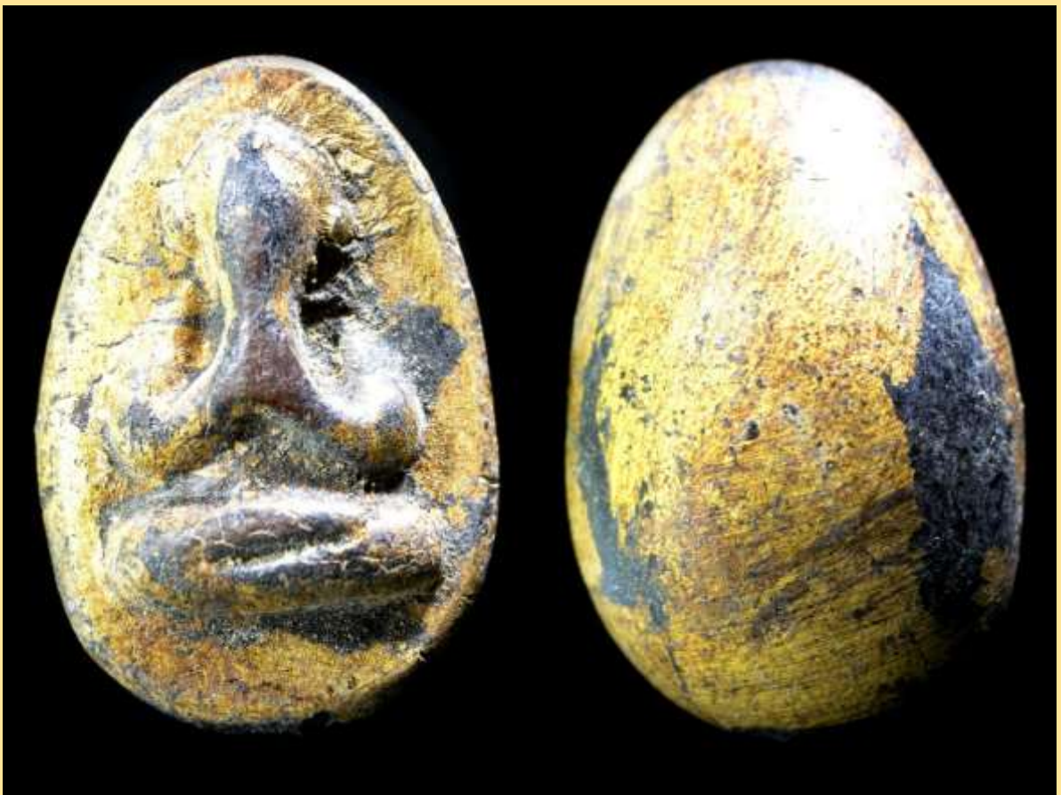
พระปิดตาหลวงปู่จิ้น พิมพ์กليبบัวใหญ่