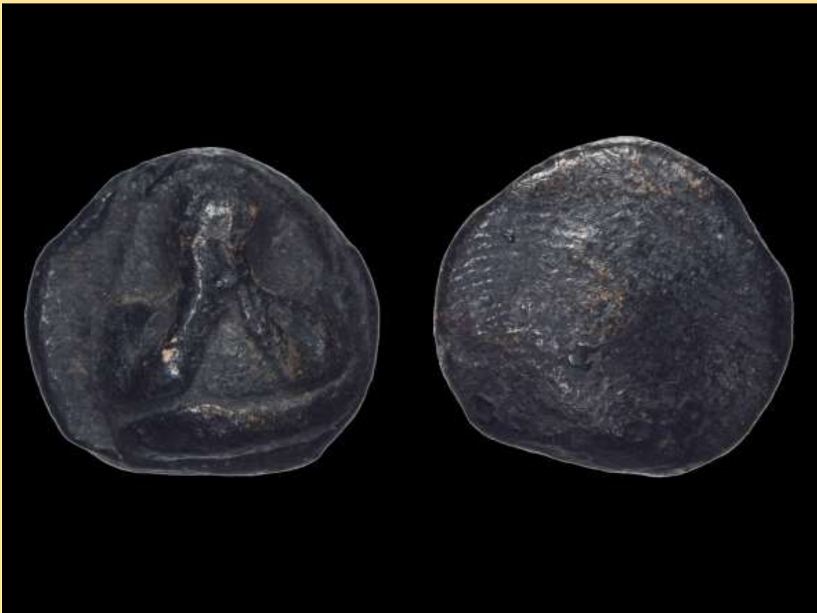
พระปิดตาหลวงปู่จิ้น พิมพ์แข่งหมอนเล็ก