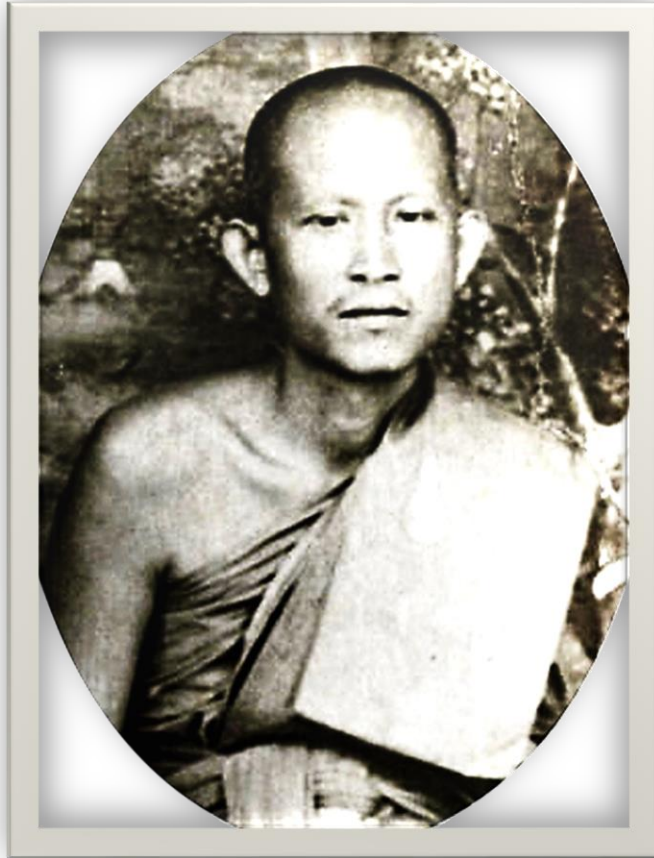
หลวงพ่อศรีพ วัดสมณะ

พระบิดาของหลวงพ่อศรีพเป็นหนึ่งในตำนานพระบิดาห้าเสือ* เนื้อผงคลุกรักของเมืองชลบุรี