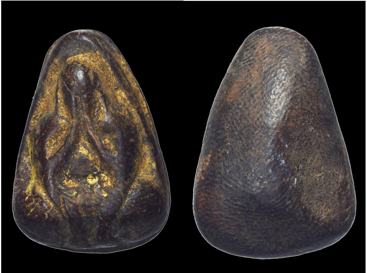
พระปิดตา หลวงปู่ศรีพร