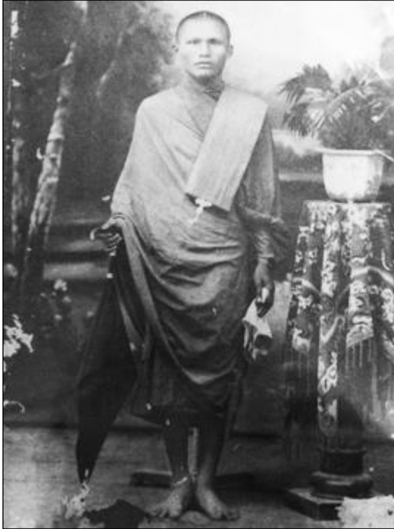
หลวงพ่อศรีพ วัดสมณะ