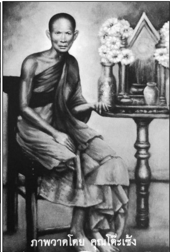
ภาพวาดโดย คุณโต๊ะเซ็ง