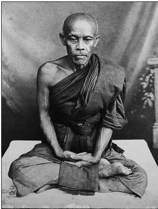
หลวงพ่อก้าว วัดเครือวัลย์