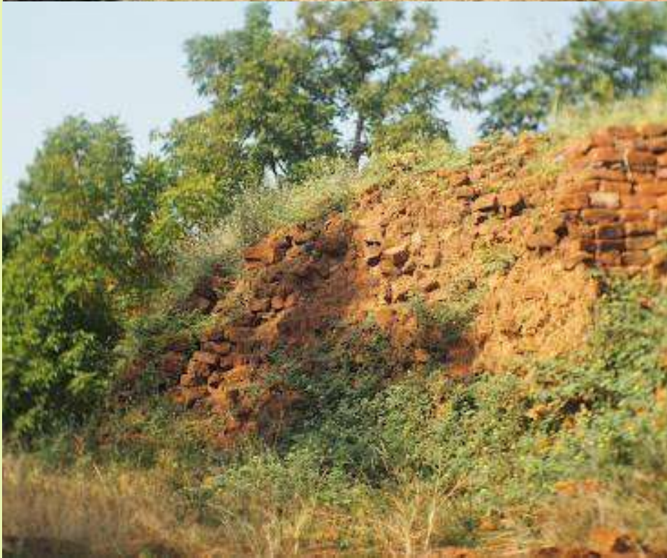
เนินหลังวิหารของวัดธรรมศาลา