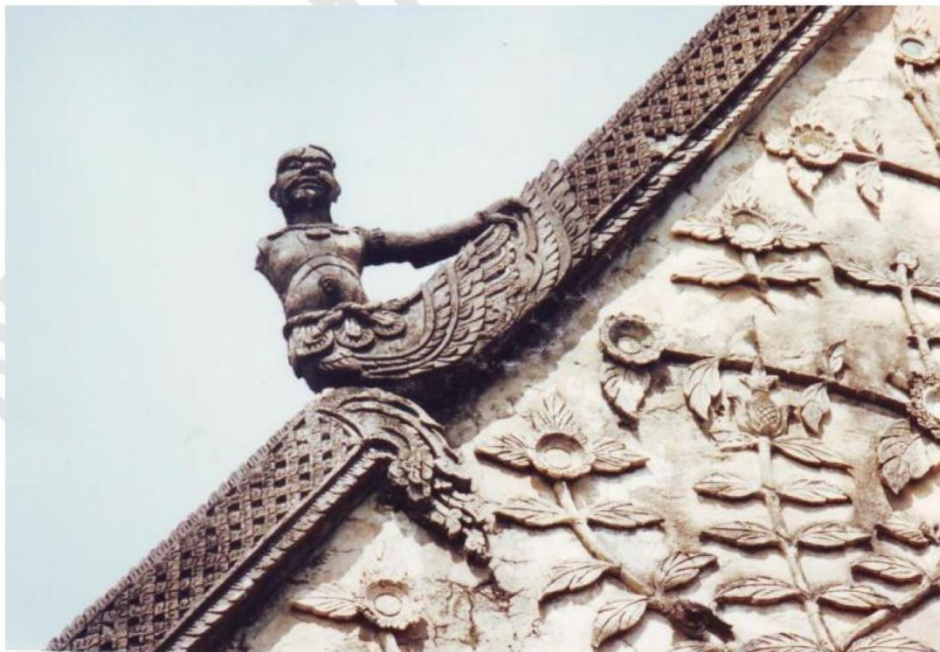
ประติมากรรม ประดับตรงกลางจั่ว (เครื่องลำยอง) ของอุโบสถวัดหนองควง เป็นรูปกนิษฐครีงตัว