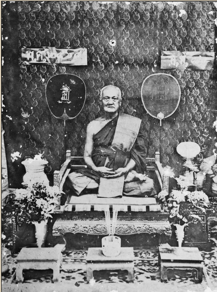
หลวงพ่อเอี่ยม สุทธิ

ในด้านวัดถมมงคล หลวงพ่อเอี่ยมท่านได้สร้างวัดถมมงคลไว้ 2 รุ่น คือเหรียญปั๊มรูปเหมือนท่าน ทรงรูป ไข่ห้วงเชื่อมนั่งเต็มองค์ สร้างเมื่อ พ.ศ. 2465 ส่วนรุ่นสอง สร้างเมื่อ พ.ศ. 2466 ลักษณะคล้ายกันกับ เหรียญรุ่นแรก ต่างกันตรง พ.ศ. ที่สร้าง เป็นเหรียญรูปไข่เนื้อทองแดง เหรียญทั้งสองรุ่นนี้ สร้างขึ้น เพื่อสมนาคุณเป็นที่ระลึกในคราวทำประปาท่อปูนส่งน้ำจากตาน้ำห้วยท่าช้างมายังบ่อเก็บน้ำในวัด หนองควง