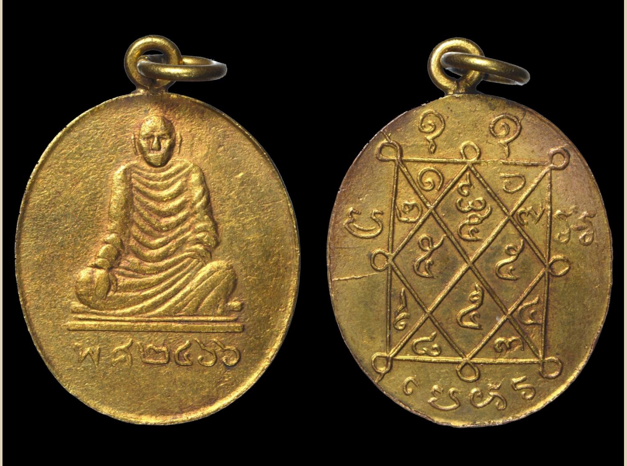
เหรียญหลวงพ่อเอี่ยม รุ่นสอง