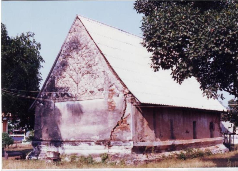
ทางด้านหลังของอุโบสถวัดหนองควง สภาพชำรุดมาก เครื่องลายองไม่เหลือหลักฐานให้เห็น