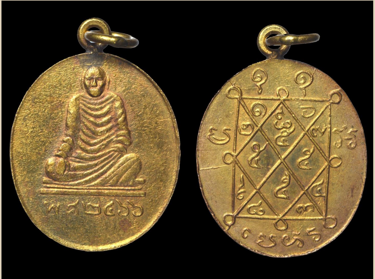
เหรียญหลวงพ่อเอี่ยม รุ่นสอง