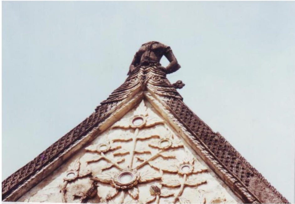
ซ้อฟ้า เหลือเฉพาะด้านทิศตะวันตก เป็นรูปบุคคลหรือเทวดา ส่วนศิระชะชาร์ด เจ้าอาวาสบอกว่าศิระชะของประติมากรรม มีผ้าโพก คล้ายพวกมอญ พม่า