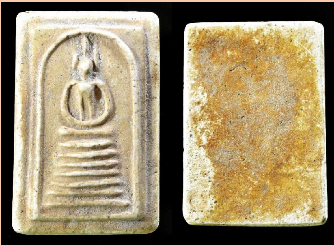
พระสมเด็จเกษไชโย 7 ชั้น พิมพ์นิยม