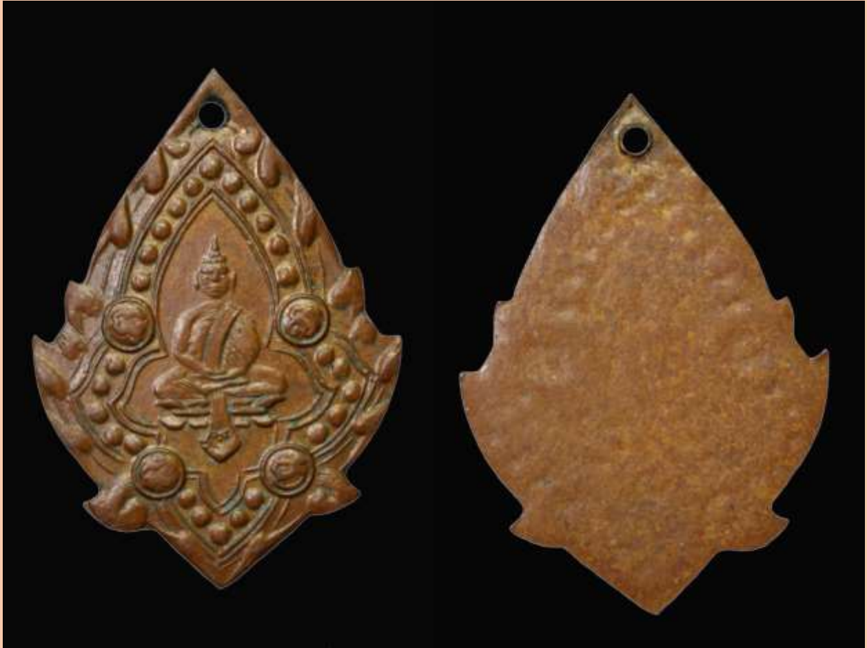
เหรียญพระมหาพุทธพิมพ์ จัดสร้างในปีพ.ศ. 2461