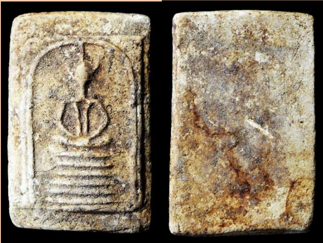
พระสมเด็จเกษไชโย พิมพ์ 6 ชั้น