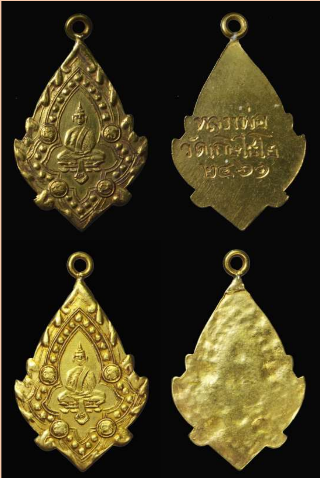
เหรียญพระมหาพุทธพิมพ์ จัดสร้างในปีพ.ศ. 2461