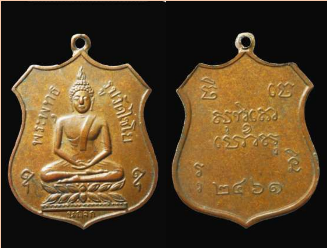
เหรียญพระมหาพุทธพิมพ์ จัดสร้างปีพ.ศ. 2461