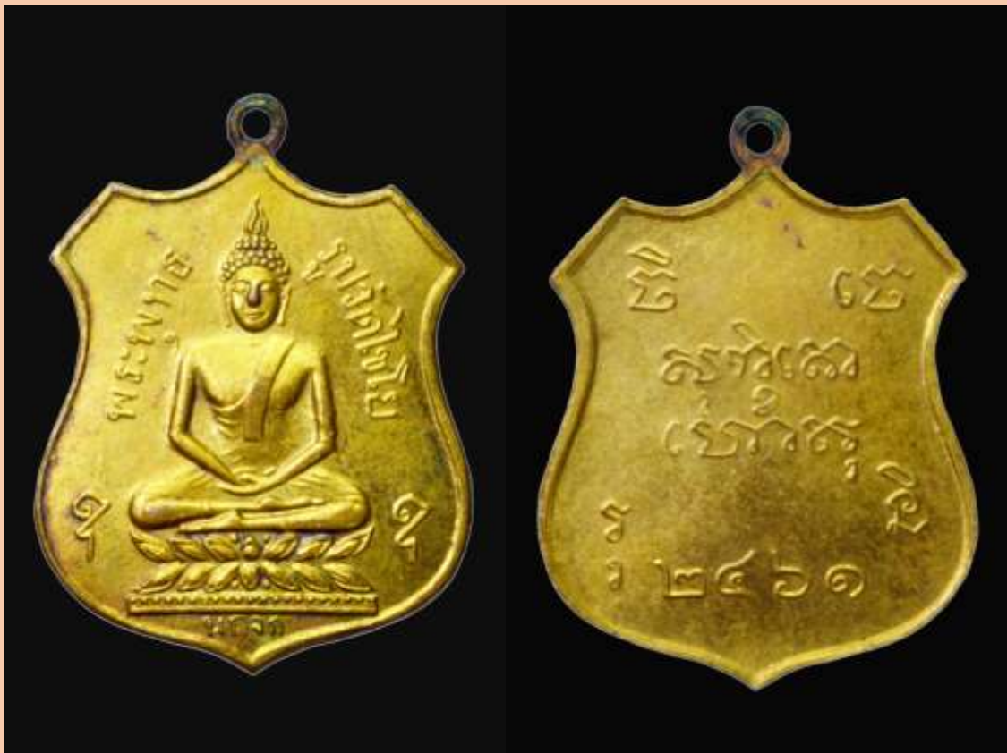
เหรียญพระมหาพุทธพิมพ์ จัดสร้างปีพ.ศ. 2461