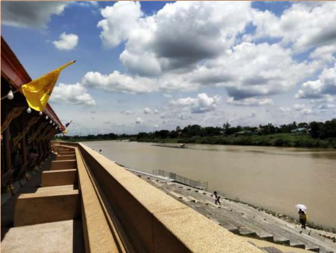
บริเวณทำนน้ำริมฝั่งเจ้าพระยา