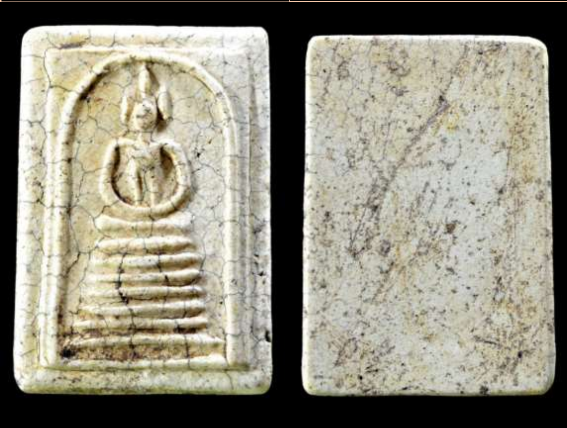
พระสมเด็จเกษไชโย 7 ชั้น พิมพ์นิยม