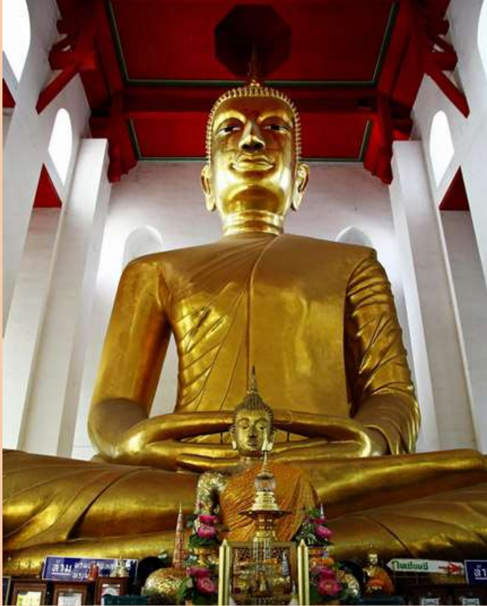
พระมหาพุทธพิมพ์ (หลวงพ่โต)