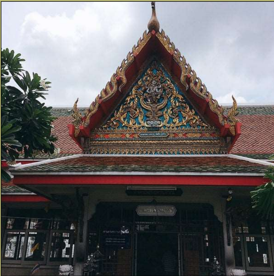
ศาลาหลวงปู่พริ้ง