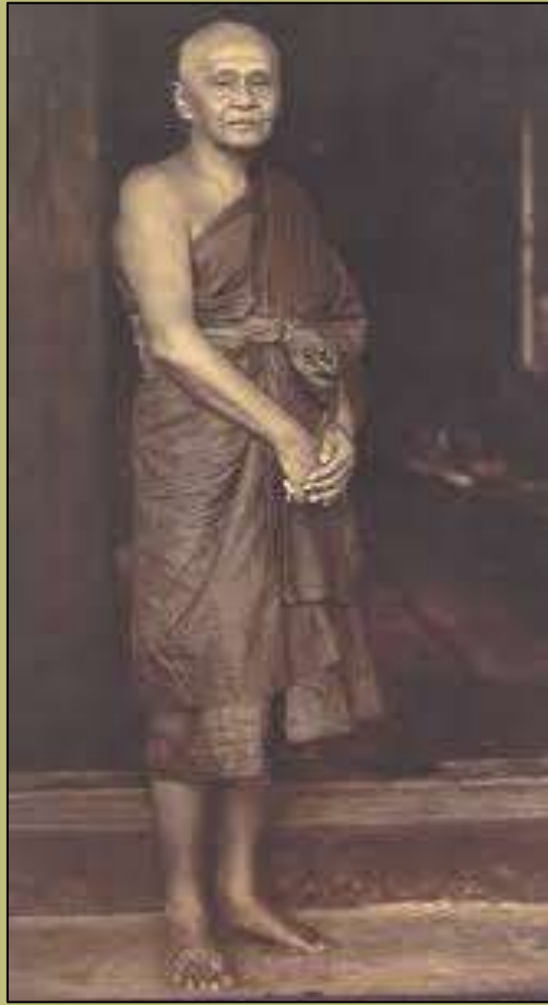
สมเด็จพระสังฆราช (ติสสเทโว แพง)*

http://www.amuletheritage.com/pdf/a23.pdf