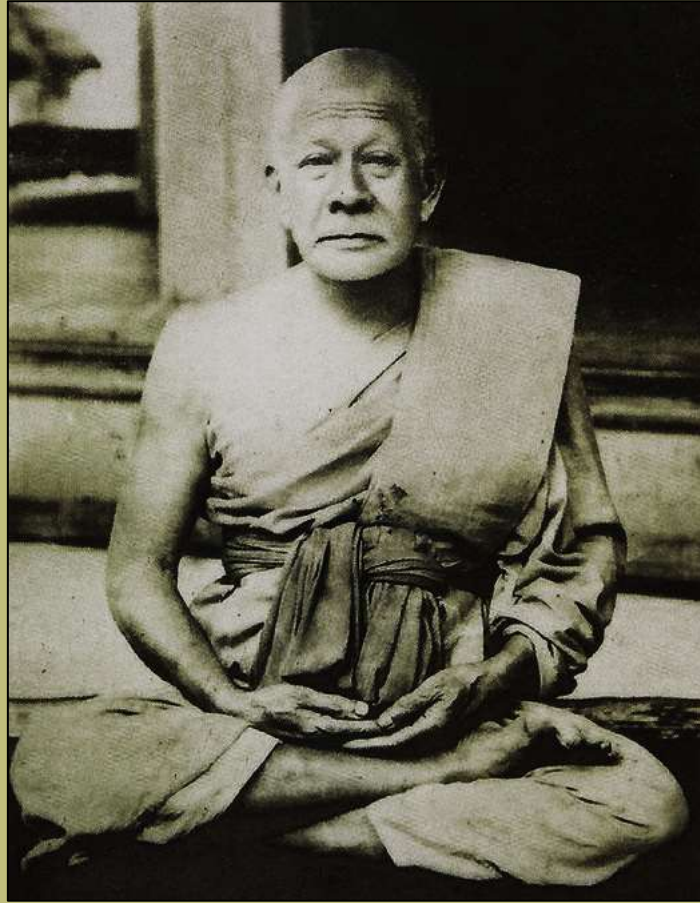
หลวงปู่พริ่ง อินทโชติ

ปัจจุบันนี้ มีข้อความจารึกไว้ว่า วิหารนี้สร้างขึ้นโดยหลวงปู่พริ่ง และบรรดาชาวบ้านมาร่วมบุญ บริจาคทรัพย์สร้างขึ้น และสร้างสำเร็จในพุทธศักราช ๒๔๘๔