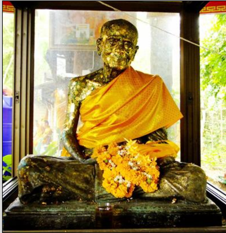
รูปหล่อ หลวงพ่อโต ตีสุโส