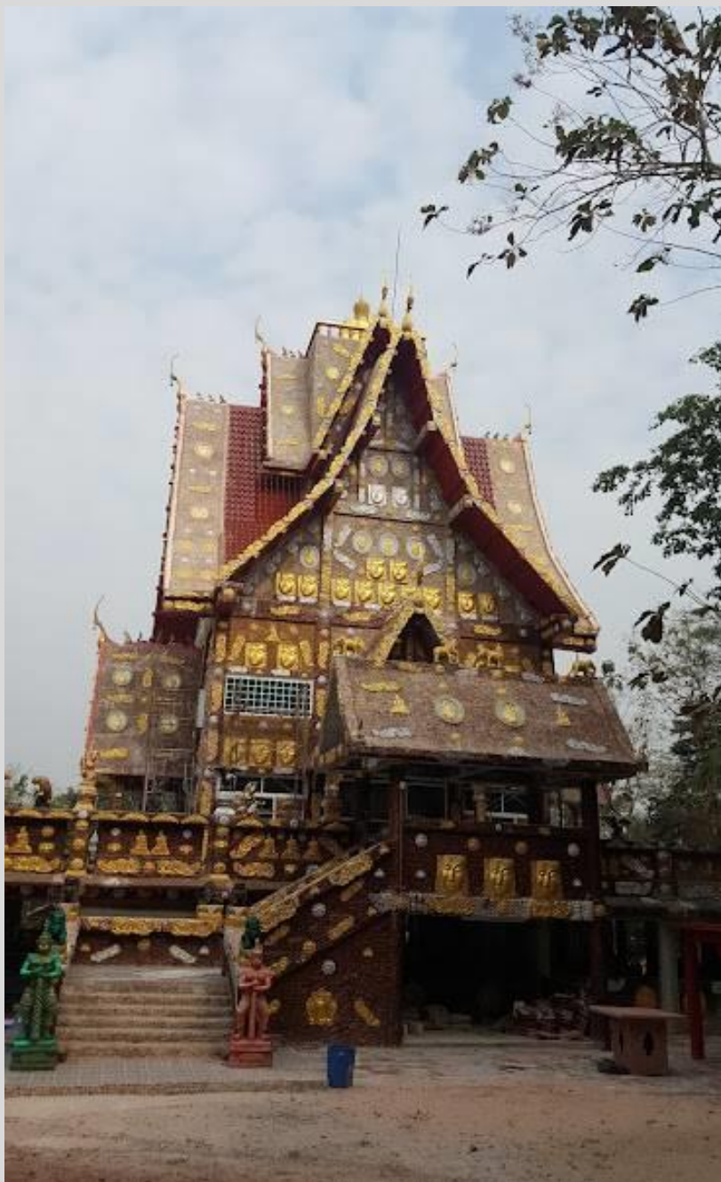
อุโบสถจตุรमुख