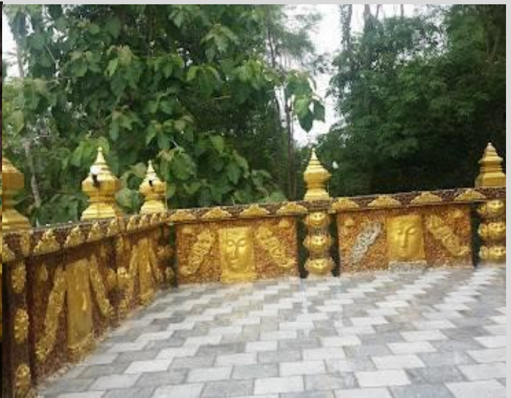
อุโบสถจตุรमुख