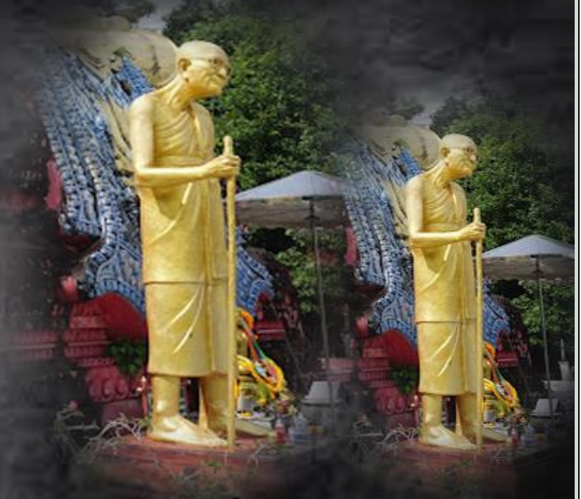
พระครูนิวาสธรรมสาร(โต) วัดบ่อทอง