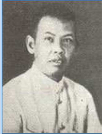
หลวงศรีประกาศ (ฉันท วิชยาภัย) ผู้แทนราษฎรจังหวัดเชียงใหม่

แล้วท่านก็ตกใจตื่น ท่านเชื่อว่านี่คือนิมิตที่เทวดามาบอกกล่าว ให้รู้ว่าจะสามารถสร้างถนน ขึ้นสู่ดอยสุเทพได้อย่างแน่นอน