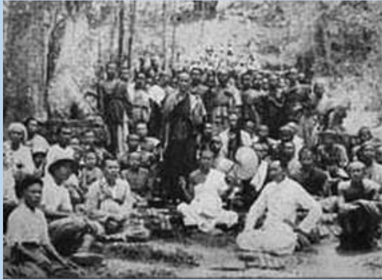
ครูบาศรีวิชัย เจ้าแก้วนวรรฐและพระภิกษุสงฆ์ ประชาชนถ่ายรูปเป็นที่ระลึกที่บันไดนาค เมื่อ ๓๐ เมษายน ๒๔๗๘