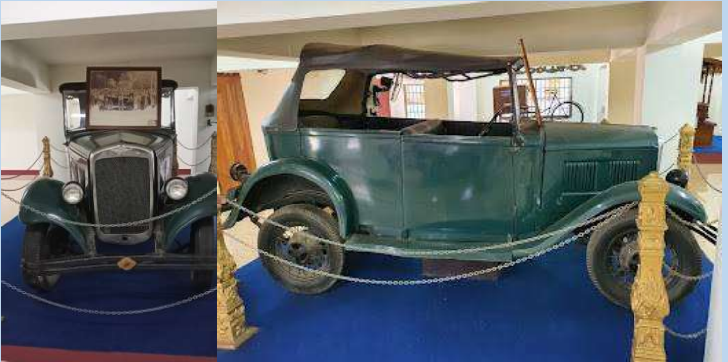
รถยนต์ของเจ้าแก้วนวรรฐ เก็บรักษาไว้ที่ พิพิธภัณฑ์ครูบาศรีวิชัย วัดบ้านปาง