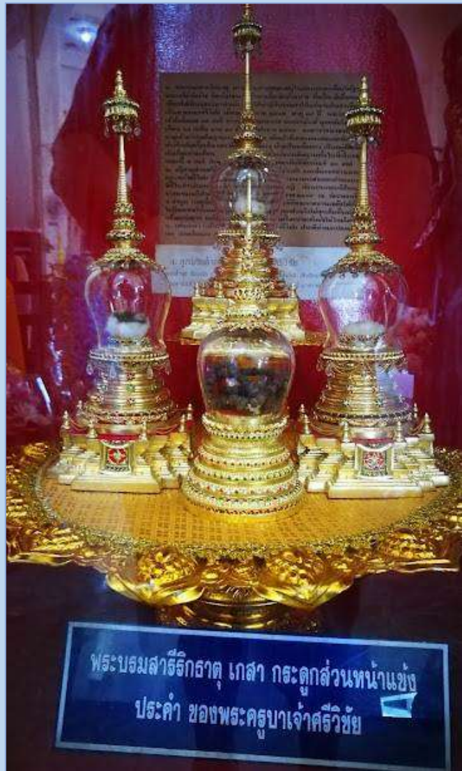
ณ วัดบ้านปาง อำเภอลี้ จ.ลำพูน

อัฐิธาตุของท่านที่เจ้าหน้าที่สามารถรวบรวมได้ได้ถูกแบ่งออกเป็น 7 ส่วน แบ่งไปบรรจุตามสถานที่ต่าง ๆ ทั่วแผ่นดินล้านนา ดังนี้