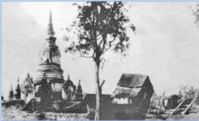
วัดสวนดอก ปี ๒๔๖๙ ก่อนการบูรณะ

ไปบูรณะเจดีย์ดอยเก็ง ในเขตอำเภอฮอด เชียงใหม่ จากนั้นไปบูรณะวัดศรีโคมคำ จังหวัดพะเยา กล่าวกันมาว่าในวันที่ท่านถึงพะเยานั้น มีประชาชนนำเงินมาบริจาคร่วมทำบุญใส่ปีบได้ถึง ๒ ปีบ หลังจากนั้นมาบูรณะวัดพระสิงห์ เชียงใหม่ เป็นอาทิ รวมแล้วพบว่างานบูรณปฏิสังขรณ์วัดวาอารามของครูบาศรีวิชัยมีประมาณ ๒๐๐ แห่ง