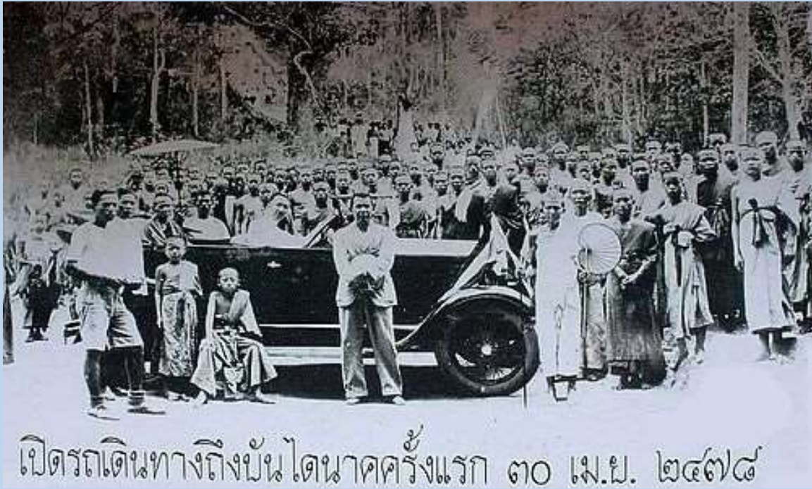
เปิดรถเดินทางถึงบ้านไผ่ครั้งแรก ๓๐ เม.ย. ๒๔๗๘

เจ้าแก้วโหวงและบุคคลอื่นๆ ซึ่งมีส่วนร่วมในการสร้างถนนขึ้นดอยสุเทพ มาชุมนุมอยู่กันอย่างพร้อมพรั่งเพื่อรอเวลาที่เจ้าแก้วนวรรฐ เจ้าผู้ครองนครเชียงใหม่จะมาทำพิธีเปิดถนนขึ้นดอยสุเทพ และประทับรถยนต์ขึ้นดอยสุเทพเป็นคันแรก