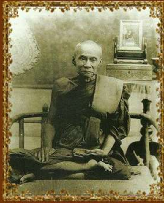
สมเด็จพระวันรัต (แดง) วัดสุทัศนเทพวราราม