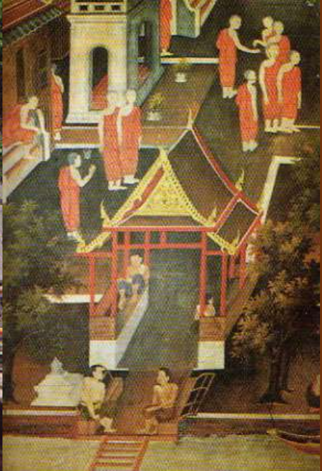
ภาพศาลาทำน้ำในปัจจุบันเปรียบเทียบกับภาพวาดจิตรกรรมฝาผนังพระอุโบสถ