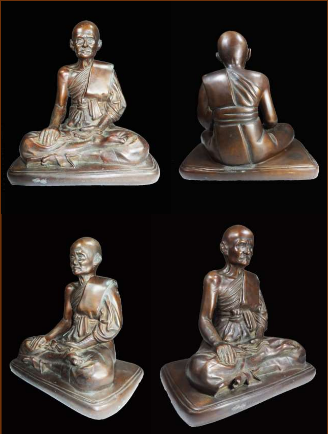
รูปหล่อ สมเด็จพระวันรัต (แดง)