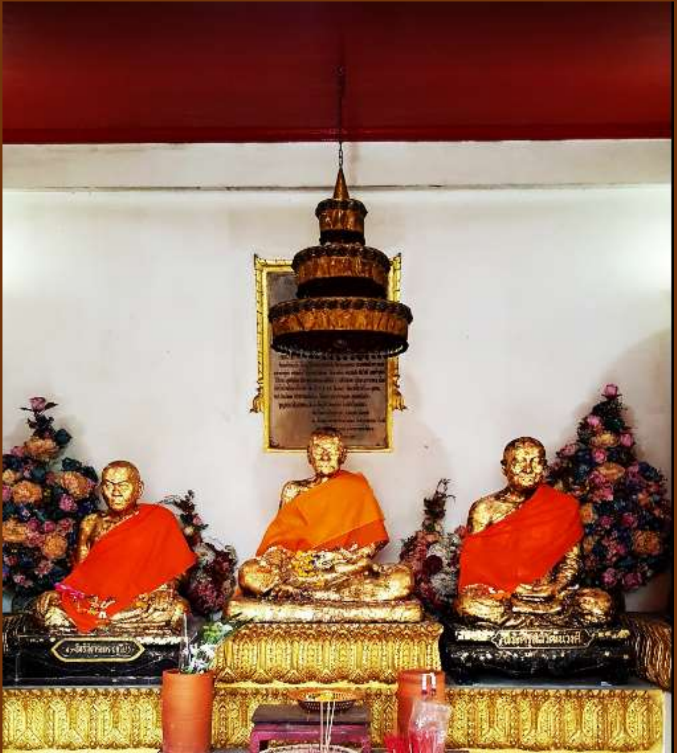
รูปหล่อสมเด็จพระวันรัต (แดง สีลวฑฺฒโน) ภายในศาลาอเนกนิช