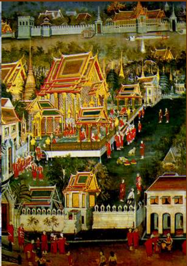
ภาพวาดจิตรกรรมฝาผนัง