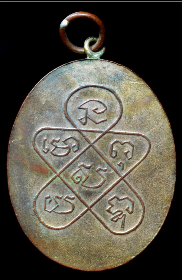
เหรียญหลวงพ่อดูย ปี 2465 บล็อกโมมิไล่