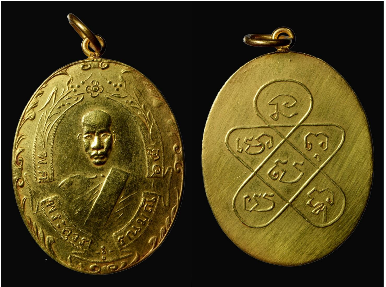
เหรียญหลวงพ่อดูย ปี 2465 บล็อกโมไม่มีไส้