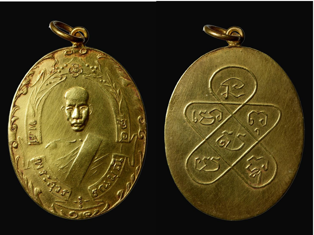
เหรียญหลวงพ่อดู ปี 2465 บล็อกโมไม่มีไส้