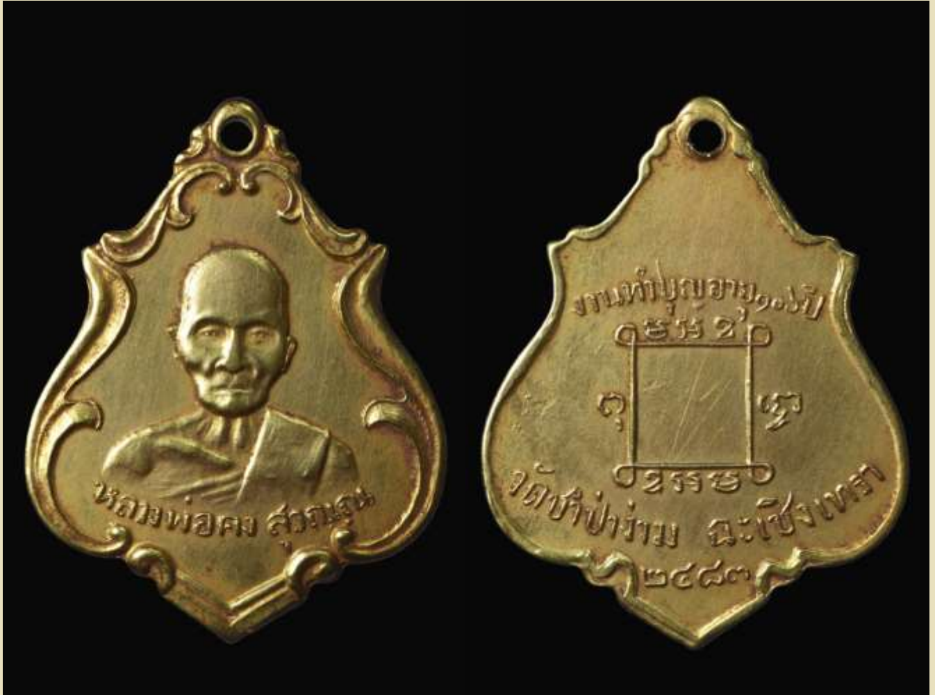
เหรียญรูปอาร์ม หลวงพ่อกอง สุวณฺณ ปี พ.ศ. ๒๔๘๓