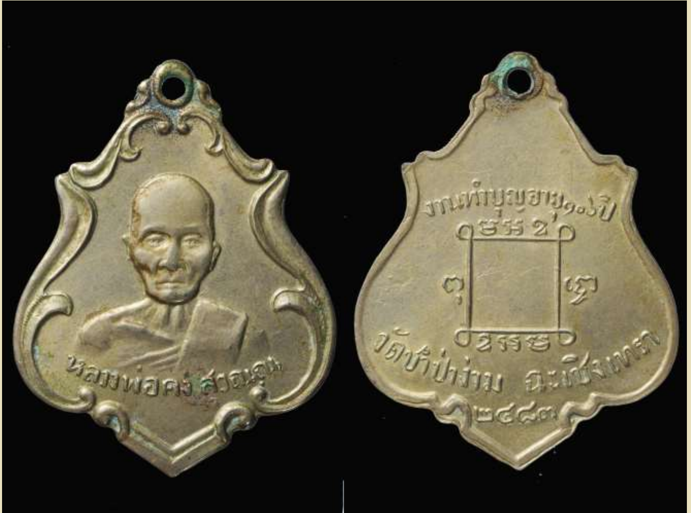
เหรียญรูปอาร์ม หลวงพ่อกิ่ง สุวรรณ ปี พ.ศ. 2483