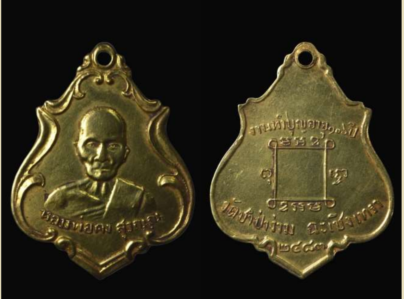
เหรียญรูปอาร์ม หลวงพ่อกง สุวณฺณ ปี พ.ศ. 2483