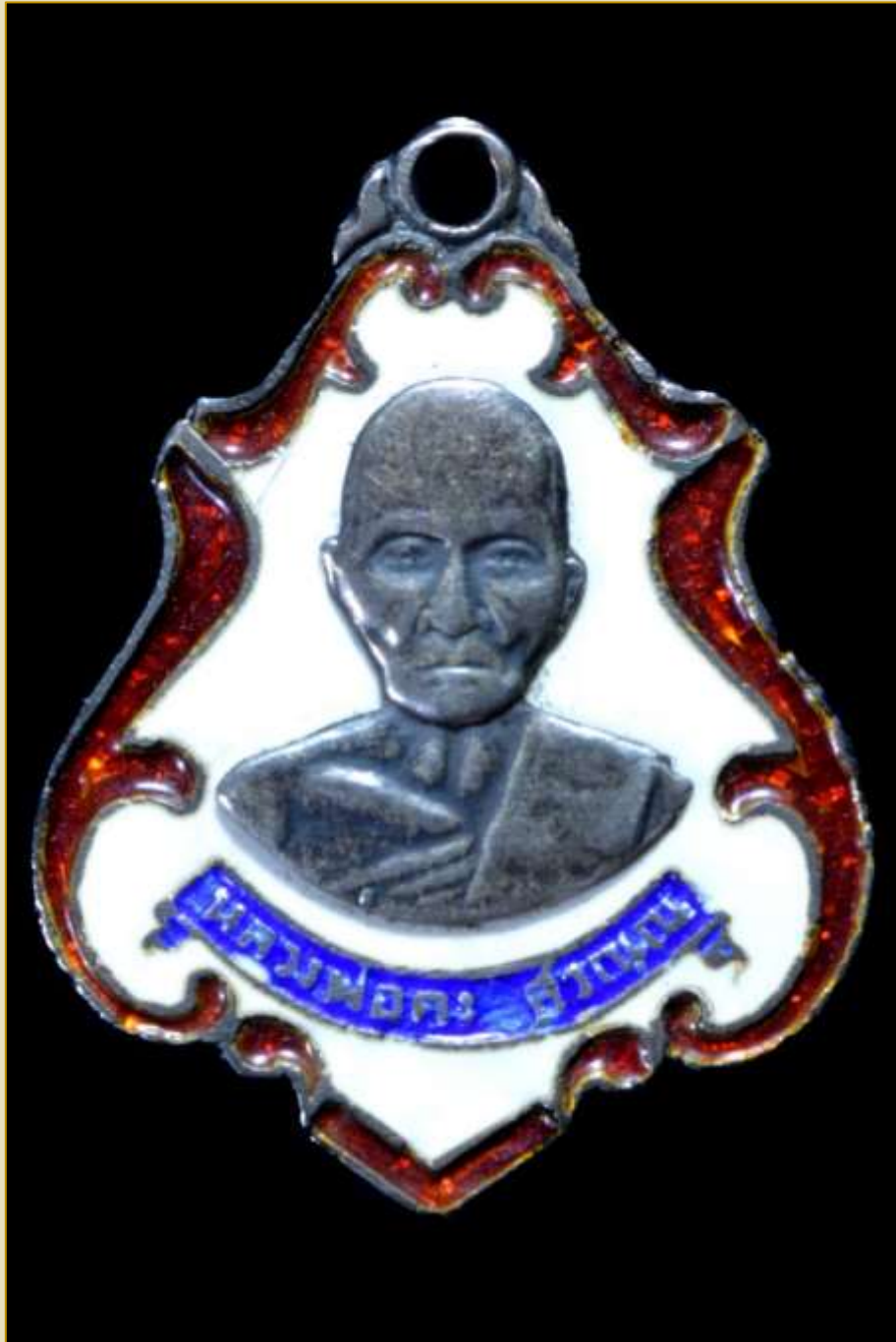
เหรียญรูปอาร์ม หลวงพ่อคง สุวณฺณ เนื้อเงินลงยา ปี พ.ศ. 2483