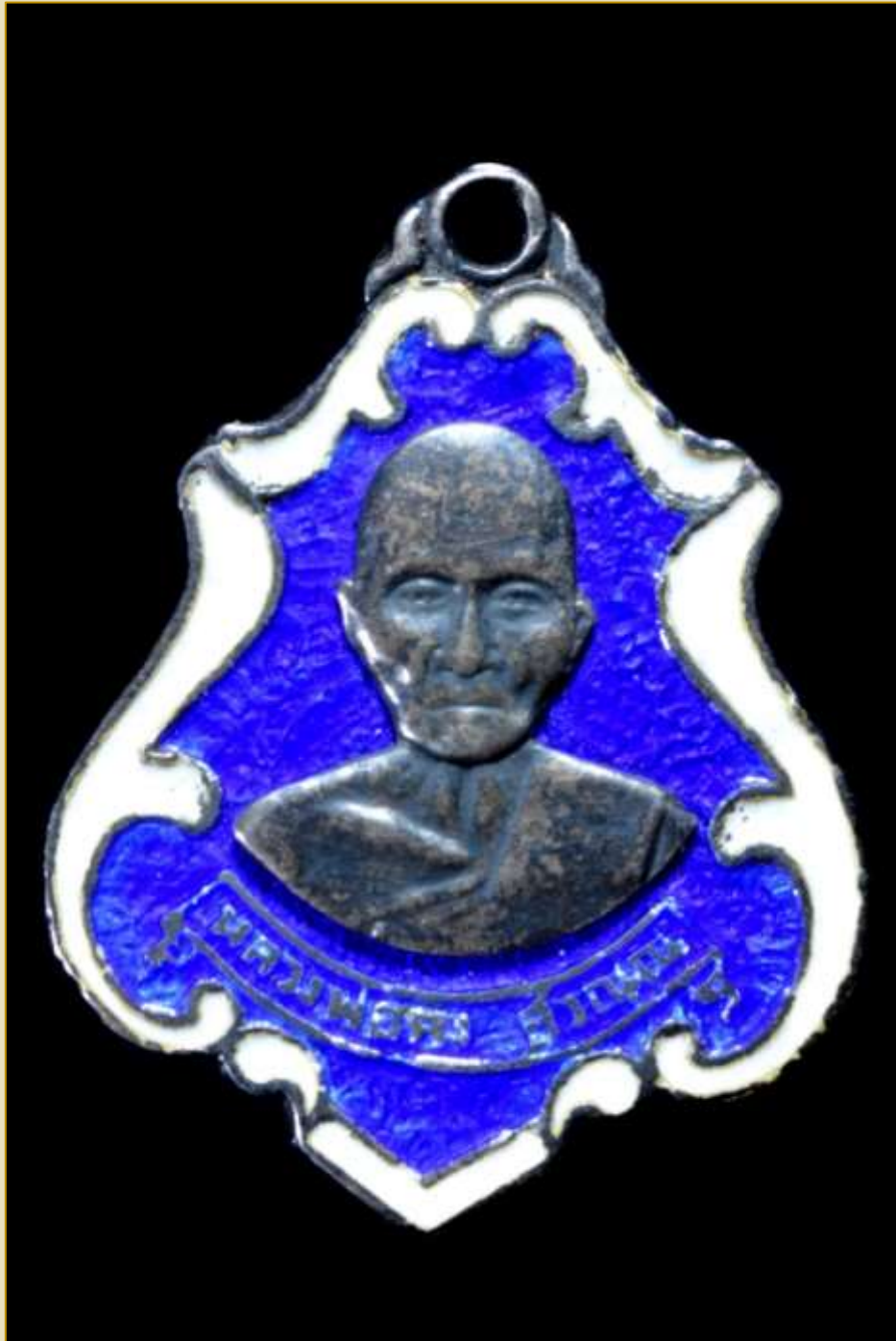
เหรียญรูปอาร์ม หลวงพ่อคง สุวณฺณ เนื้อเงินลงยา ปี พ.ศ. 2483