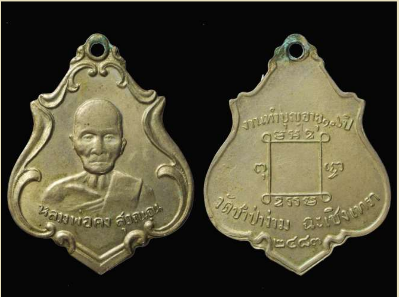
เหรียญรูปอาร์ม หลวงพ่อกอง สุวณฺณ ปี พ.ศ. ๒๔๘๓