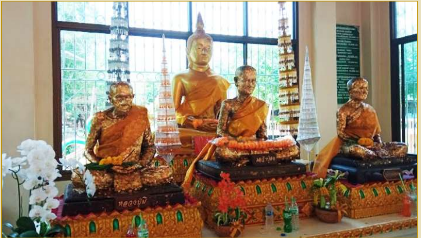
รูปหล่อ หลวงปู่มี หลวงปู่คง หลวงปู่สาย