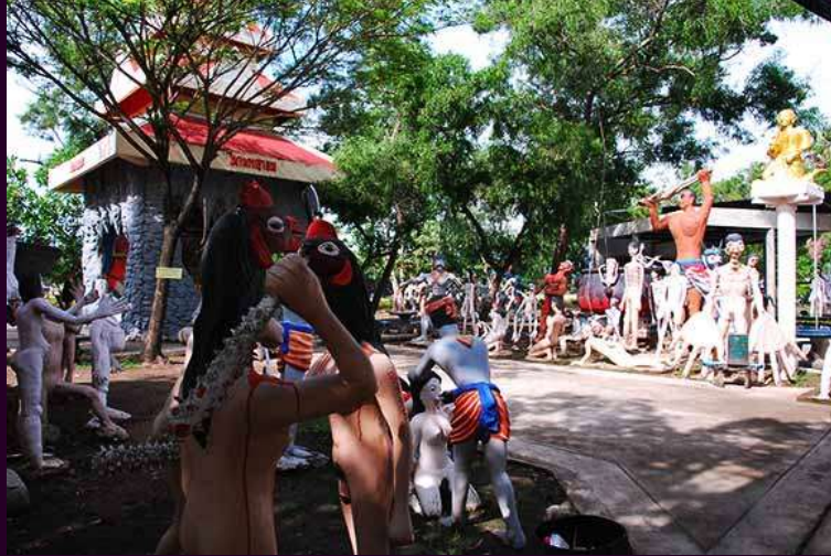
เปรตวัดไฟโรงวัว