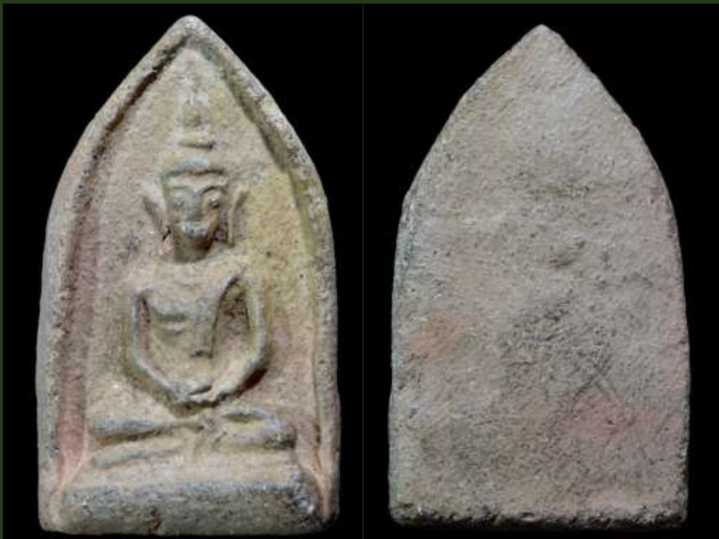
พระขุนแผนหน้าอิฐ กรุวัดใหญ่ชัยมงคล