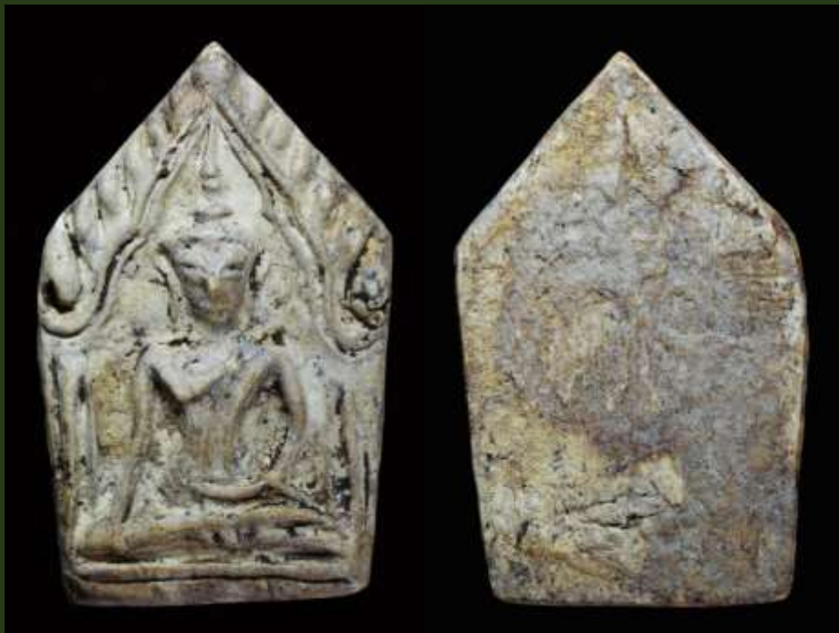
พระขุนแผน กรุโรงเหล้า จ.อยุธยา พระขุนแผนกรุ่นี้ มีเนื้อหามวลสารและพิมพ์ทรงเดียวกันกับ “พระขุนแผนเคลือบ กรุวัดใหญ่ชัยมงคล”