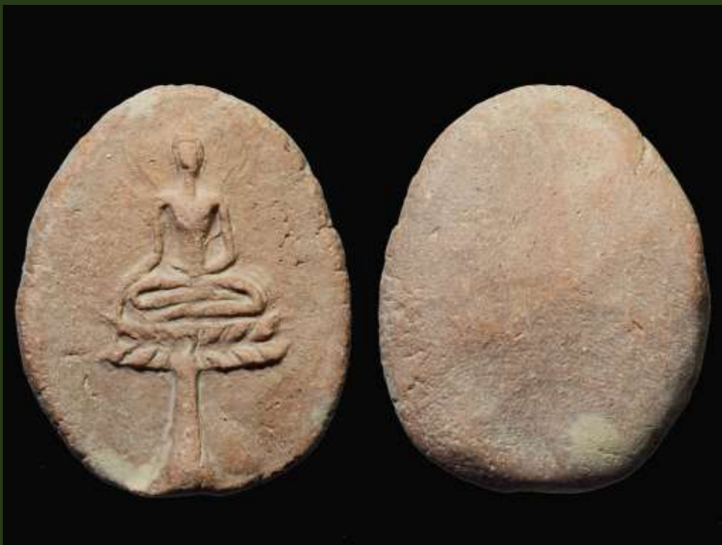
พระขุนแผนใบพุทรา กรุวัดใหญ่ชัยมงคล