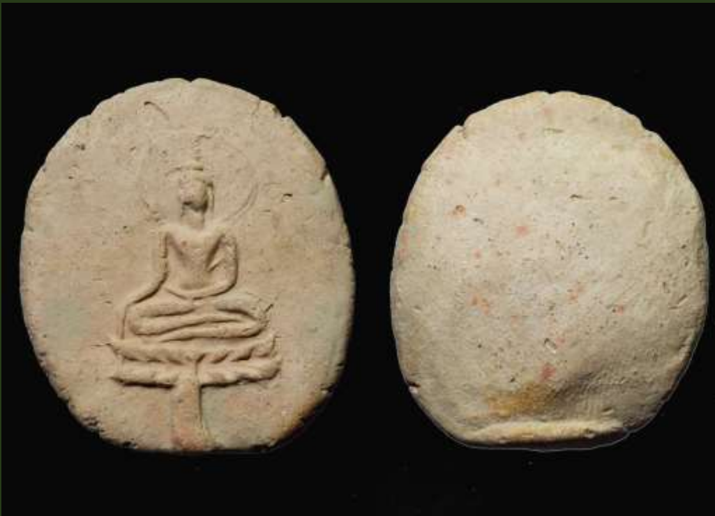
พระขุนแผนใบพุทรา กรุวัดใหญ่ชัยมงคล