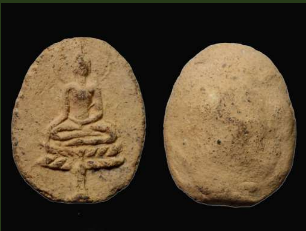
พระขุนแผนใบพุทรา กรุวัดใหญ่ชัยมงคล