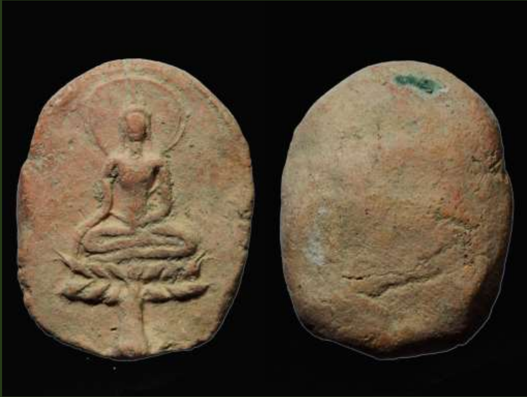
พระขุนแผนใบพุทรา กรุวัดใหญ่ชัยมงคล