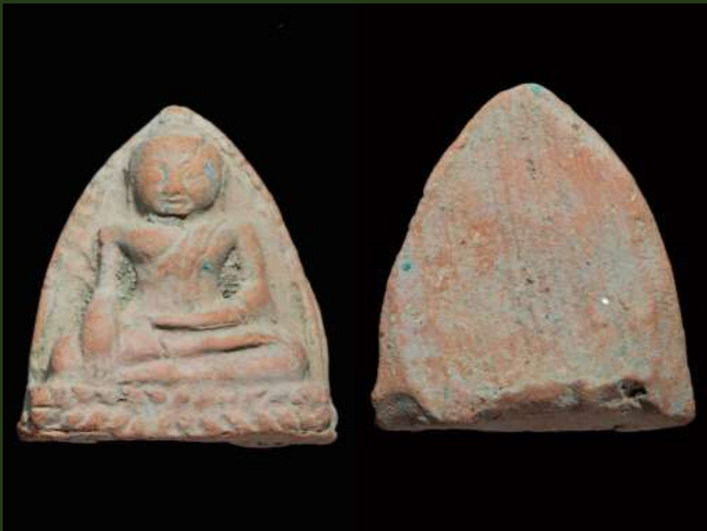
พระหลวงพ่อโต กรุวัดใหญ่ชัยมงคล