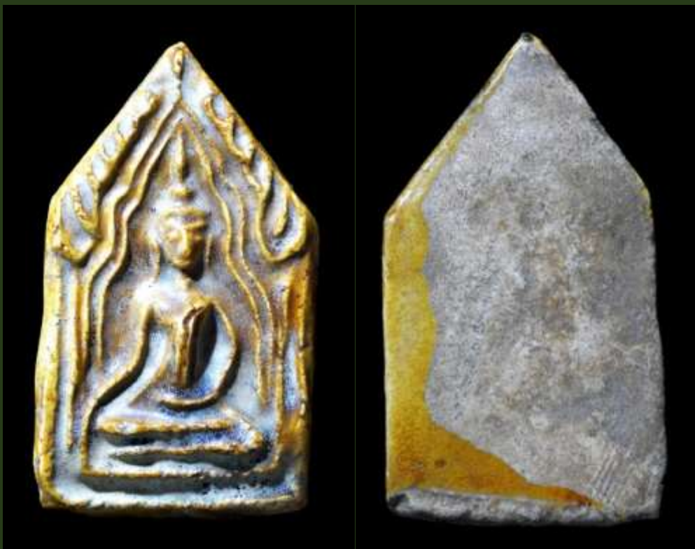
พระขุนแผนเคลือบ พิมพ์แขนอ่อน กรุวัดใหญ่ชัยมงคล