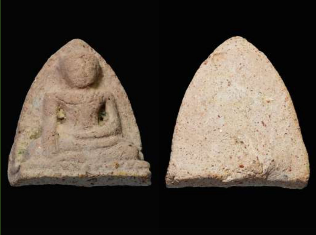
พระหลวงพ่โต กรุวัดใหญ่ชัยมงคล