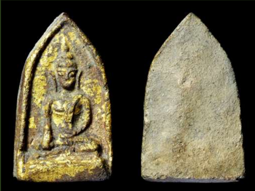
พระขุนแผนหน้าอิฐ กรุวัดใหญ่ชัยมงคล