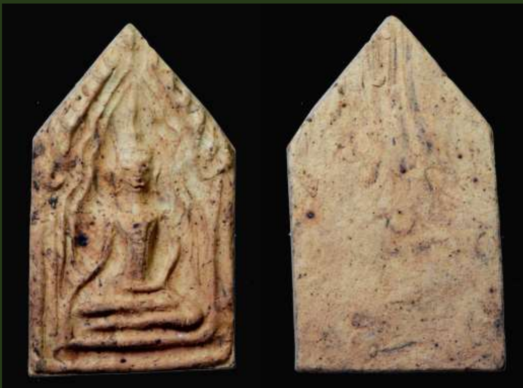
พระขุนแผน พิมพ์แขนอ่อน กรุวัดใหญ่ชัยมงคล