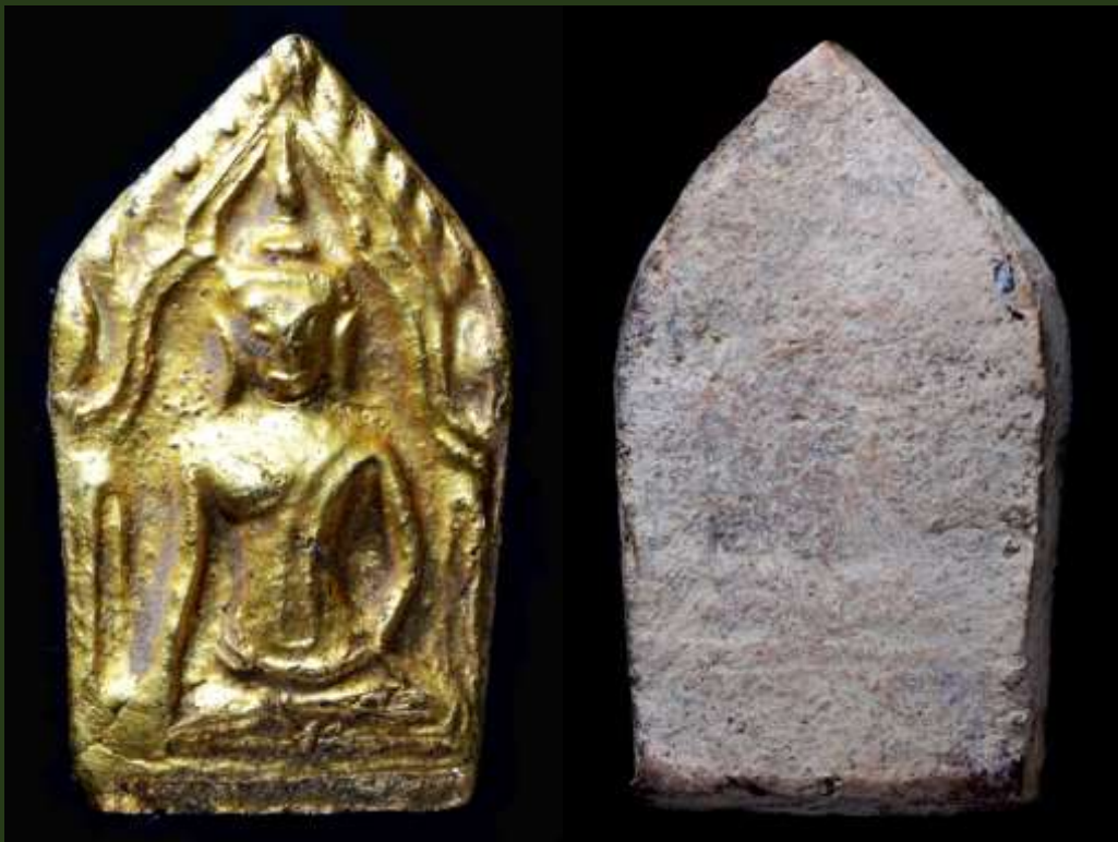
พระขุนแผน ปิดทองในกรุ