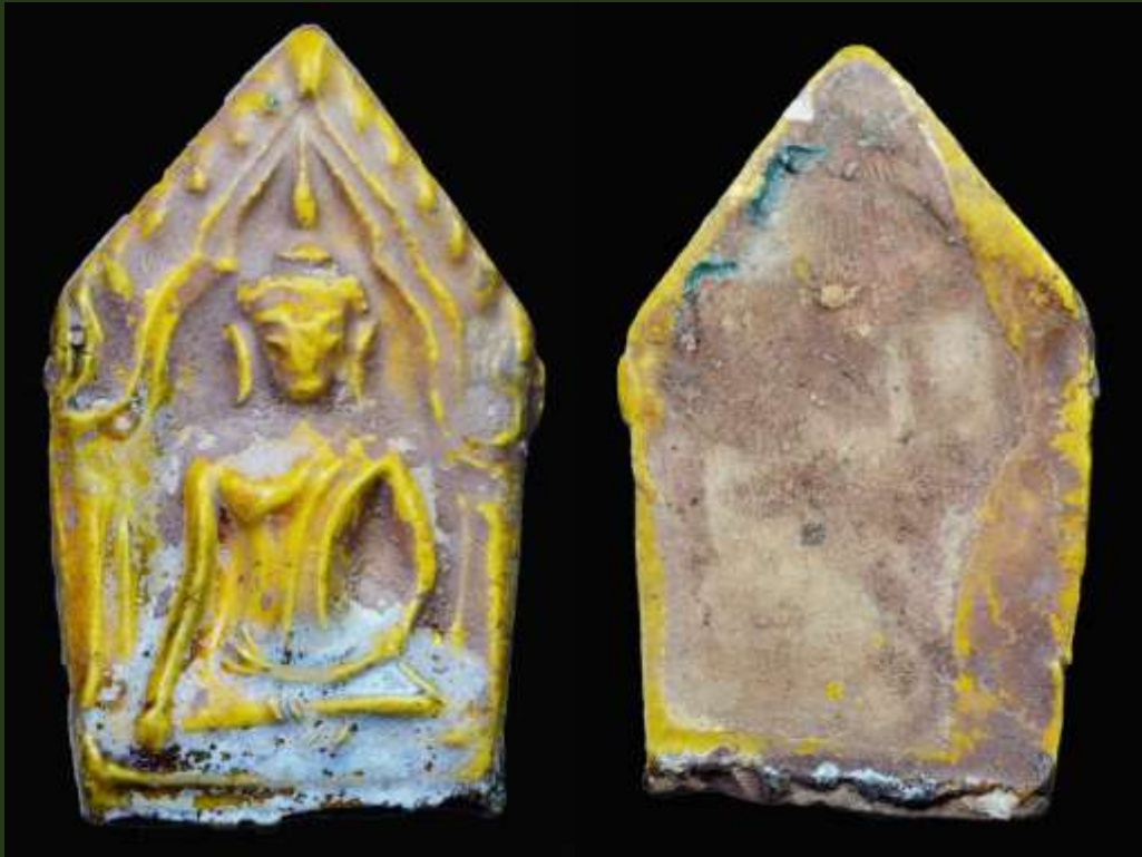
พระขุนแผนเคลือบ กรุวัดใหญ่ชัยมงคล