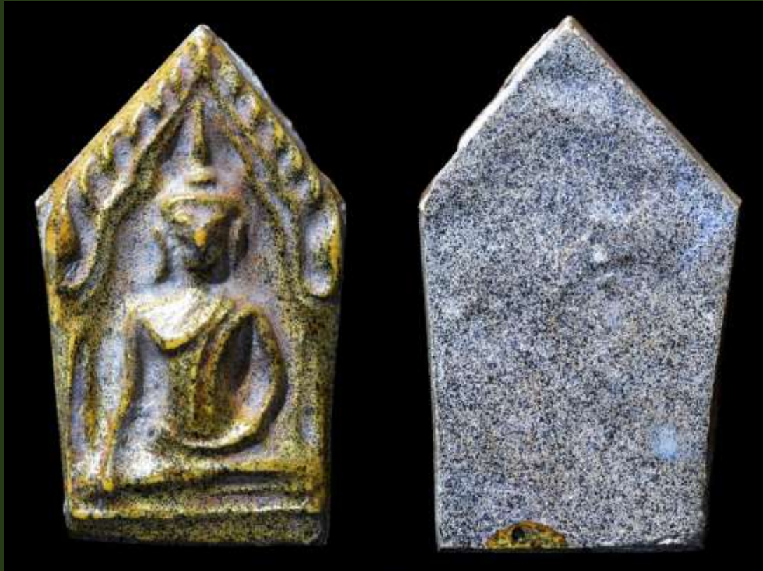
พระขุนแผนเคลือบ กรุวัดใหญ่ชัยมงคล