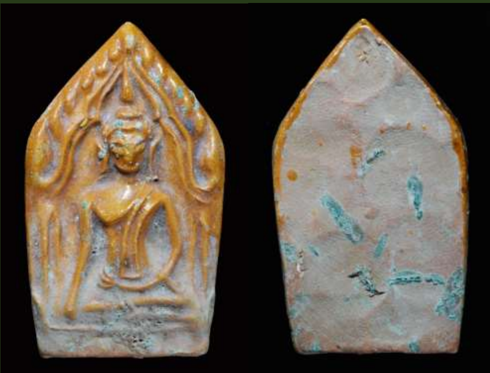
พระขุนแผนเคลือบ กรุวัดใหญ่ชัยมงคล