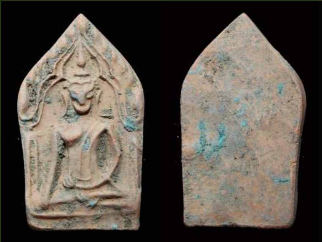
พระขุนแผน พิมพ์อกใหญ่ฐานสูง กรุวัดใหญ่ชัยมงคล มีพุทธลักษณะพิมพ์เช่นเดียวกับพระขุนแผนเคลือบ กรุวัดใหญ่