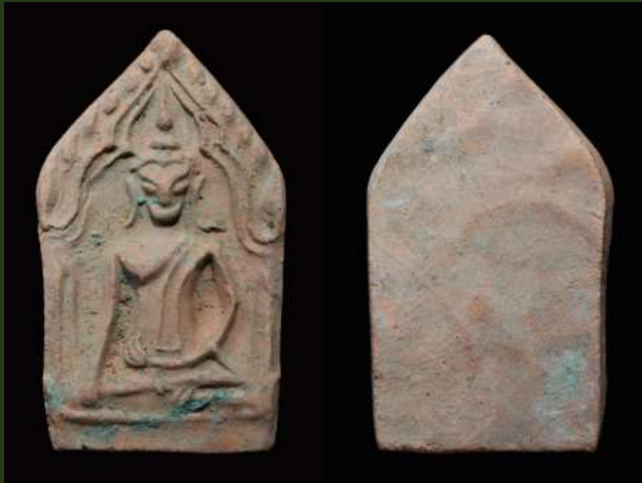
พระขุนแผน พิมพ์อกใหญ่ฐานสูง กรุวัดใหญ่ชัยมงคล มีพุทธลักษณะพิมพ์เช่นเดียวกับพระขุนแผนเคลือบ กรุวัดใหญ่