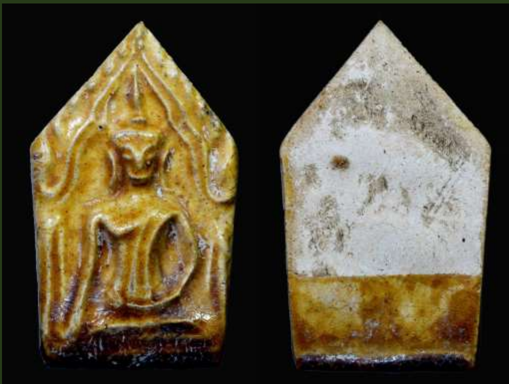
พระขุนแผนเคลือบ กรุวัดใหญ่ชัยมงคล