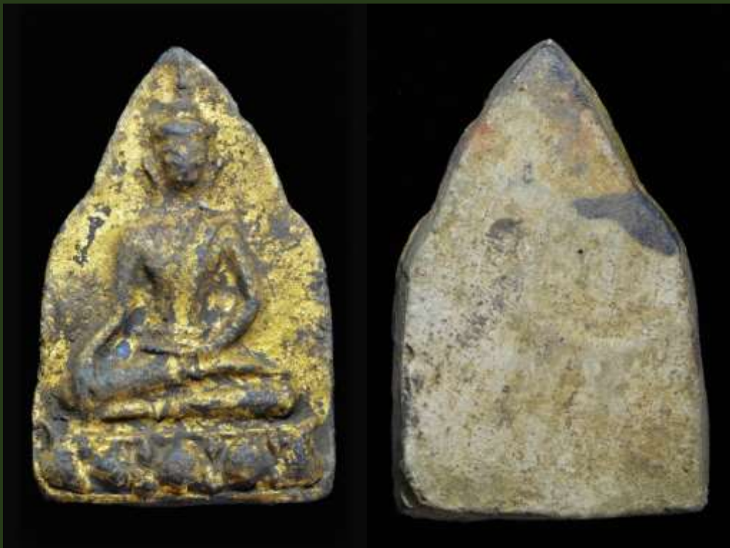
พระขุนแผน ฐานบัว กรุวัดใหญ่ชัยมงคล