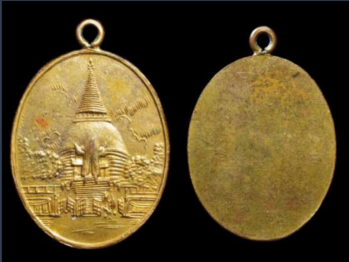
เหรียญวิว องค์พระปฐมเจดีย์ ปี 2485