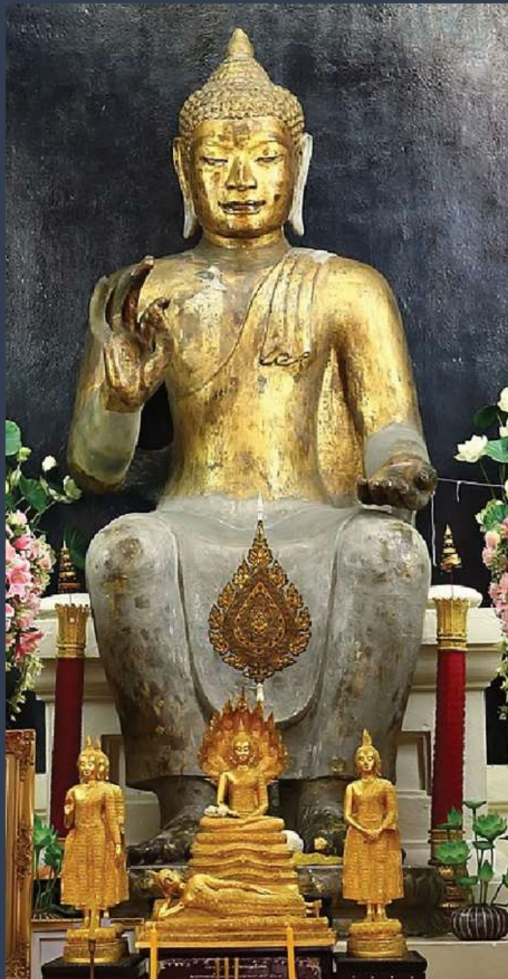
พระพุทธรูปศิลาขาว (หลวงพ่อประทานพร)