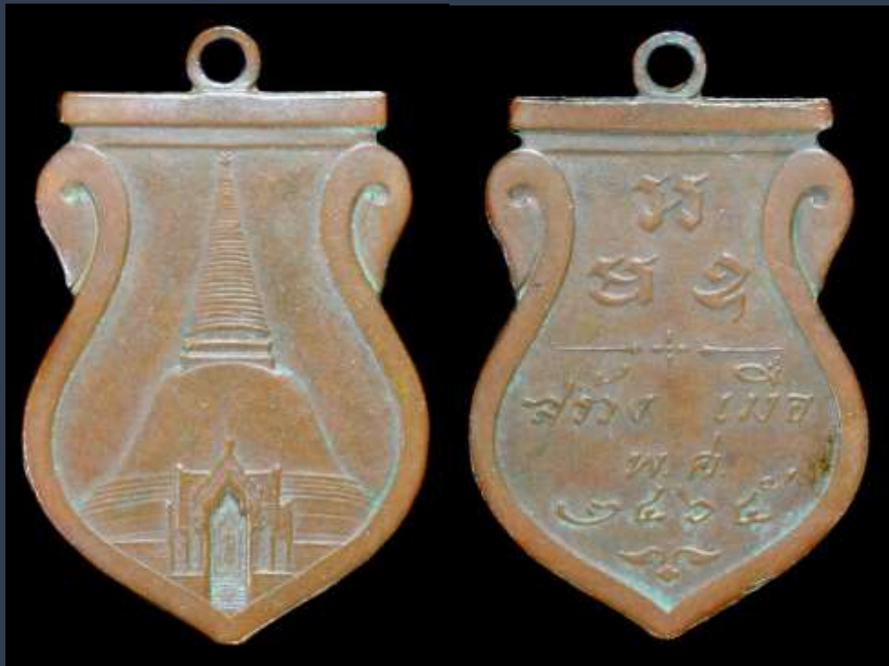
เหรียญปี่มพระปฐมเจดีย์ ปี 2465