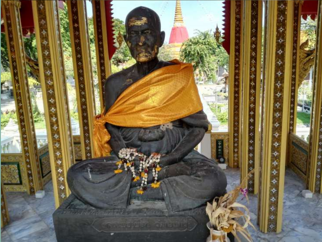
ศาลาจตุรมุขกลางสระน้ำประดิษฐานรูปปั้นหลวงปู่เผือก