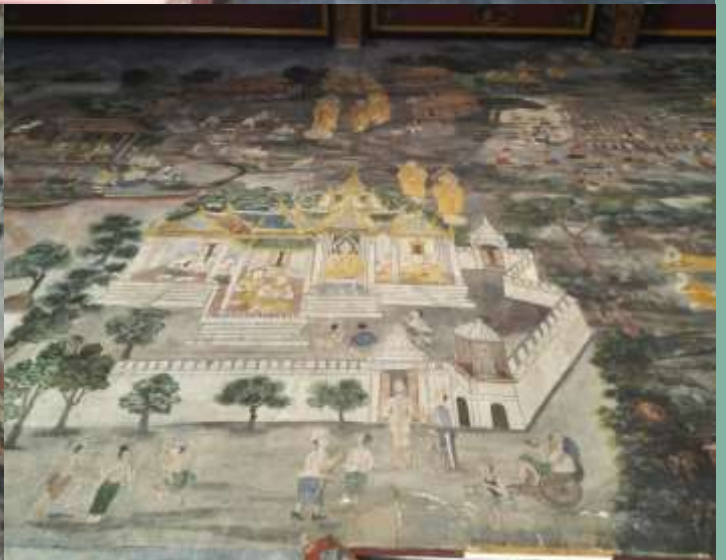
จิตรกรรมฝาผนังภายในโบสถ์