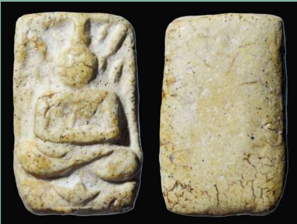
พระหลวงปู่เฟือก พิมพ์ชุดสระเล็ก