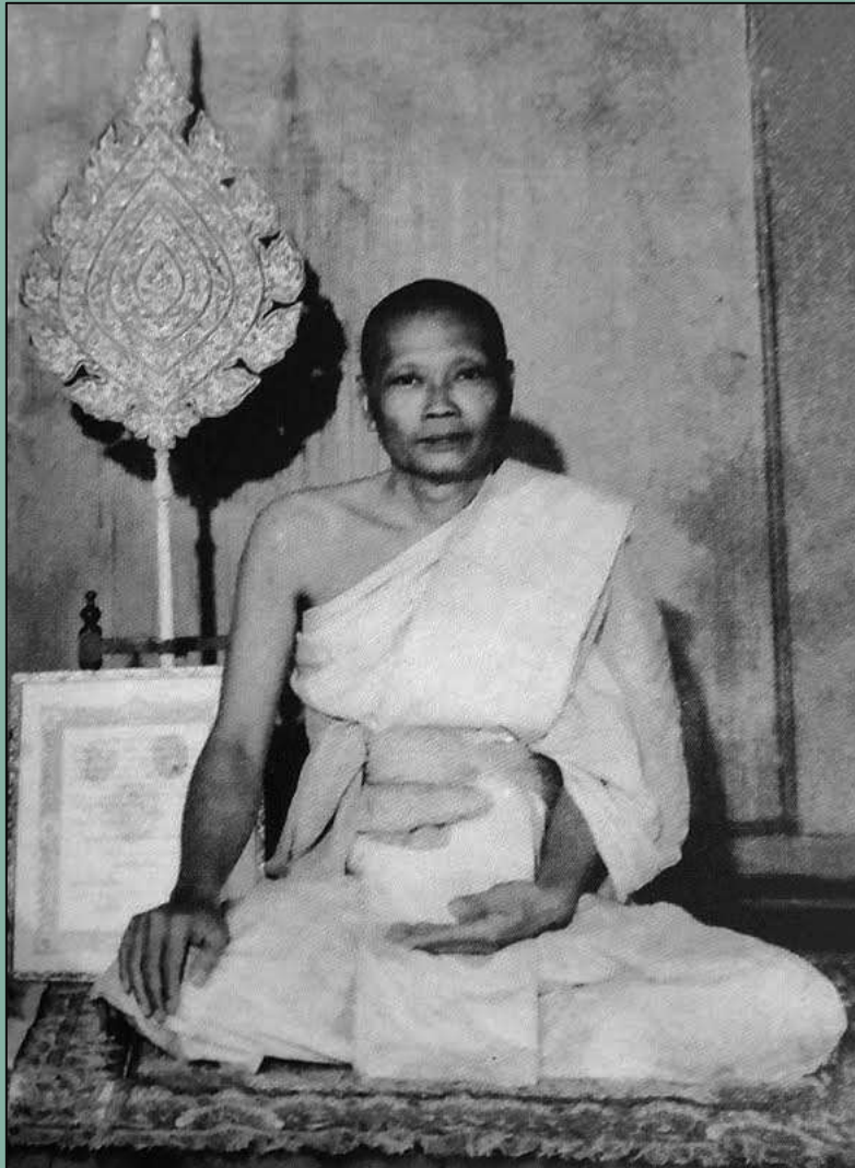
พระมงคลราชมุนี (สนธิ์ ยติธโร) วัดสุทัศนเทพวราราม

http://www.amuletheritage.com/pdf/a122.pdf