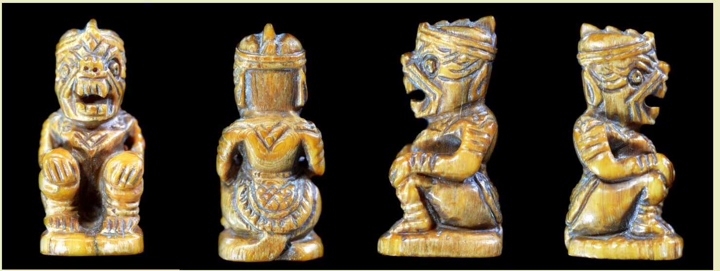
หนุมาน หลวงพ่อส่น วัดศาลากุน นนทบุรี พิมพ์โชน แกะจากงาช้างอย่างวิจิตรอลังการ