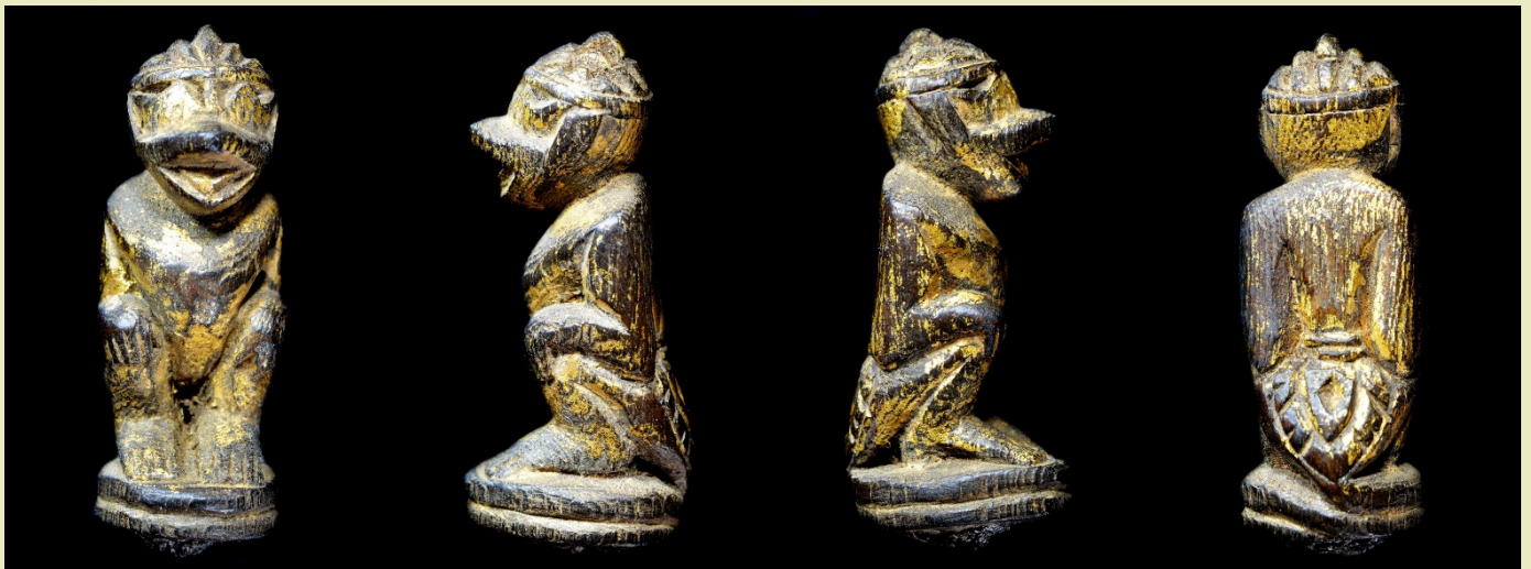
หนุมานแกะหลวงพ่อกลีน พิมพ์หน้ากระบี่ แกะจากไม้อย่างพิถีพิถัน

ท่านเป็นหนึ่งในพระคณาจารย์ผู้ลงอักขระบนแผ่นทองแดงใช้เป็นมวลสารในการจัดสร้างเหรียญที่ระลึกวัดราชบพิธฯ ครั้งที่ 4 (พ.ศ.2481) อีกทั้งยังเป็นสหธรรมิกหลวงพ่อกลีน วัดสะพานสูง โดยมีอายุมากกว่าหลวงพ่อกลีนประมาณ 5 ปี