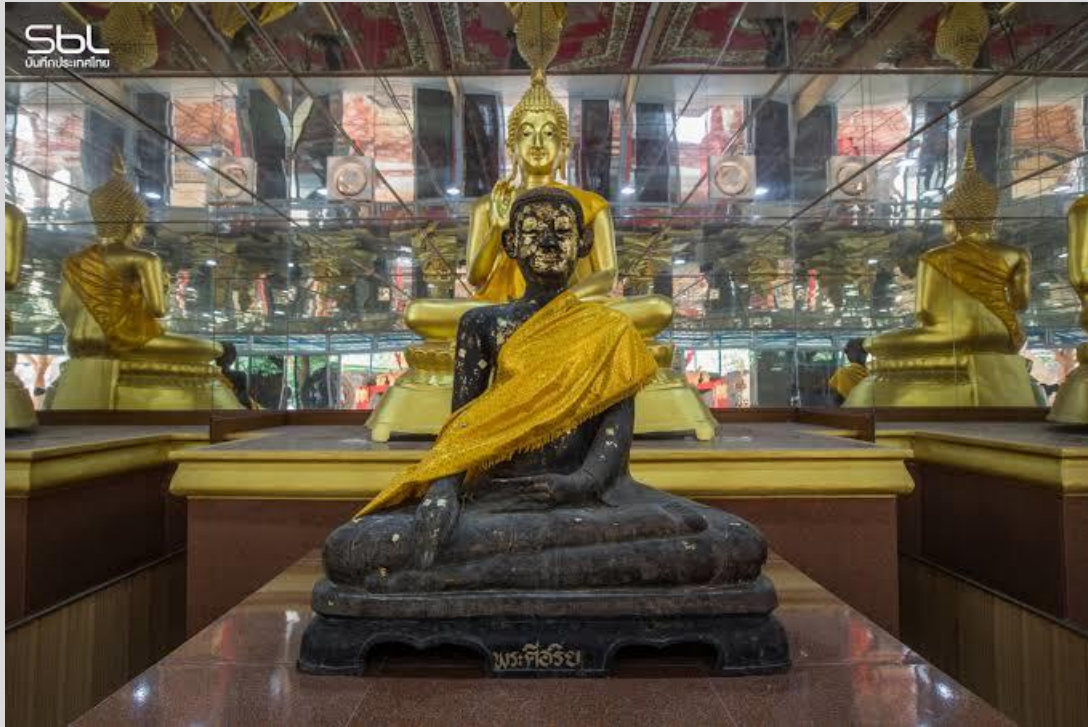
วัดวังตะกู ต.วังตะกู อ.บางมูลนาก จ.พิจิตร