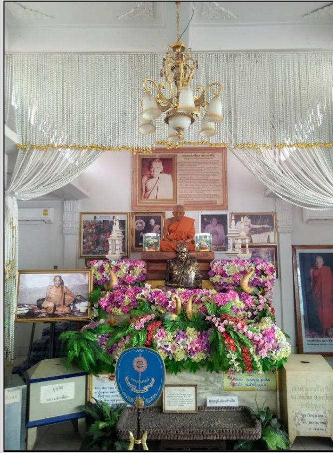
รูปปั้นและภาพหลวงพ่อเขียน ณ วัดสำนักขุนเณร

หลวงพ่อเขียน มาอยู่วัดวังตะกั่วได้ไม่กี่ปี ผู้ใหญ่หลาย บ้านห้วยเวียงใต้ ได้นำม้าตัวเมียมาถวายหลวง พ่อตัวหนึ่ง และต่อมานายทอง บ้านเขาอีแร้ง ก็ได้นำม้าตัวผู้สีเขียว ค่อนข้างดุ ชื่อ อ้ายเขียวยักษ์ มา ถวายหลวงพ่ออีก วันหนึ่ง หลวงพ่อเขียน จูงอ้ายเขียวยักษ์ ไปกินน้ำที่สระข้างวัด อ้ายเขียวยักษ์ เห็น สระน้ำอยู่เบื้องหน้าก็ออกวิ่งไปด้วยความคึกคะนอง แล้วนึกอย่างไรไม่ทราบ มันกลับวิ่งวนเข้ามาหา หลวงพ่อ ตรงเข้าโขก และกัดท่านที่หน้าผาก ไหล่ขวา และหน้าอก จนหลวงพ่อล้มกลิ้งไป แต่จะหา รอยแผลสักน้อยก็ไม่มี มีแต่รอยเขียวช้ำเท่านั้น ชาวบ้านที่เห็นเหตุการณ์ พากันคิดว่ามันจะเข้าไปไล่ตี เจ้าเขียวยักษ์ แต่หลวงพ่อรีบลุกขึ้น และร้องห้ามไม่ให้ตีมัน ท่านบอกว่า “อ้ายเขียว มันลองหลวง พ่อหน่อย” วันรุ่งขึ้น หลวงพ่อได้นำหญ้าอ่อนไปกำมือหนึ่ง แล้วเป่าคาถา อัดใจเดียวก็ยื่นให้เจ้าเขียว ยักษ์กิน แล้วท่านยังยกข้าวเปลือกที่แช่ในถังน้ำ มาให้มันเป็นของแถมเสียอีก หลังจากเจ้าเขียวยักษ์ กินหญ้าอ่อน และข้าวเปลือกแล้ว มันก็ยืงนิ่งเฉย ปล่อยให้หลวงพ่อลงอักขระที่กีบเท้าทั้งสี่ข้าง