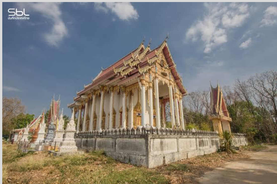
วัดวังตะกูน ต.วังตะกูน อ.บางมูลนาก จ.พิจิตร