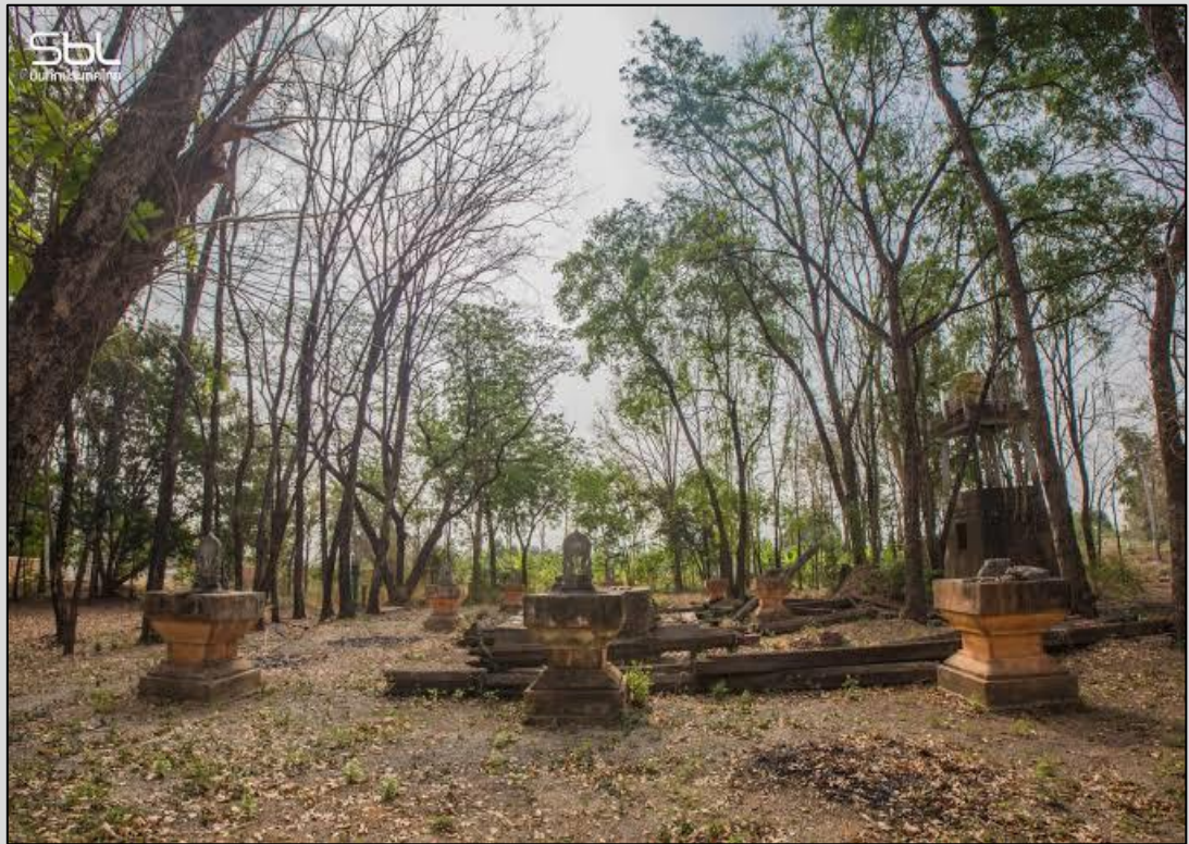
วัดวังตะกูน ต.วังตะกูน อ.บางมูลนาก จ.พิจิตร