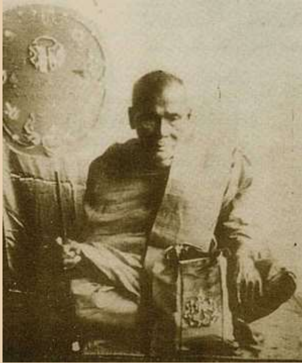
หลวงพ่อแช่ม วัดตาก้อง

http://www.amuletheritage.com/pdf/a66.pdf