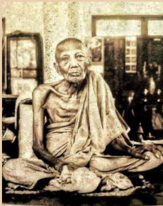
หลวงพ่อน้อย วัดธรรมศาลา

http://www.amuletheritage.com/pdf/a66.pdf