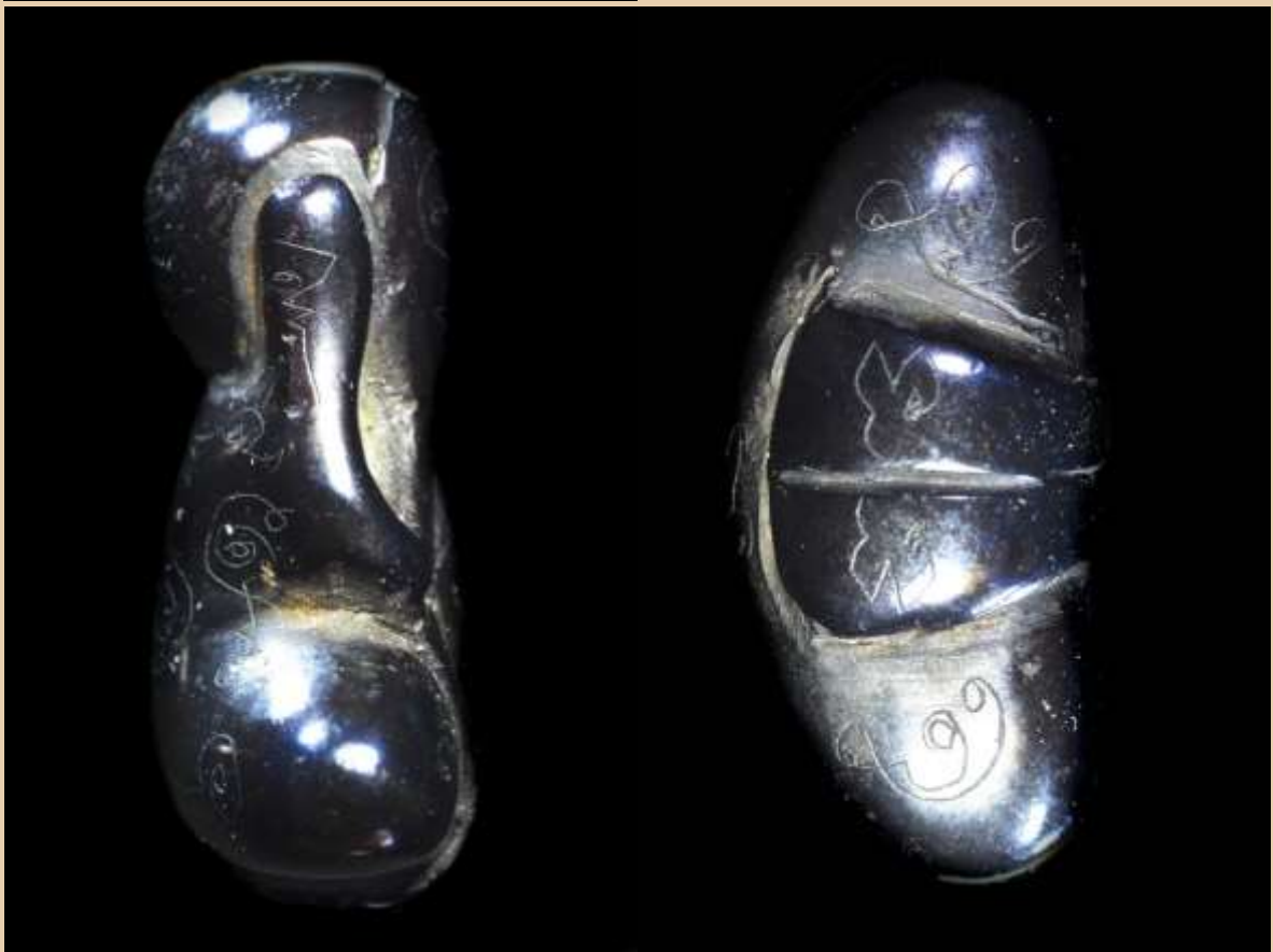
พระปิตตาหลวงปู่ภาค เนื้อเมฆพัด