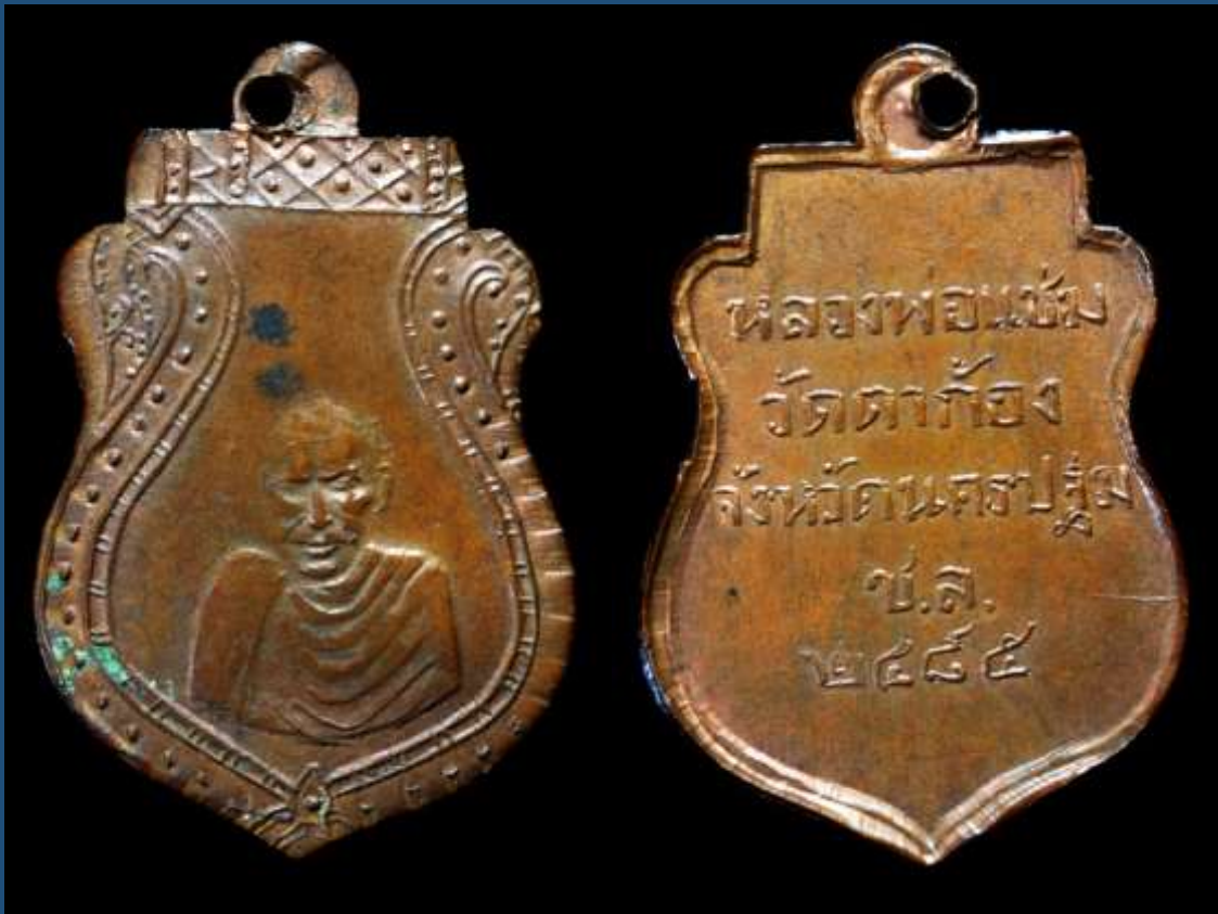
เหรียญหลวงพ่อแช่ม พิมพ์ใบเสมา รุ่นแรก

เหรียญหลวงพ่อแช่ม พิมพ์ใบเสมา รุ่นแรก วัดตาก้อง จ.นครปฐม ด้านหลังของเหรียญจะเป็นแอ่ง ท้องกระทะน้อยๆ ซึ่งเกิดจากแรงปั๊มกระแทกเดิมๆ ซึ่งเป็นเอกลักษณ์เฉพาะตัวของเหรียญปั๊มหลวง พ่อแช่มรุ่นนี้ เหรียญนี้สร้างเป็นครั้งแรกและปลุกเสกในปี พ.ศ. 2485