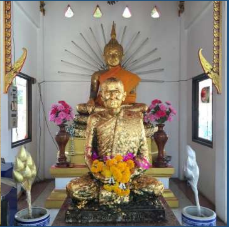
หลวงพ่อแช่ม

ปล่อยวาง เล่ากันว่า มีอยู่คราวหนึ่ง ท่านเคยรับนิมนต์เข้ากรุงเทพฯ ในพระราชพิธีหลวง สมเด็จพระสังฆราชเจ้า กรมหลวงชินวราลงสิริวัฒน์ แห่งวัดราชบพิธ พบกับหลวงพ่อแช่ม เห็นครองจีวรเก่าคร่ำมอมแมม "ครองผ้ามอมแมมแบบนี้ทำจะไม่เอาใจใส่เรื่องสวดมนต์ปาฏิโมกข์"