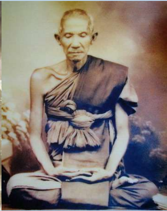
หลวงพ่อนก วัดนาคราช