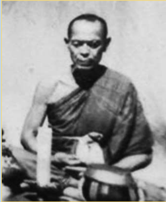
หลวงพ่อดำ