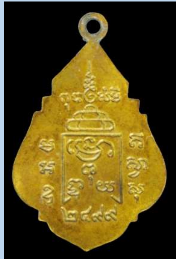
เหรียญหลวงพ่อเหลือ วัดสาวชะโงก ปี 2499