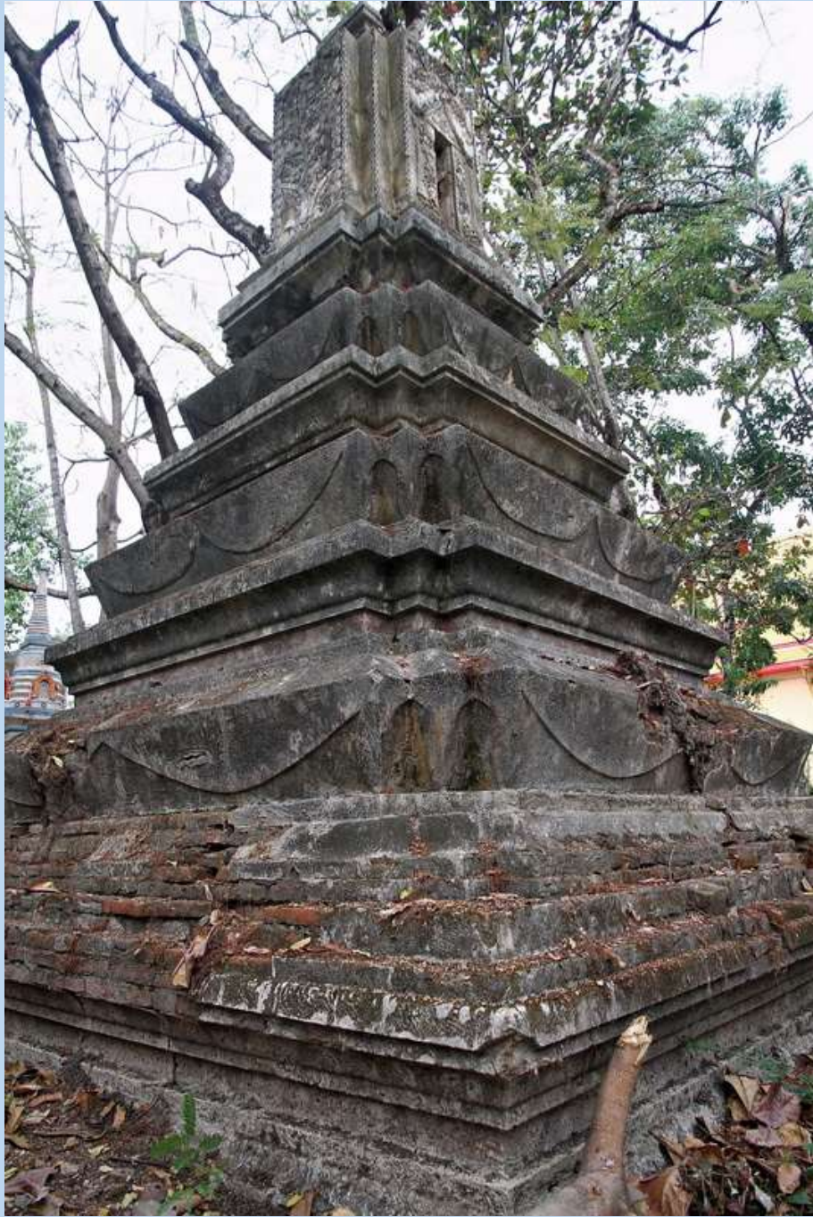
เจดีย์ที่เก็บอัฐิพระอิการชีก