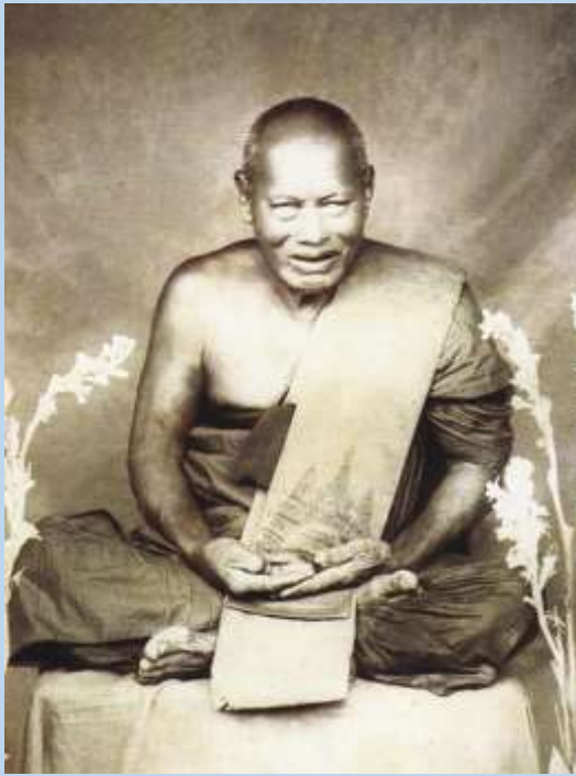
หลวงพ่อปาน วัดคลองด่าน