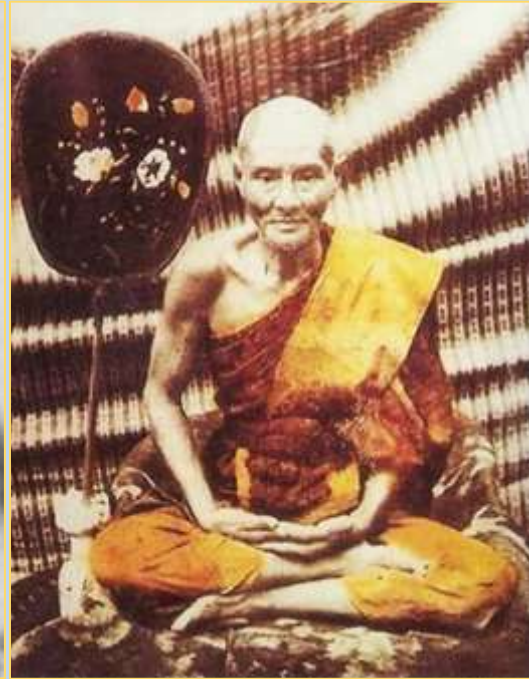
หลวงปู่ยิ้ม จันทโชติ