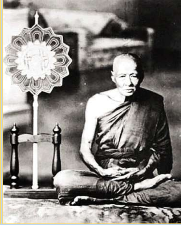
หลวงพ่ออี วัดลัทธิบ