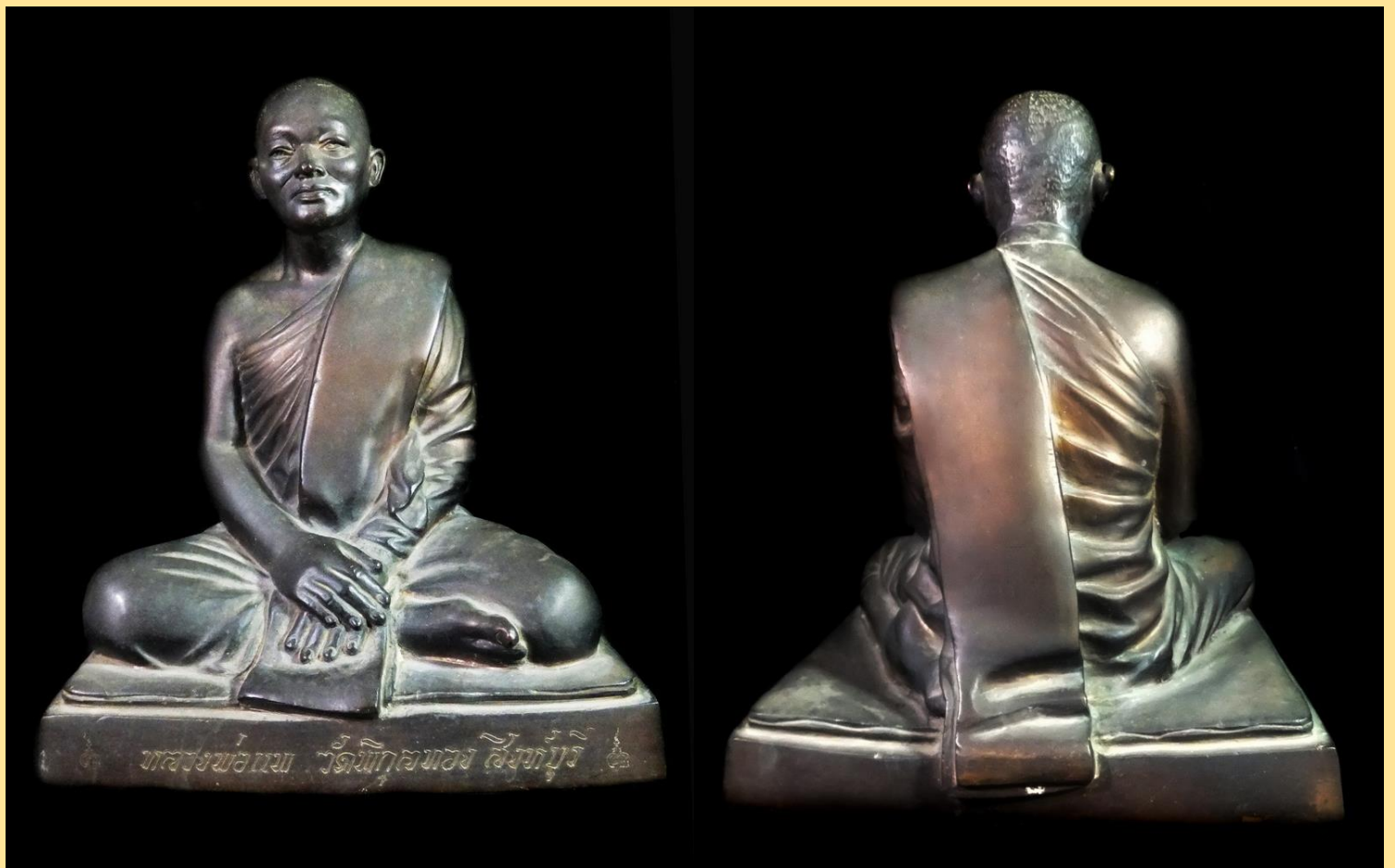
พระบูชา หลวงพ่อแพ วัดพิกุลทอง รุ่นแรก

พ.ศ. ๒๕๓๘ ก่อสร้างอาคารหลวงพ่อแพ เข้มงกโร เป็นอาคารคอนกรีตเสริมเหล็ก สูง ๙ ชั้น มูลค่า ๑๒๐,๐๐๐,๐๐๐ บาท (หนึ่งร้อยยี่สิบล้านบาทถ้วน) ประกอบพิธีวางศิลาฤกษ์เมื่อ วันที่ ๒๙ มีนาคม พ.ศ. ๒๕๓๘ อาคารหลังนี้มีพื้นที่ใช้สอย ๑๑,๔๓๐ ตารางเมตร โดย ชั้นที่ ๑ - ๒ เป็นแผนกบริการผู้ป่วยนอก ชั้นที่ ๓ - ๔ เป็นฝ่ายอำนวยการ ชั้นที่ ๕ - ๙ เป็นห้องผู้ป่วย จำนวน ๖๐ ห้อง ก่อสร้างแล้วเสร็จ และเริ่มให้บริการตั้งแต่วันที่ ๑๒ พฤษภาคม พ.ศ. ๒๕๔๑