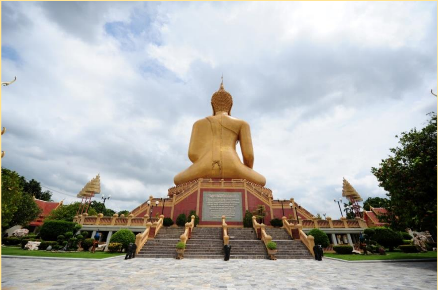
พระพุทธรูปสุวรรณมงคลมหายานี (หลวงพ่อใหญ่)