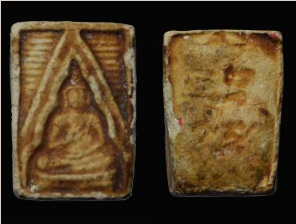
พระผงของขวัญวัดปากน้ำ หลวงพ่อสด

ครั้งหนึ่งพูดกับหลวงพ่อสด ว่า จะเอาติดตัวไปตามหัวเมืองต่าง ๆ เมื่อใครต้องการจะได้ ให้เป็นของขวัญต่อเขา หลวงพ่อว่าทำอย่างนั้นไม่ได้ พระของเรามีคุณภาพจริง ผู้อยากได้ต้องมาเอง ถ้าเอาไปอย่างนั้นของดีก็กลายเป็นของเก๊ ไม่เป็นที่ตั้งแห่งความเลื่อมใสและพูดแถมท้ายว่า อย่างกลัว เลย แปดหมื่นสี่พัน ๒ หนก็ไม่พอแจก และเป็นจริงดังคำพูดของหลวงพ่อ.