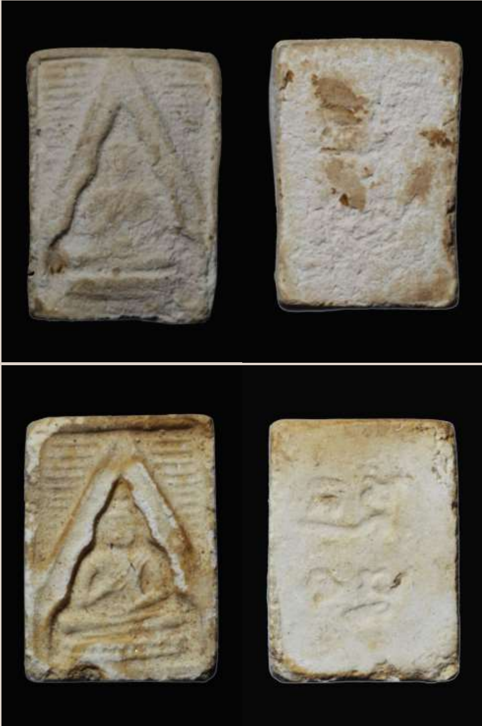
พระผงของขวัณวัดปากน้ำ หลวงพ่อสด