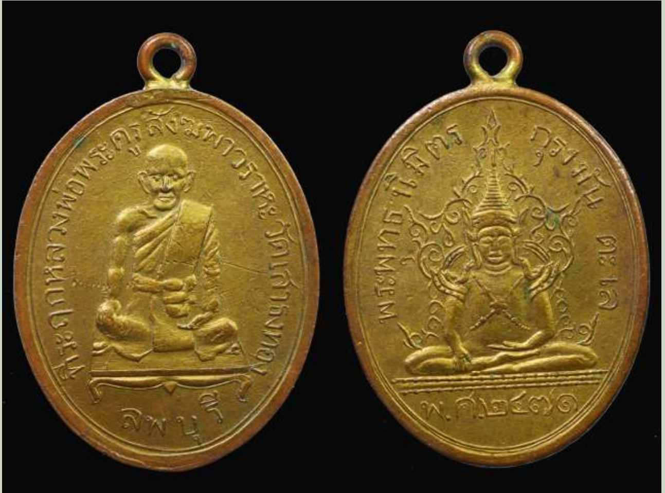
พระเหรียญหลวงปู่เนียม วัดเสาชงทอง ลพบุรี เหรียญรุ่นแรก สร้างขึ้น ปี พ.ศ. 2471 เนื่องในวโรกาสที่หลวงปู่เนียม ได้รับสมณศักดิ์เป็น พระสังฆการวาหมณี