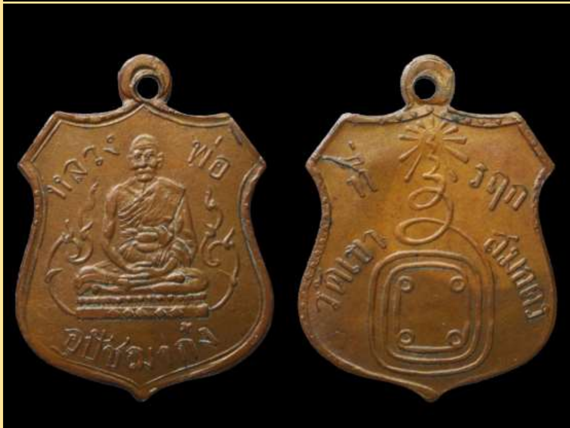
เหรียญหลวงพ่อก้ง วัดเขาสมอคอน รุ่นแรก สร้างราวปีพ.ศ. 2464