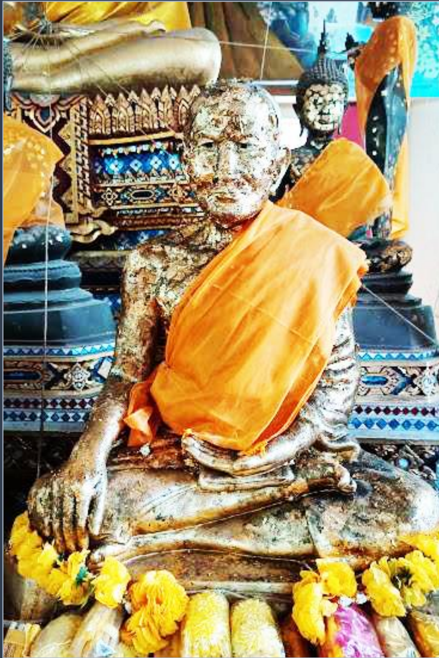
รูปหล่ออุปัชฌาย์จั่น จันทสโร จัดสร้างใน ปี พ.ศ.2465