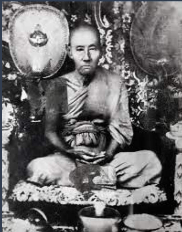
หลวงพ่อกราณ วัดโคกโพธิ์