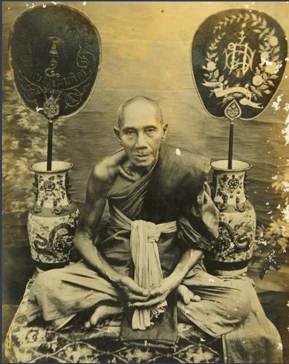
หลวงพ่อกั่น วัดพระญาติ