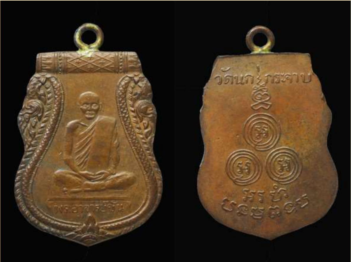
เหรียญหลวงพ่อชั้น อินทปัญญา วัดนงกระจาบ พ.ศ. 2480