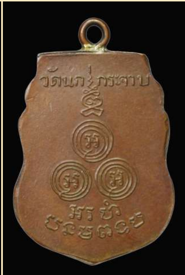
เหรียญหลวงพ่อชื้น อินทปัญญา วัดนภักฐะจาบ พ.ศ. 2480