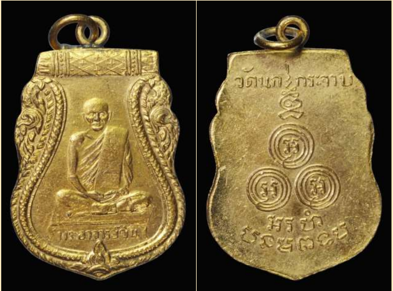
เหรียญหลวงพ่อชั้น อินทปัญญา วัดนกระจาบ พ.ศ. 2480