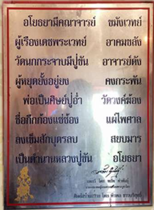
หลวงพ่อชัน อินทปัญญา วัดนกกกระจาบ