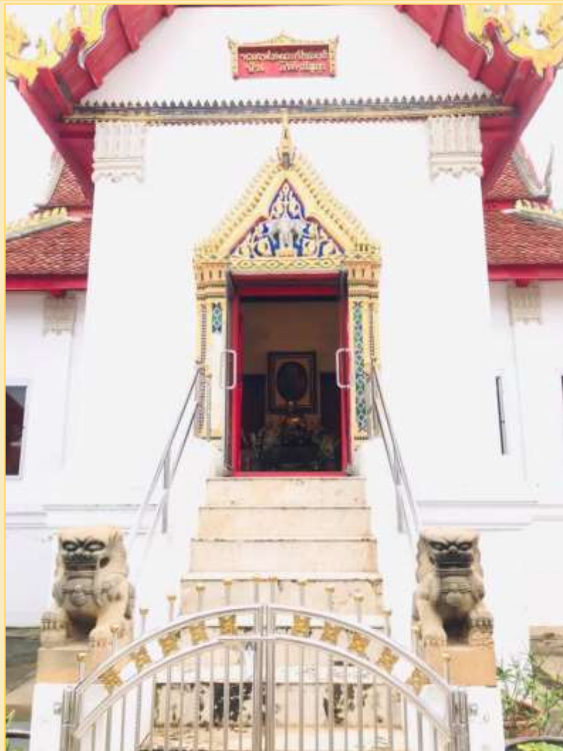
วิหารพระอุปัชฌาย์ชั้น อินทปถมนุชา