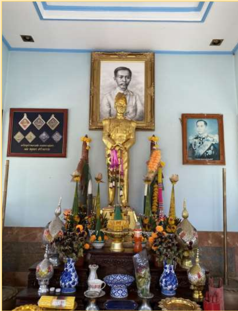
รูปหล่อ พระเจ้าบรมวงศ์เธอ กรมหลวงชุมพรเขตอุดมศักดิ์ ณ วัดนกกะจาบ

ในปัจจุบันนี้บริเวณที่เคยเป็นพลับพลาที่ประทับของในหลวงรัชกาลที่ ๖ เป็นที่ตั้งของโรงเรียนวัดนกกะจาบ (สิริสรณ์ประชาสรรค์) และได้ก่อสร้างศาล พลเรือเอก พระเจ้าบรมวงศ์เธอ พระองค์เจ้าอาภากรเกียรติวงศ์ กรมหลวงชุมพรเขตอุดมศักดิ์ ไว้เป็นอนุสรณ์สถาน เพื่อเป็นที่เคารพสักการะแก่ประชาชนโดยทั่วไป ณ บริเวณวัดนกกะจาบด้วย