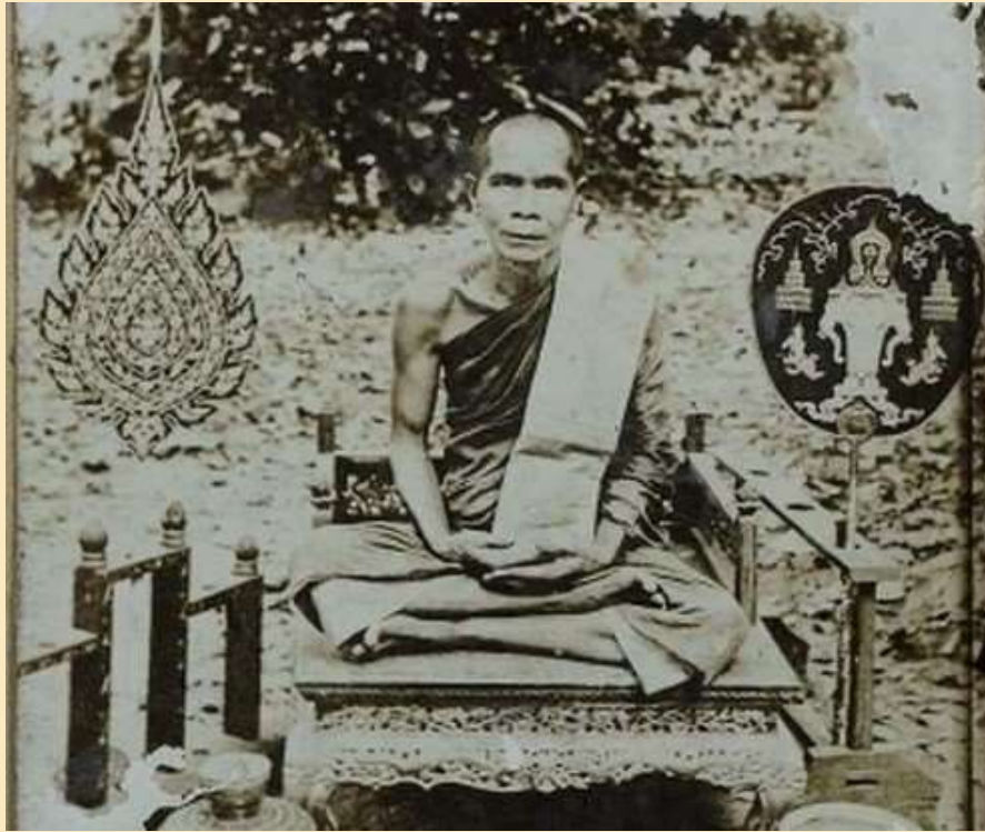
หลวงพ่อ่ำ วัดวงษ์ อยุธยา

ถูกนักเลงถิ่นอื่นดักทำร้ายทุบตี แต่ปรากฏว่า ตีเท่าไรก็ไม่แตก ไม่เจ็บ ไม่บอบช้ำ สร้างความประหลาดใจให้กับนักเลงถิ่นอื่นเป็นอย่างยิ่ง เหตุการณ์ครั้งนั้น ทำให้ลูกศิษย์ของหลวงพ่อ่ำ ชื่นชอบให้หลวงพ่อ่ำ สักยันต์บ้าง ลงกระหม่อมบ้าง ปรากฏในทางคงกระพันชาติเป็นเยี่ยม