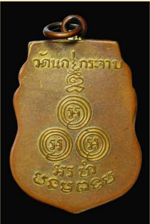
เหรียญหลวงพ่อขัน อินทปัญญา วัดนงคราเจาบ พ.ศ. 2480