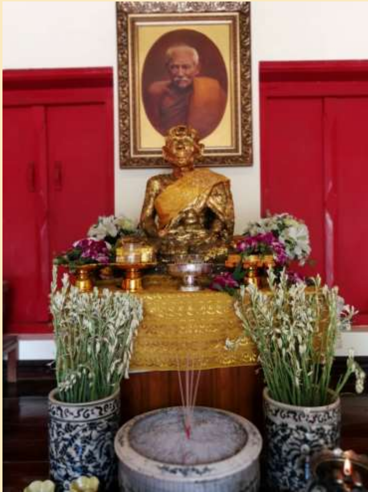
รูปหล่อ พระอุปัชฌาย์ชัน อินทปณฺญา