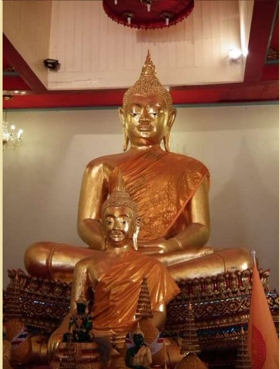
พระพุทธอนันตชินโณภาส พระประธานในอุโบสถ วัดพรหมนิวาसरวิหาร