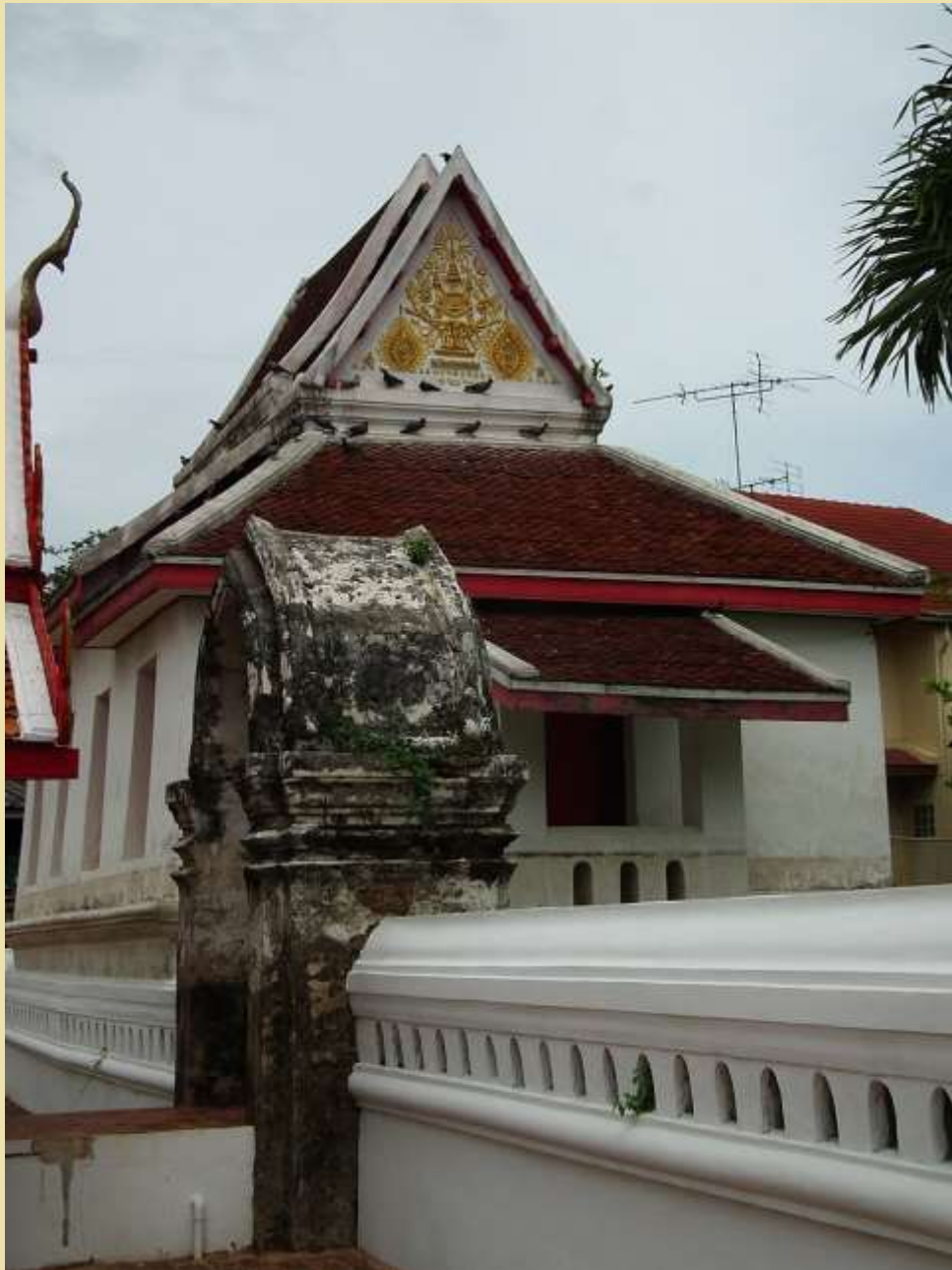
ที่ประทับรัชกาลที่ 4 สมัยเมื่อทรงผนวช ภายในวัดพรหมนิวาสารวิหาร