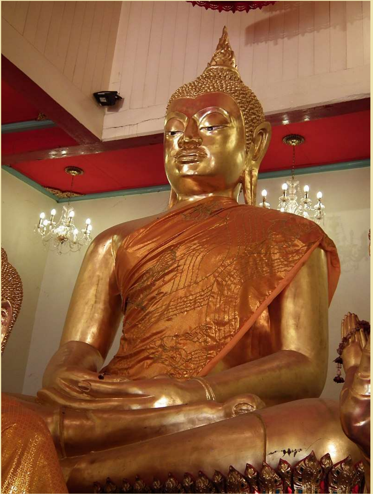
พระพุทธอนันตชินโณภาส พระประธานในอุโบสถ วัดพรหมนิวาสารวิหาร