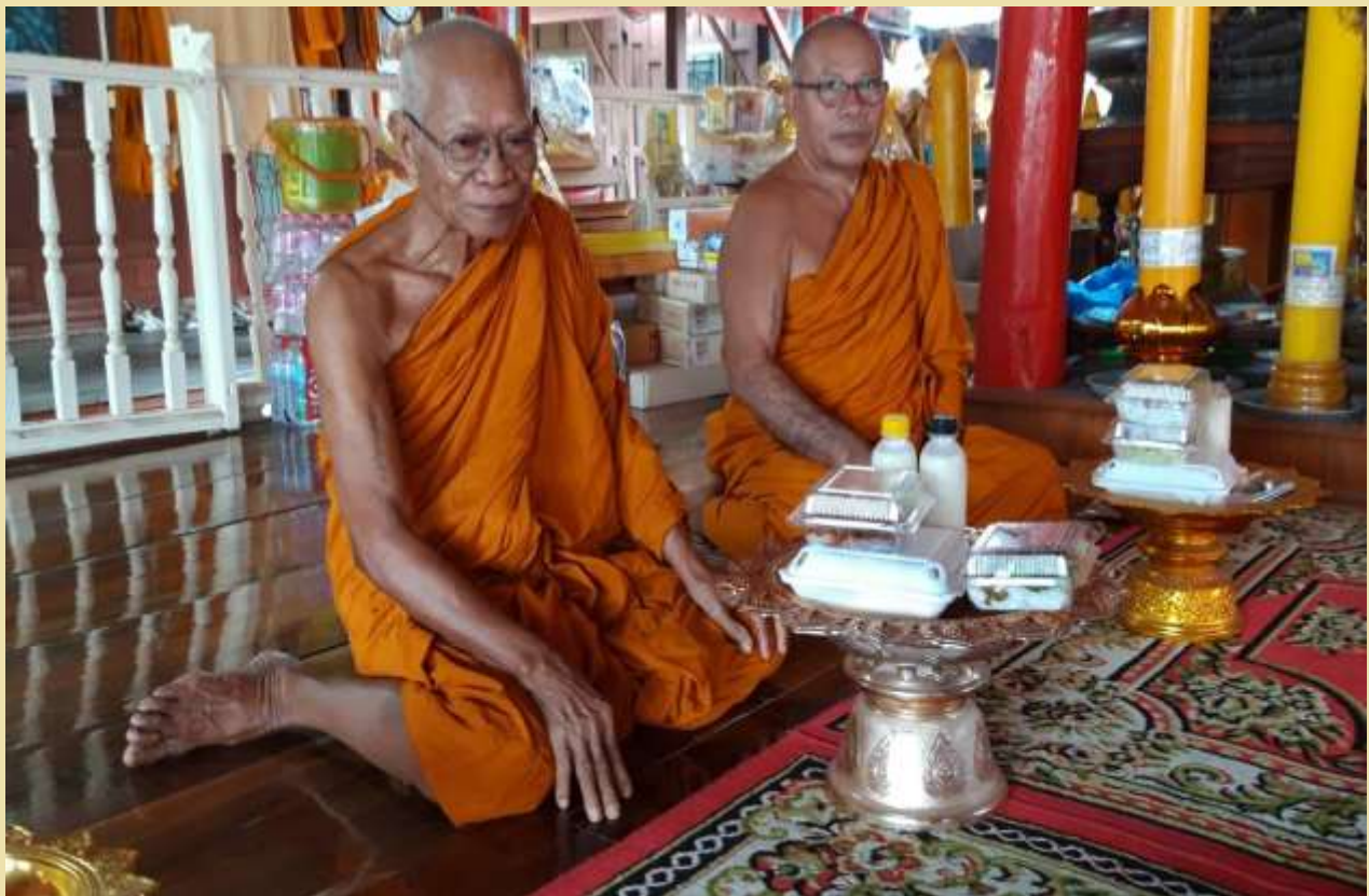
พระเอม และ พระกำเนิด วัดพรหมนิวาสนารวิหาร