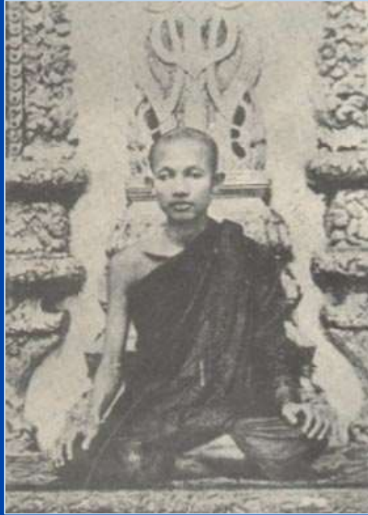
สมเด็จพระมหาสมณเจ้ากรมพระยาวชิรญาณวโรรส