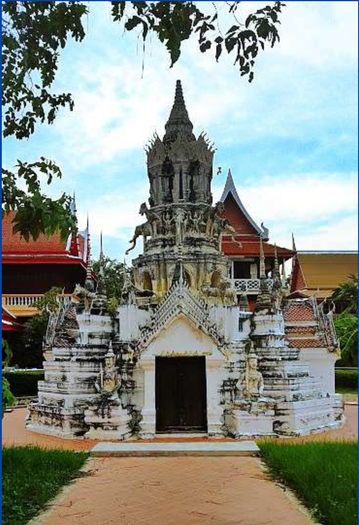
เจดีย์หงสา