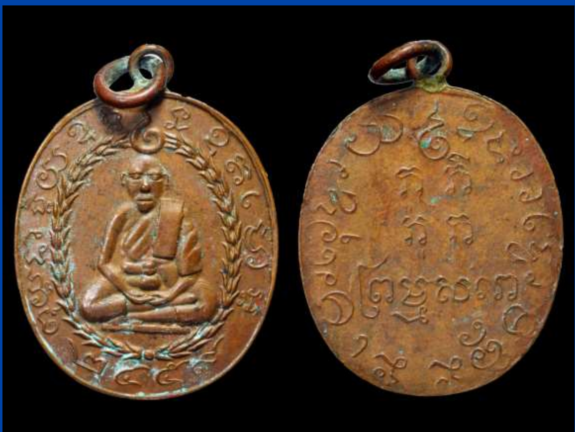
เหรียญรูปเหมือนหลวงพ่อแก้ว รุ่นแรก ปี พ.ศ. 2459