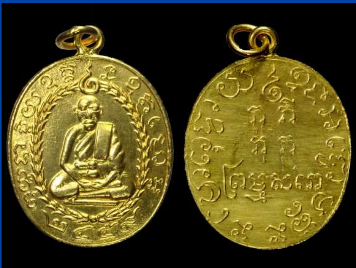
เหรียญรูปเหมือนหลวงปู่แห้ว รุ่นแรก ปี พ.ศ. 2459