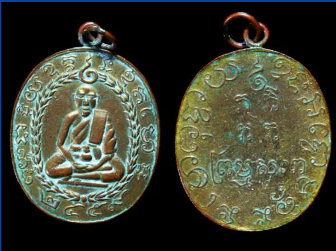
เหรียญรูปเหมือนหลวงพ่อก้าว รุ่นแรก ปี พ.ศ. 2459

ลักษณะเหรียญ ด้านหน้า มีรูปเหมือนหลวงพ่อก้าวนั่งขัดสมาธิเต็มองค์ ล้อมรอบด้วยลายช่อดอกไม้แบบพวงมาลัย เนื้อสีระชะเป็นตัว "อุณาโลม" พร้อมอักขระขอม และระบุปี พ.ศ. ที่สร้าง "๒๔๕๙" ด้านหลัง เป็นอักขระขอม ตรงใต้หูเหรียญมีอุณาโลม ตรงกลาง มีคาถาหัวใจสี่สหาย "ภู ภิ ภู ภาะ" ส่วนแถวล่างนั้นเป็นนามฉายาว่า "พรหมสโร"