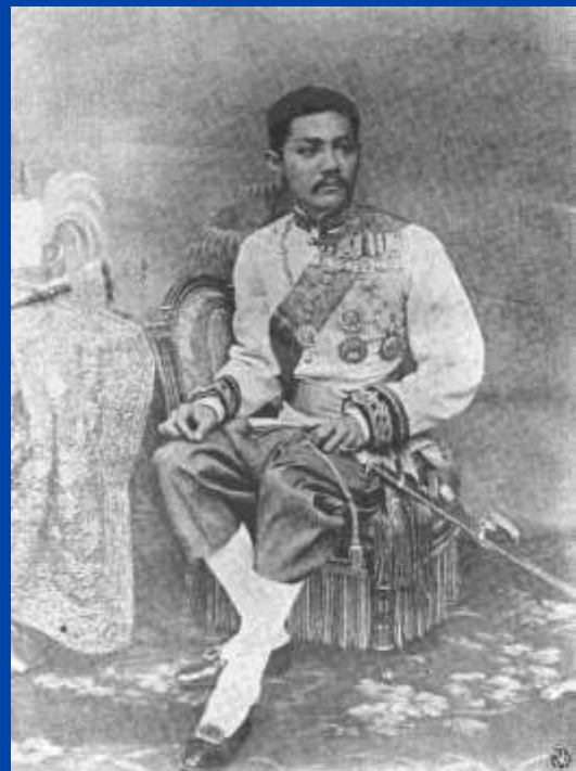
สมเด็จพระเจ้าฟ้าภาณุรังสีสว่างวงศ์ กรมพระยาภาณุพันธุมาศวรเดช