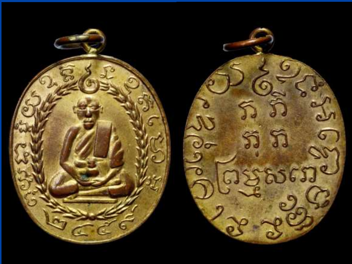
เหรียญรูปเหมือนหลวงพ่อแก้ว รุ่นแรก ปี พ.ศ. 2459