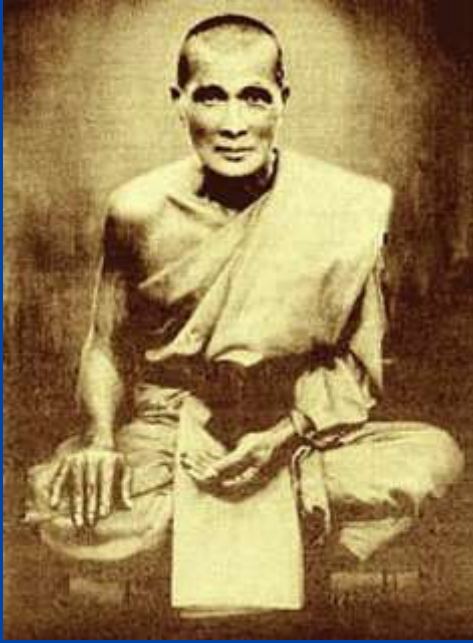
หลวงพ่อคง วัดบางกะพ้อม