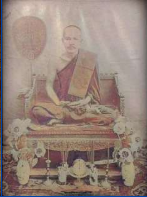
หลวงพ่อบาย วัดช่องลม