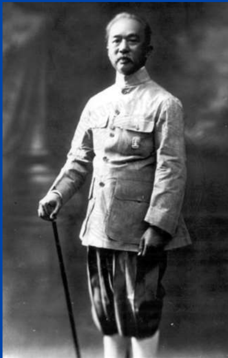
สมเด็จพระกรมพระยาดำรงราชานุภาพ