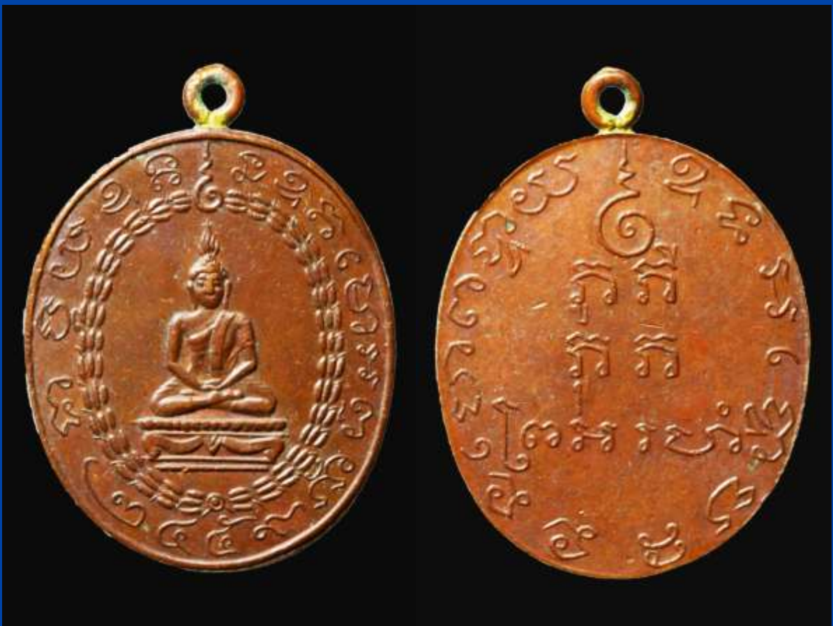
เหรียญพระพุทธรูป หลวงพ่อแก้ว รุ่นแรก ปี พ.ศ. 2459

ลักษณะเหรียญ ด้านหน้าตรงกลางเป็นรูปจำลองพระพุทธรูปปฏิมากรปางสมาธิ รอบรูปพระพุทธรูปเป็นลายช่อดอกไม้แบบพวงมาลัย เหนือศีรษะเป็นตัว "อุณาโลม" พร้อมอักขระขอบโดยรอบขอบว่า "พุทฺธ ฐาปิต ยะฮุด นะฮุด โมฮัด" และ ปี พ.ศ. ที่สร้าง "๒๔๕๙" ด้านหลัง เป็นอักขระขอม โดยตรงใต้หูเหรียญเป็นตัว "อุณาโลม" ตรงกลาง คือ "ภู ภิ ภู ภาะ" ส่วนแถวล่างนั้นเป็นนามฉายาว่า "พรหมสโร"