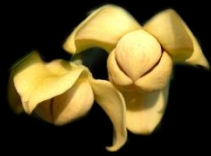
จตุพร สุวรรณปากแพรก

เป็นไม้ในวรรณคดีสี่เหลืองสวย หอมระรวยดอกไม้ไรรินนามงามดินร่วน เย็นระรินชื่นใจนอกถิ่นลำควน ช่างเขี้ยวชวนให้ซึ่งตรึงติดตา มาวันนี้มีลำควนไว้สองต้น ใบเรียวมนที่ยาวนั้นเป็นมันหนา เฟ้ารคน้ำพรวนดินตามเวลา หวังไว้ว่าวันหนึ่งดอกออกได้ชม วันหนึ่งนั้นฉันเข้าใจไม่เร็วหรือ กว่าจะออกดอกนับสิบปีที่น่านสม ก็จะคอยรอวันนั้นได้เด็ดดม มาเชยชมดอกไม้ลำควนสี่เหลืองนวล