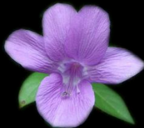
อัญชลี ณ เชียงใหม่