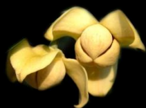
ศกุนตลา ณ หนองคาย

ลมโชยเรื่อยเรื่อยมาเวลานี้ เจ้าลำควน ของพี่ ไปอยู่ไหน ได้ยินเสียง เปรี้ยกมา หาดวงใจ ลำควนอยู่ ไม่ไปไหน นะพี่ยา โอ้ลำควน เคยเห็น แต่เก่าก่อน ต้องจากจร ซ่อนเร้น ไม่เห็นหน้า รักหนอรัก จำต้อง หักใจลา พี่ไม่มา นื่องระทม ชื่นขมใจ