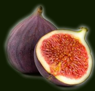
ศกุนตลา ณ หนองคาย

ช่วยยับยั้ง เซลล์มะเร็ง โรคหัวใจ ปรับสมดุล ของร่างกาย ให้คงที่ โรคเบาหวาน แผลในปาก คุณงามะดี ลดริ้วรอย ได้ด้วยชี บำรุงตา ใบก็สวย ผลก็มี คุณประโยชน์ สิ่งให้โทษ ช่วยกำจัด จากร่างหนา ให้สดชื่น ได้รื่นรมย์ สมอูรา มะเดื่อพา ให้สุขสันต์ ทุกวันจริง