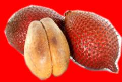
อัญชลี ณ เชียงใหม่

ไม้ระกำนำมาเป็นฝาบ้าน สวยตระการร่มรื่นชื่นโฉน ทำจุกน้ำของเด็กได้ทั่วไป แสนถูกใจไม่ระกำนำสุขเอย