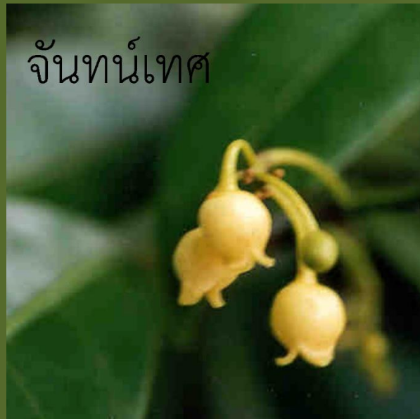
จันท์เทศ