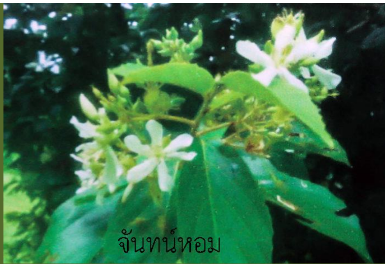
จันทน์หอม