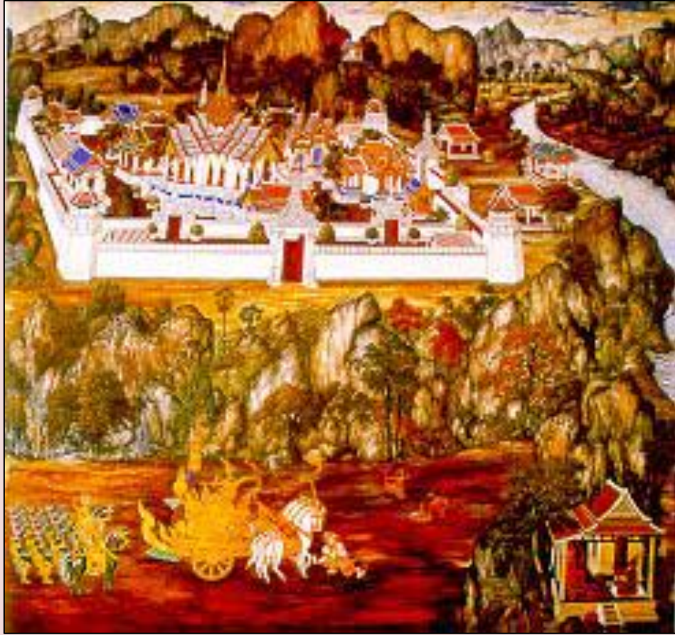
พระรามพบพระโอรส