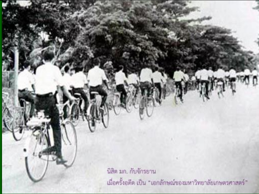
นิสิต มก. กับจักรยาน เมื่อครั้งอดีต เป็น "เอกลักษณ์ของมหาวิทยาลัยเกษตรศาสตร์"

เกษตรศาสตร์ของเราแต่ก่อน เป็นป่าดงดอนไร่ความงามตา เหล่าพี่ชายของเราสร้างมาฝ่าฟันพงพี ปลดทิ้งซึ่งความปราชัย หากใครอาจมาย่ำยี ก่อกรรมมากมี ทุกคนพลีชีพตน เกษตรศาสตร์ครั้งก่อนยากแค้น ตอบแทนแก่เราหมองหม่น ทรากตรำลำเค็ญยากเข็ญ จำทน เข้ม เลือดเราเข้มข้น รักยิ่งเปี่ยมล้นใจ ให้เกษตรเราคงอยู่ เคียงคู่ดำรงผืนธนาชัย สร้างเสรี ให้เกษตรไทยตลอดสมัยงามพร้อม ต่อสู้ศัตรูองอาจ จนสามารถยิ่งกว่าเขา เพื่อเกษตร ของเรา ขอยอมเอาร่างแทน ให้เกษตรนั้นอยู่ยืนยง เกษตรกรก็คงหนาแน่น เกียรติคุณแผ่ไปทั่ว ทั้งดินแดน รวมรักเป็นปึกแผ่น ณ แดนถิ่นของไทย เชี่ยวเกษตร เชี่ยว-เกษตร ไชโย-พวกเรา(ซ้ำ) ใหม่-เก่า พวกเรา-ไชโย ช่วยกันโห่ร้องเพื่อเกษตรของเรา คณะเราไม่ยอมให้ด้อยถอยลง ต่ำเราต้องคำขูให้สูงจรุงศรี เชี่ยวเกษตรอยู่ที่ใดชัยต้องมี เชี่ยวเกษตรของเรานี้คือดวงใจ เชื่อเถิด เชื่อเถิด เราไม่ให้ต่ำลง เชื่อเถิด เชื่อเถิด เราก้าวหน้า ตรงไป จรรยา วิชา และกีฬาใดใด เราต้องประคองเอาไว้ระดับที่ดี