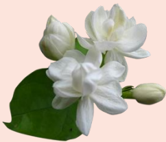
อัญชลี ณ เชียงใหม่

พระคุณแม่ท่วมท้นมากล้นฟ้า ยากจักหาใดทดแทนพระคุณได้ ตักของแม่นอนหนุนละมุนละม้าย ลูกรักแม่เทิดไว้ไม่ลืมเลย